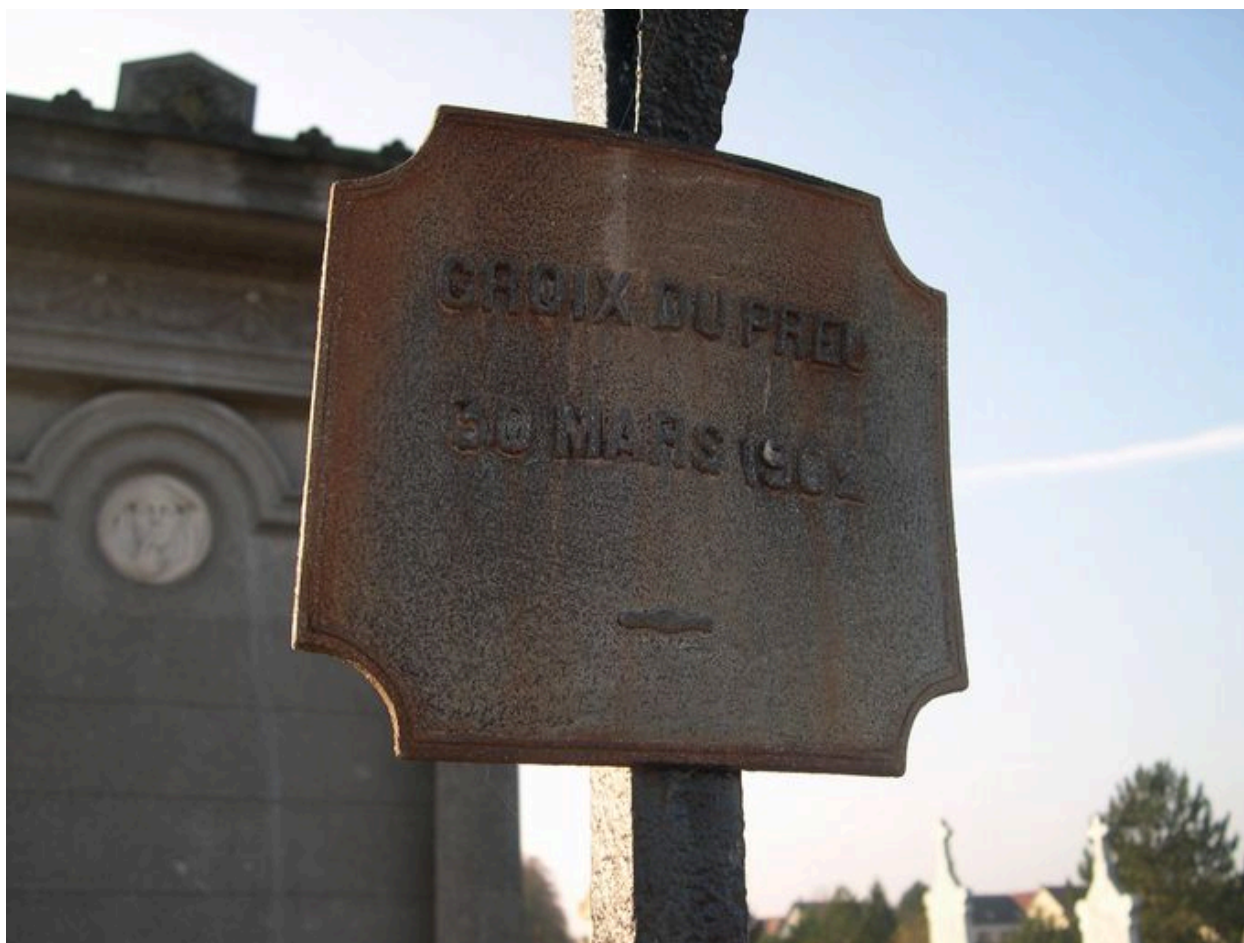
Vue de détail de la plaque.