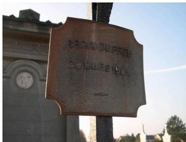
Vue de détail de la plaque.