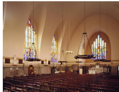
Vue intérieure vers le chœur. IVR22_20060200719VA