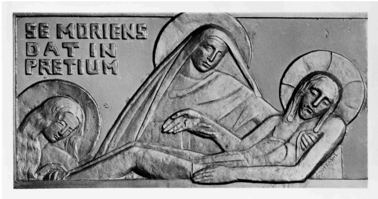
Fargniers. Église paroissiale. Bas-relief du maître-autel. La mise au tombeau. G. Dufrasne, sculpteur. Photographie, vers 1930.