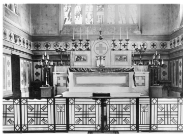
Fargniers. Église paroissiale. Vue du sanctuaire. La clôture de chœur et le maître-autel. Photographie, vers 1930. IVR22_19910202045XB