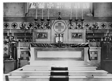
Fargniers. Église paroissiale. Le maître-autel. Photographie, vers 1930.