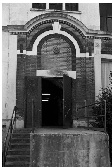
Atelier de fabrication sud. Détail. IVR22_19908001108Z