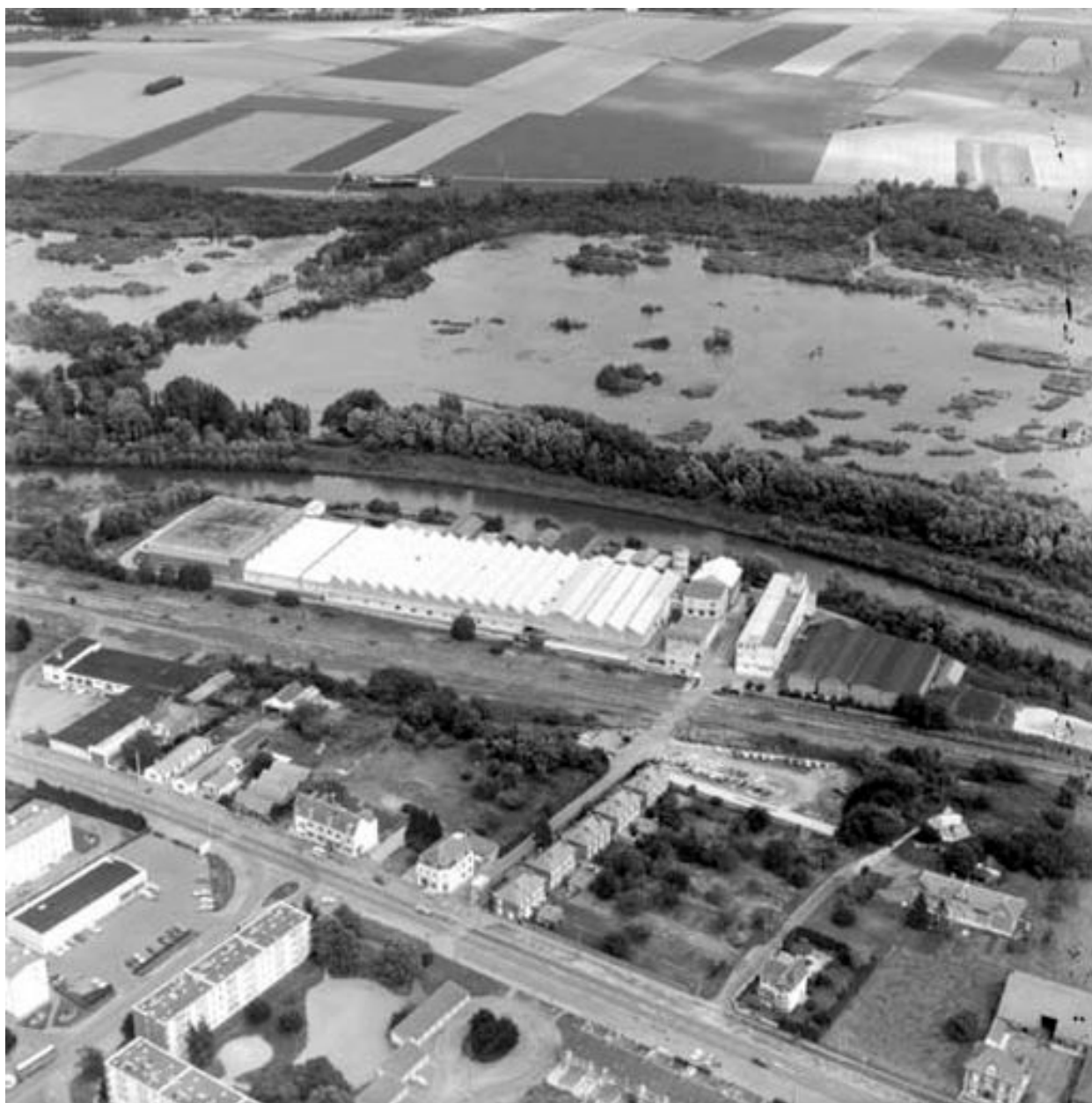
Vue aérienne, flanc sud.