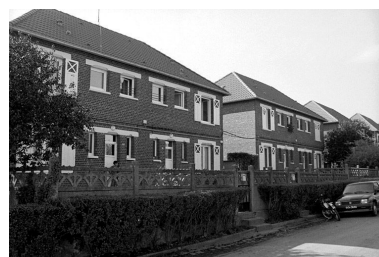
Logements d'ouvriers. IVR22_19908001111Z