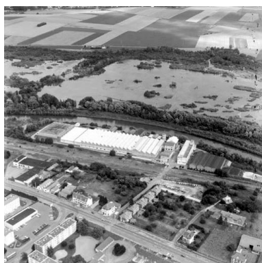
Vue aérienne, flanc sud.