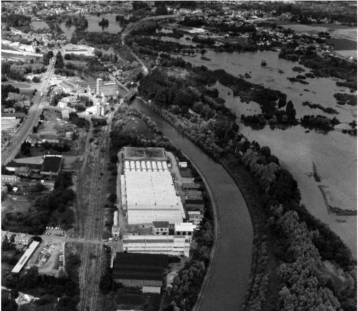
Vue aérienne, flanc sud.