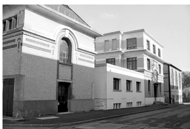
Bureau, chaufferie. IVR22_19908001110Z