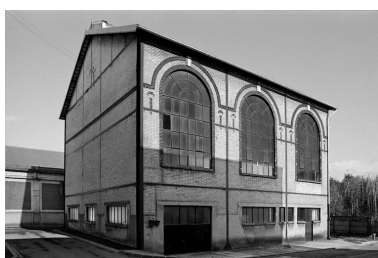
Chaufferie, flanc sud.