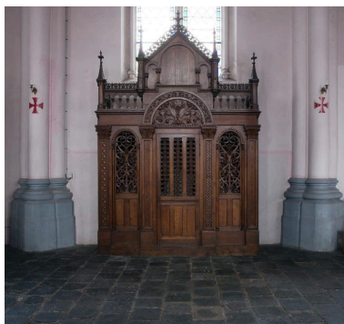
Vue générale d'un confessionnal.