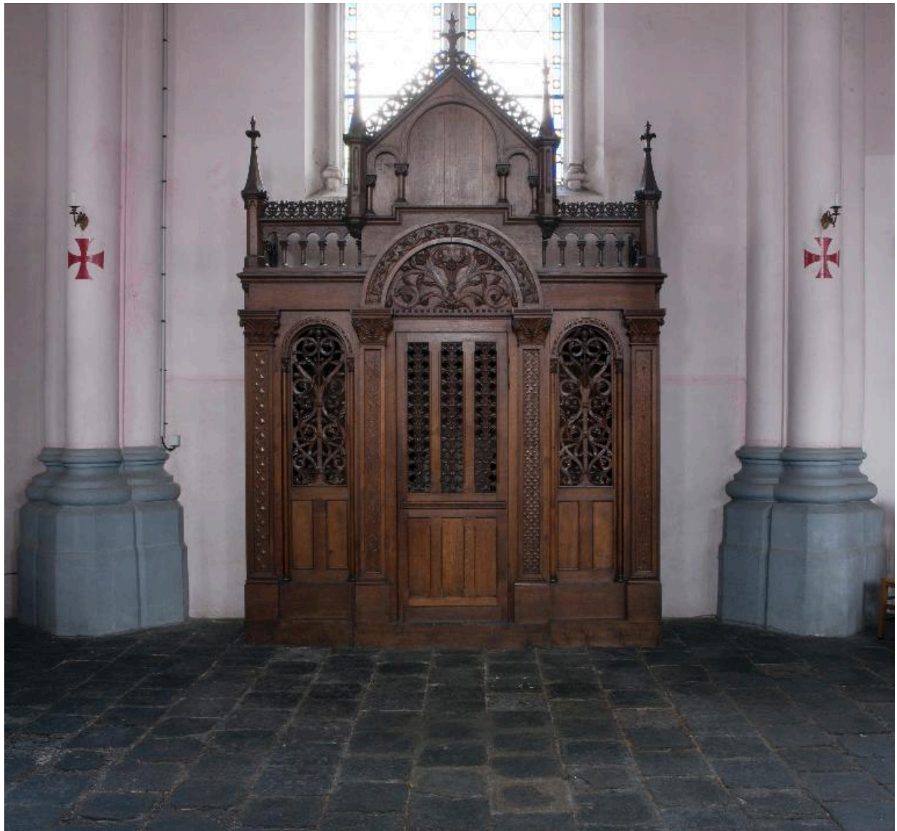
Vue générale d'un confessional.