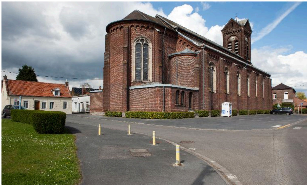
Vue générale du bas-côté sud et le chevet.