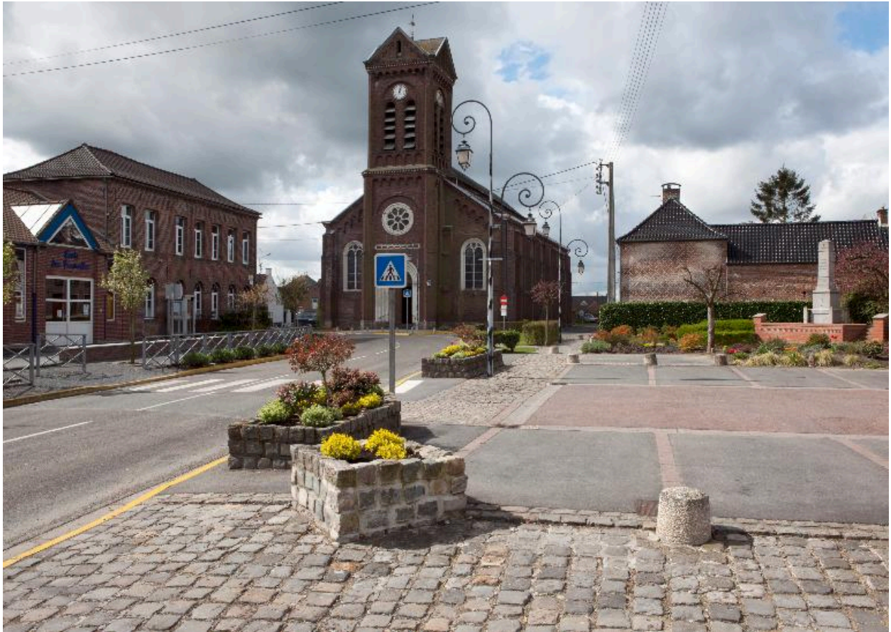
Vue générale de l'église et la place.