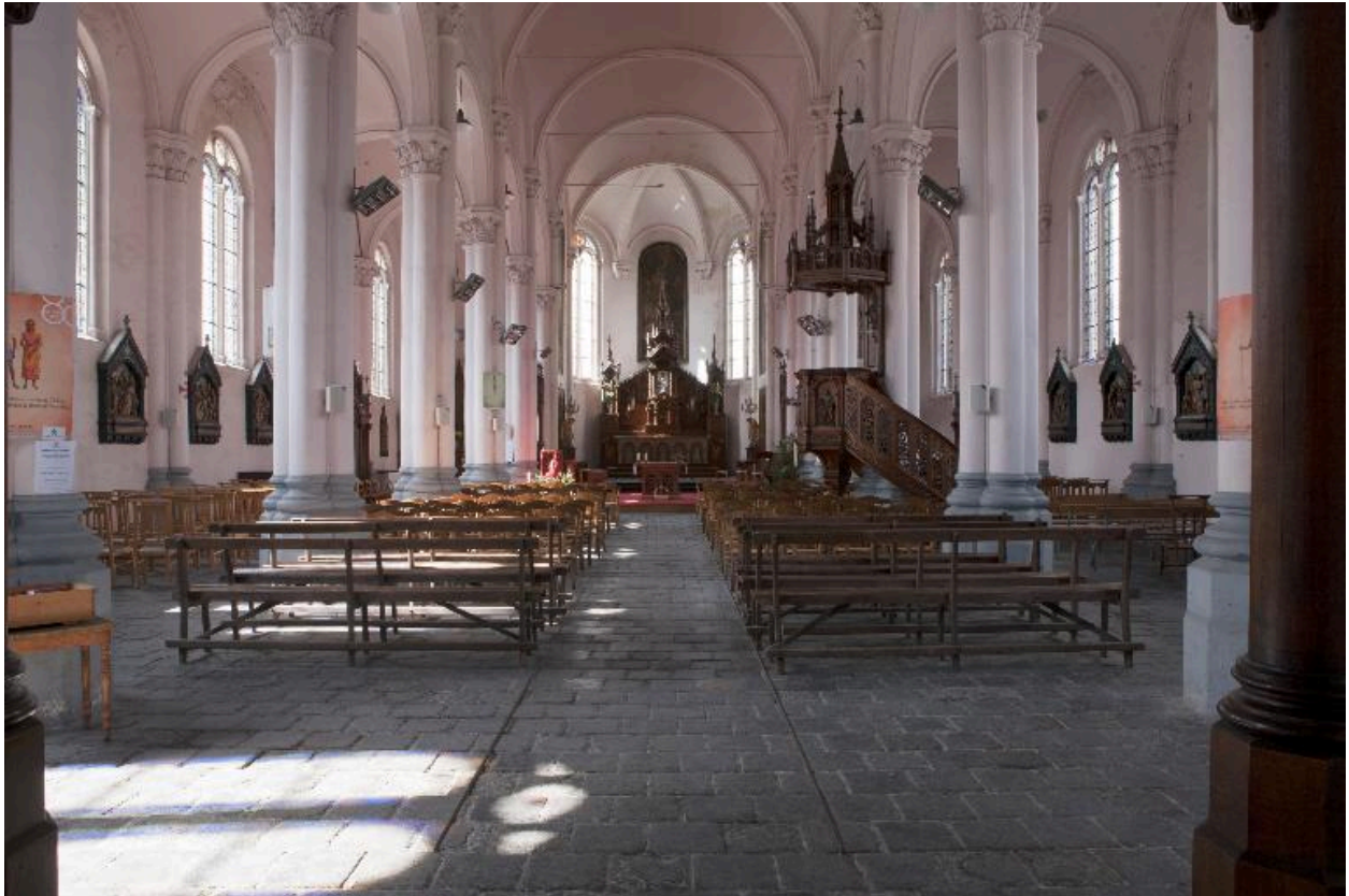
Vue générale vers chœur.