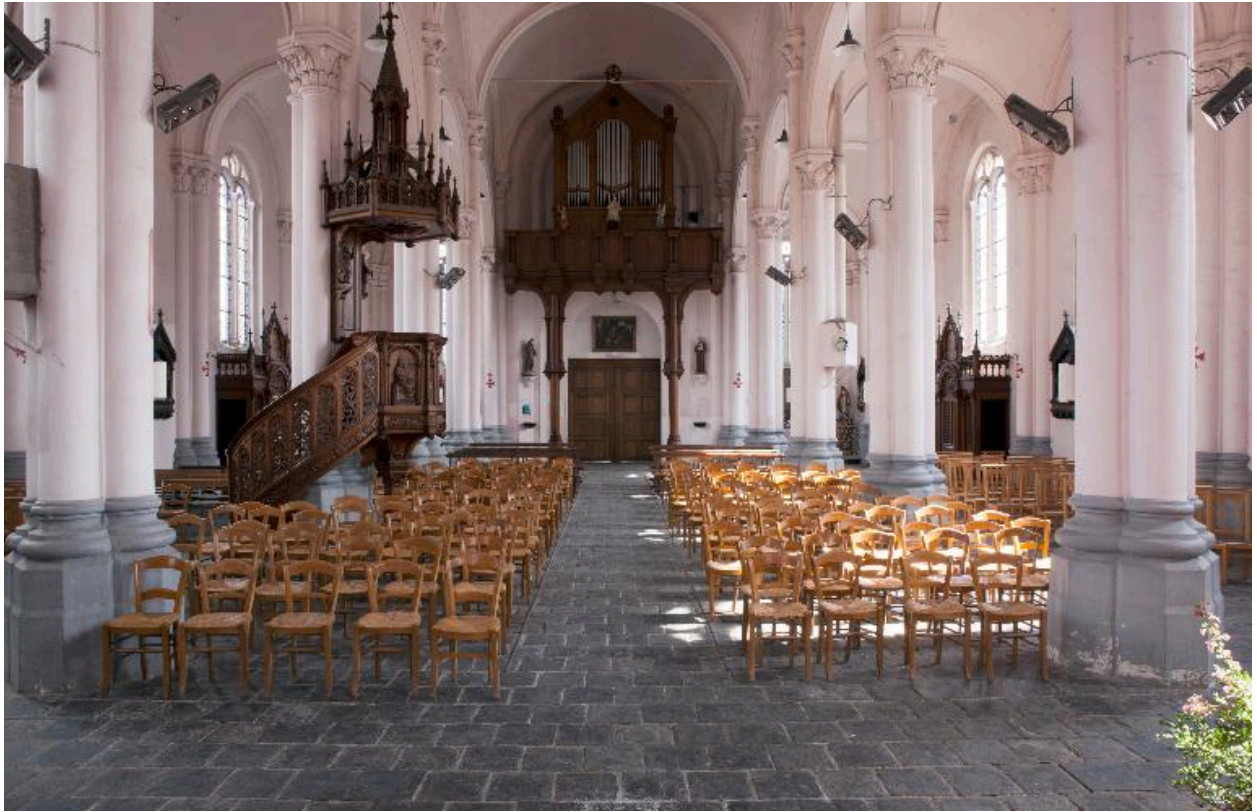
Vue générale intérieure vers l'entrée.