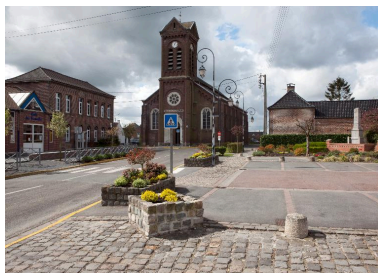
Vue générale de l'église et la place. IVR31_20125901611NUCA