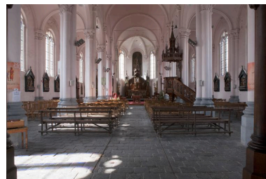
Vue générale vers chœur.