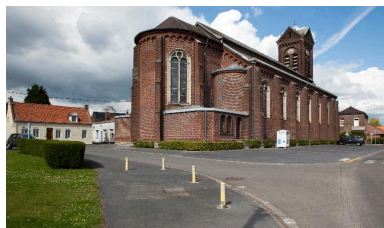
Vue générale du bas-côté sud et le chevet.