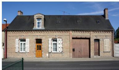
Vue d'ensemble, façade sur rue. IVR22_20098005121NUCA