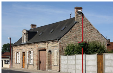
Vue d'ensemble. IVR22_20098005122NUCA