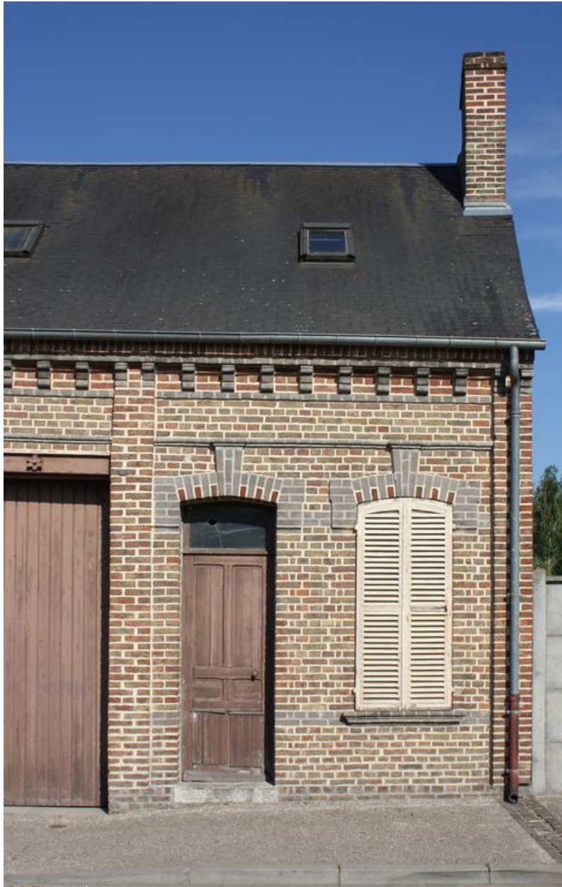
Logement annexe, façade sur rue.