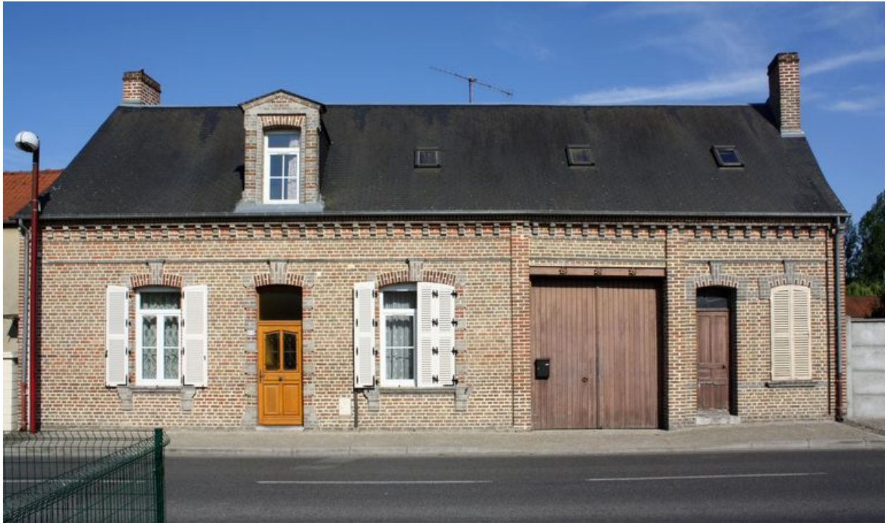
Vue d'ensemble, façade sur rue.