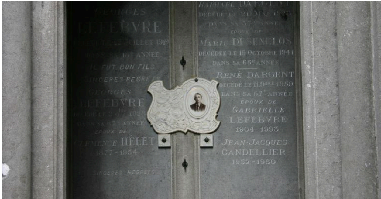
Détail de la plaque commémorative, ornée de la photo de Georges Lefebvre.