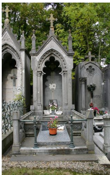
Vue générale. IVR22_20098001385NUCA