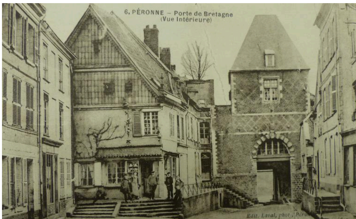
Péronne. Porte de Bretagne. Vue intérieure, carte postale, début 20e siècle (AD Somme ; 10R).