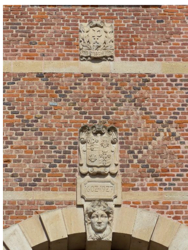
Vue de détail sur la clef et les blasons de la ville de Péronne.

IVR32_20178005245NUCA