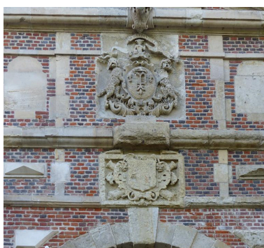
Vue de détail sur les blasons de la ville de Péronne (côté extérieur).

Phot. Isabelle Barbedor IVR32_20178005245NUCA