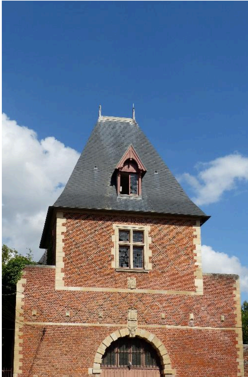
Partie supérieure de la porte.