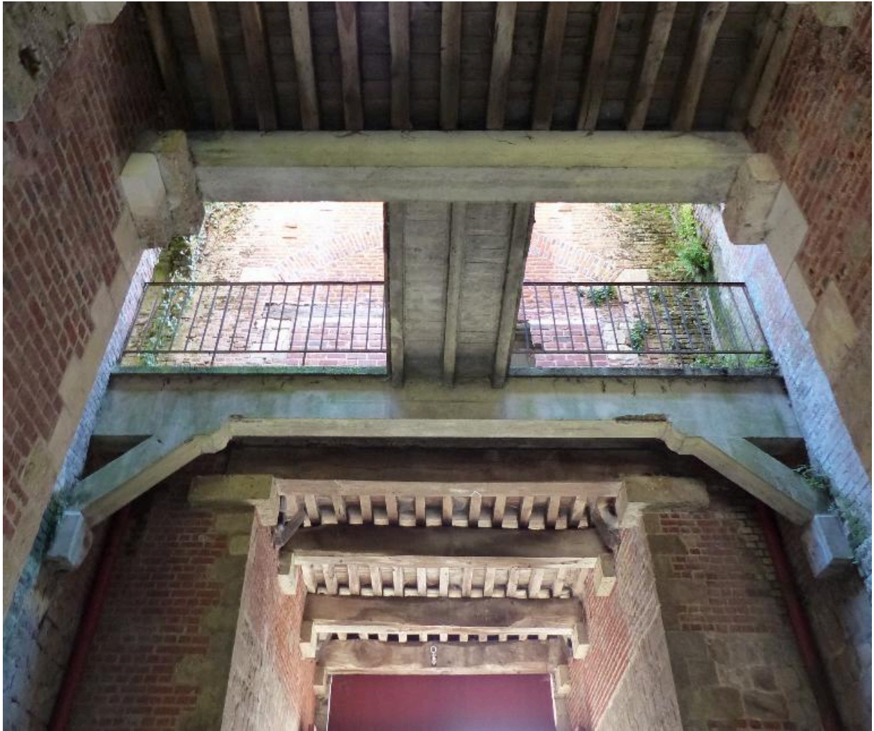
Vue intérieure de la porte.