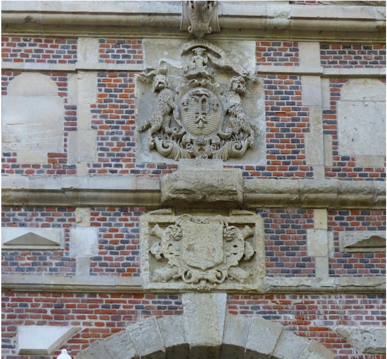
Vue de détail sur les blasons de la ville de Péronne (côté extérieur).