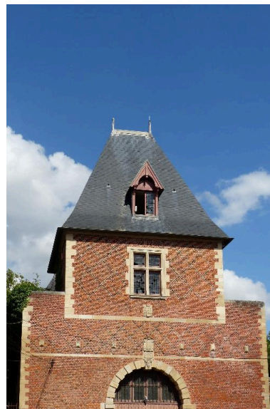
Partie supérieure de la porte.