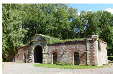
Deuxième porte.