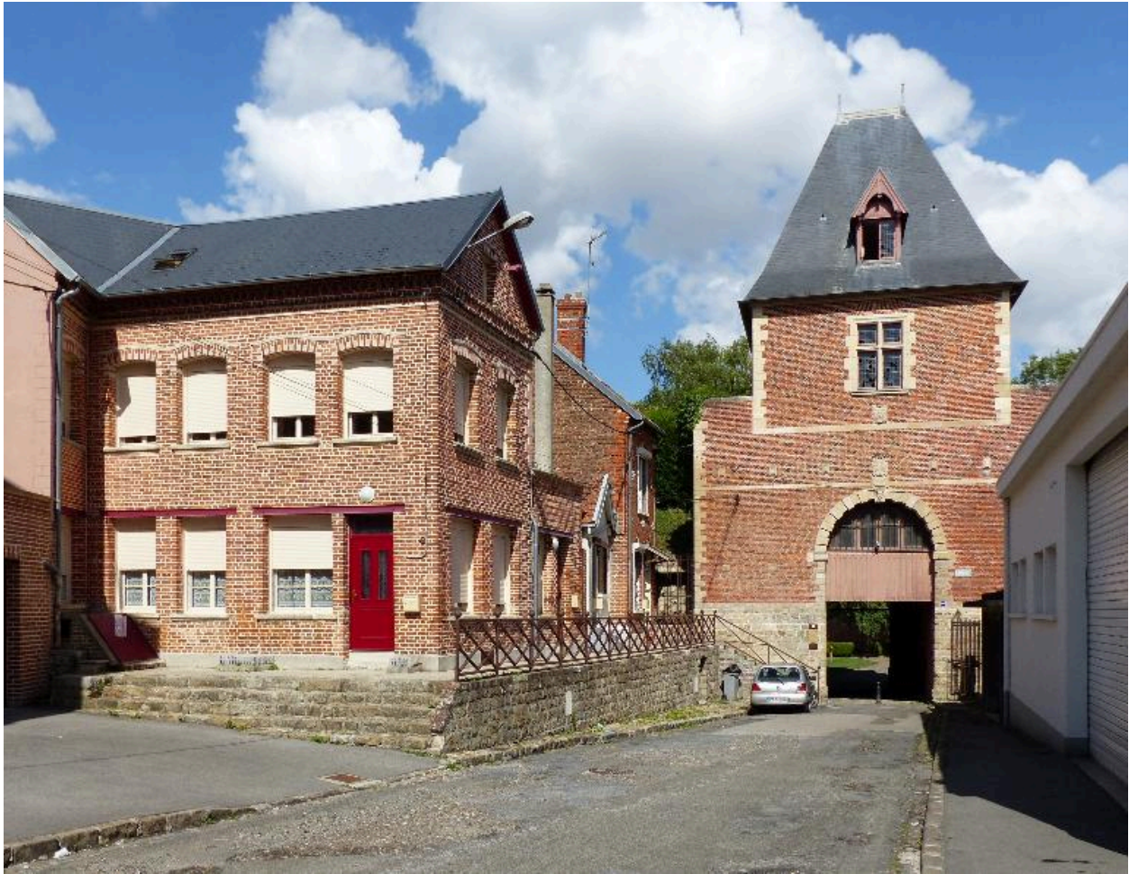
Vue de situation, depuis la rue Saint-Fursy.