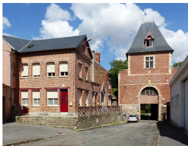
Vue de situation, depuis la rue Saint-Fursy. IVR32_20178005243NUCA

IVR32_20178005464NUCA