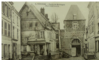
Péronne. Porte de Bretagne. Vue intérieure, carte postale, début 20e siècle (AD Somme ; 10R).

Phot. Isabelle Barbedor IVR32_20178005464NUCA