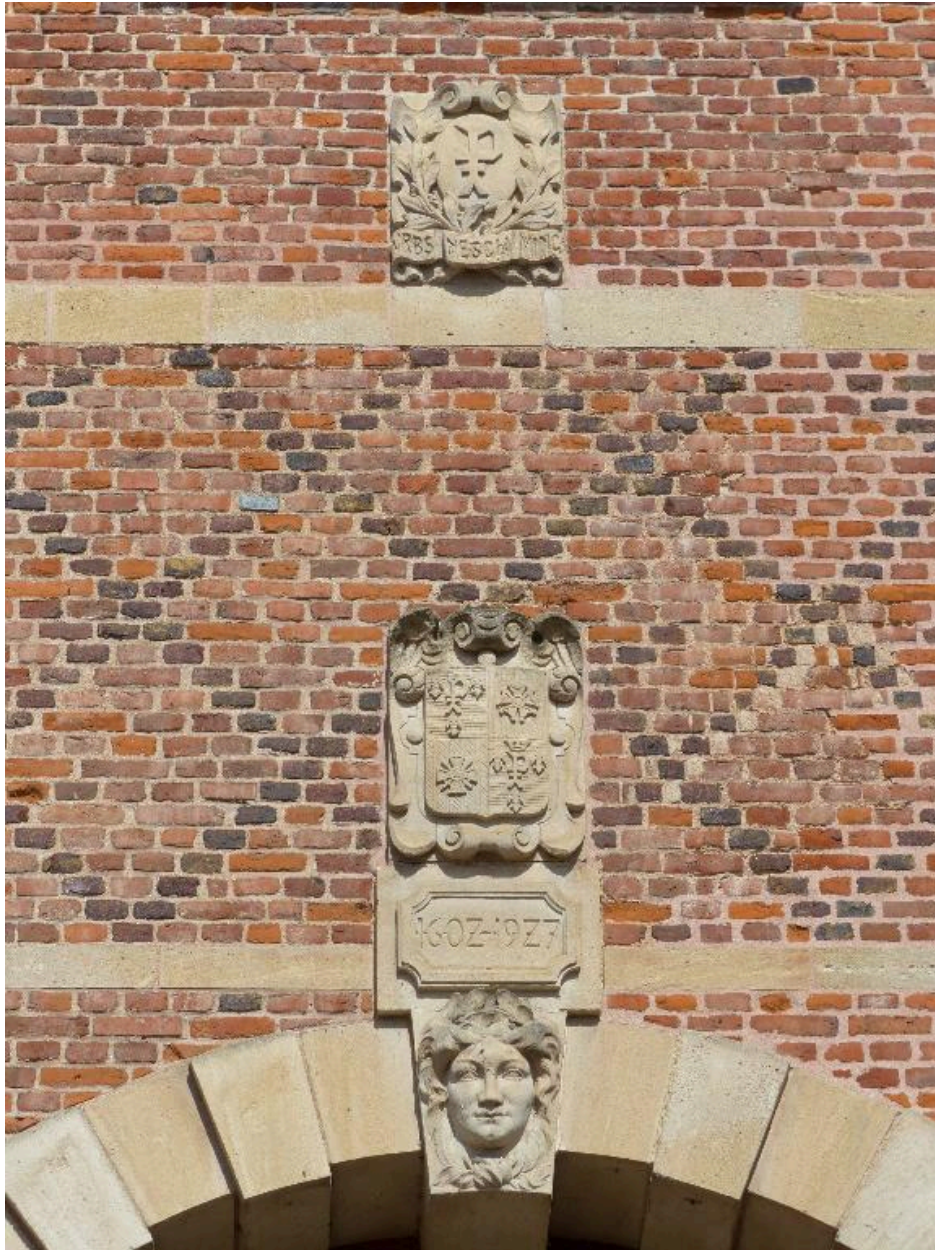
Vue de détail sur la clef et les blasons de la ville de Péronne.