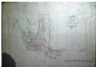
Cadastre de 1825 (Service du cadastre, Abbeville).

IVR22_20038000580NUCAB