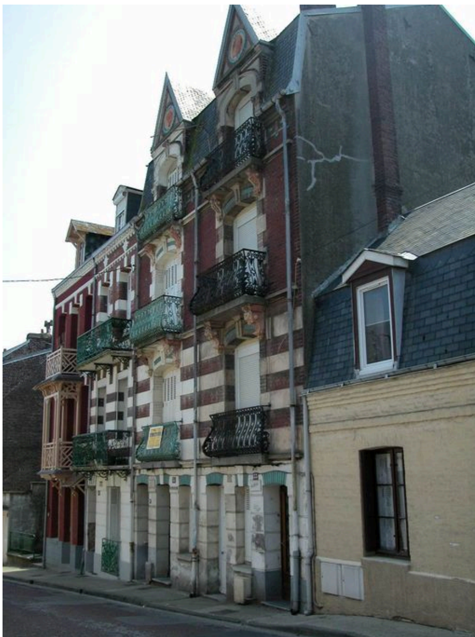
Ensemble de maisons à plusieurs entrées au rez-de-chaussée (27 à 33 rue Pasteur), dont Villa Pierre Lefort au n°29.