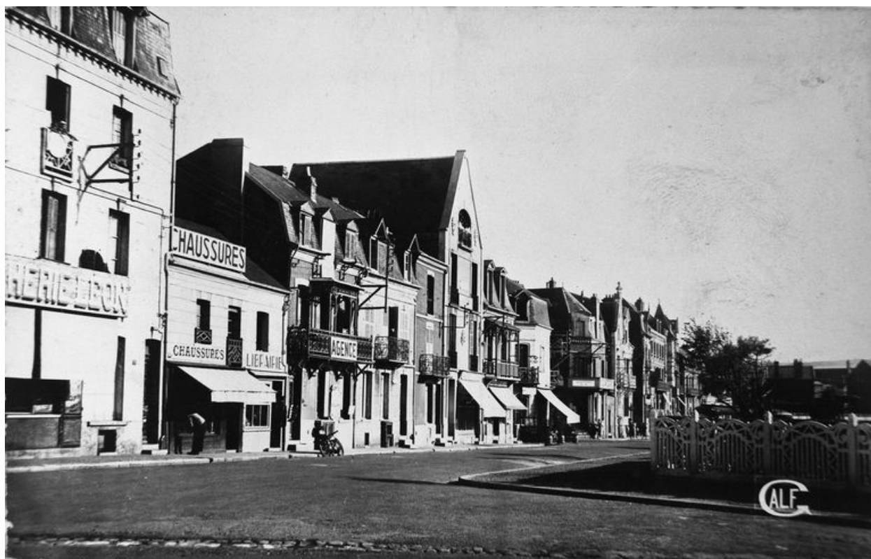
La rue Georges-Clémenceau et ses commerces, carte postale, milieu 20e siècle (coll. part.).