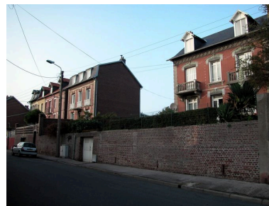
Les maisons de la rue Lucien-Leducq. IVR22_20058003476NUCA