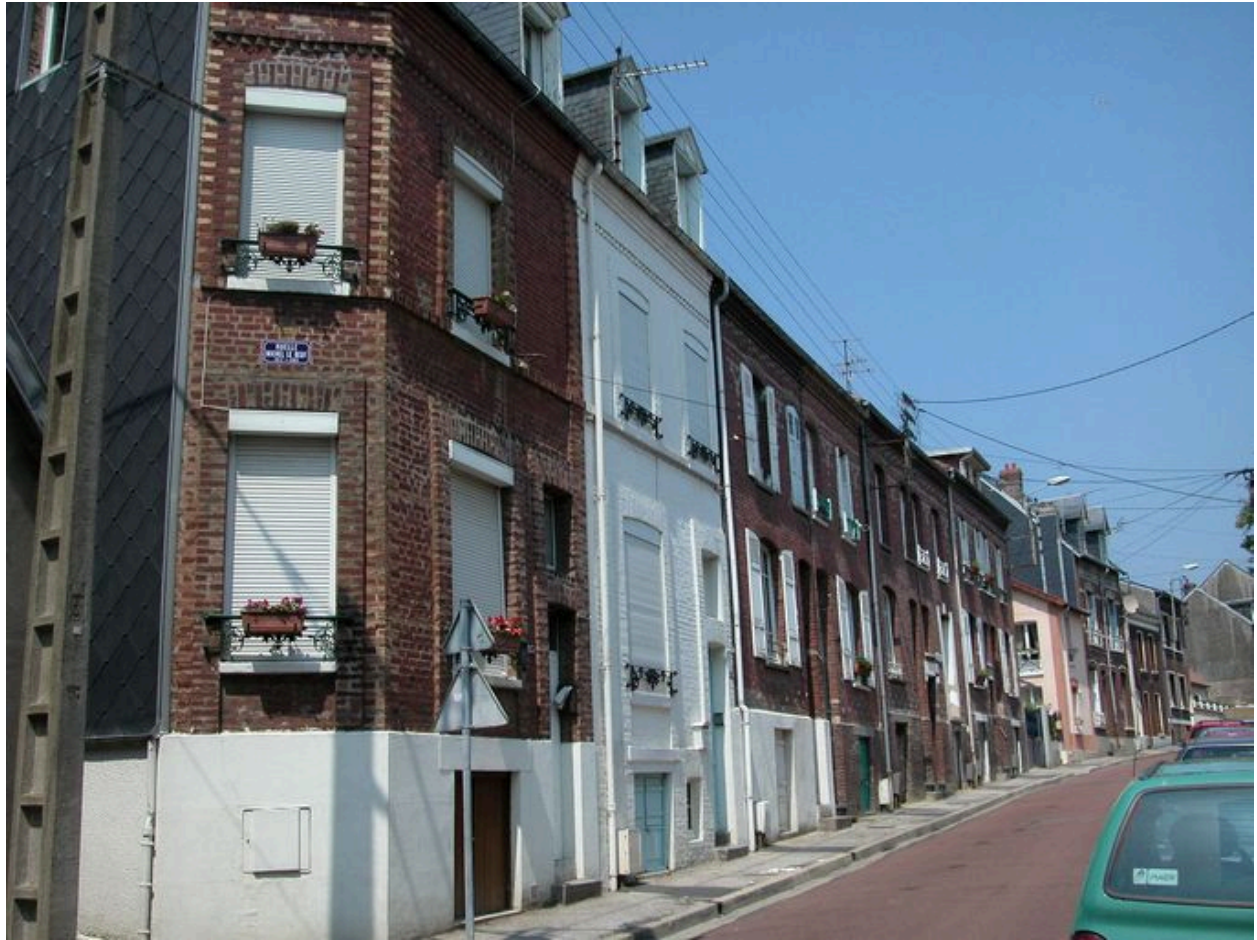
La rue André-Dumont au niveau de la ruelle Michel-Leboeuf.