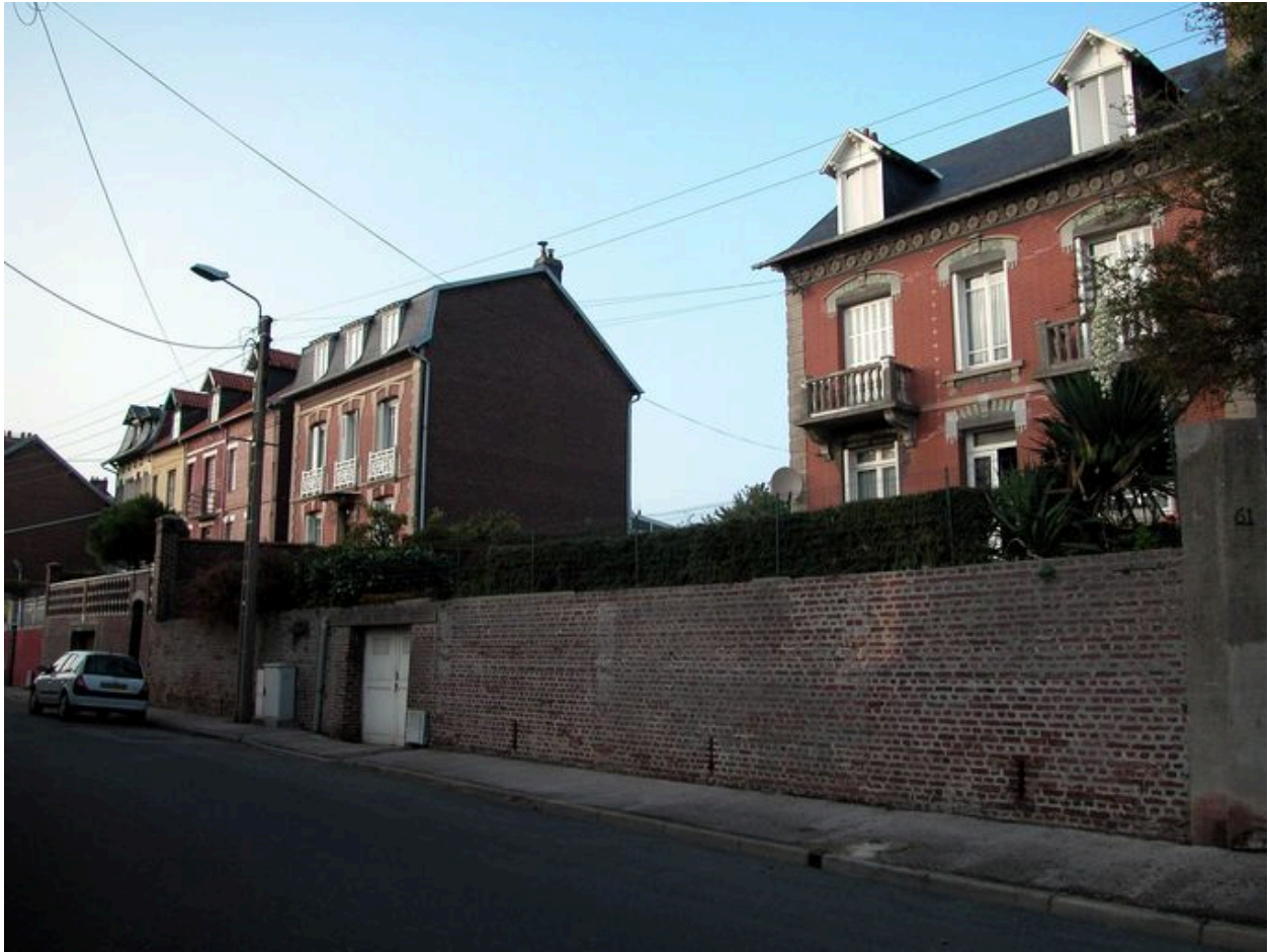
Les maisons de la rue Lucien-Leducq.