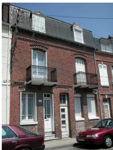
Maison à deux logements accolés et porte médiane d'accès à la cour (14 et 16 rue Pasteur).