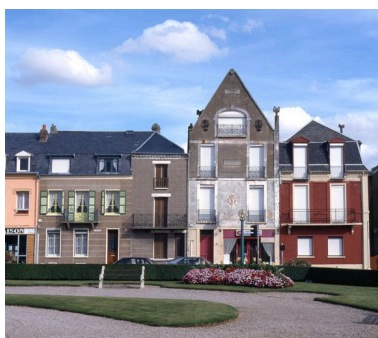
Maisons, rue Clémenceau.

IVR22_20058003508NUCA