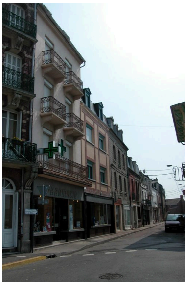
La rue André-Dumont.