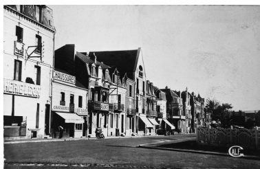
La rue Georges-Clémenceau et ses commerces, carte postale, milieu 20e siècle (coll. part.).

Phot. Monnehay-Vulliet Marie-Laure IVR22_20038000580NUCAB