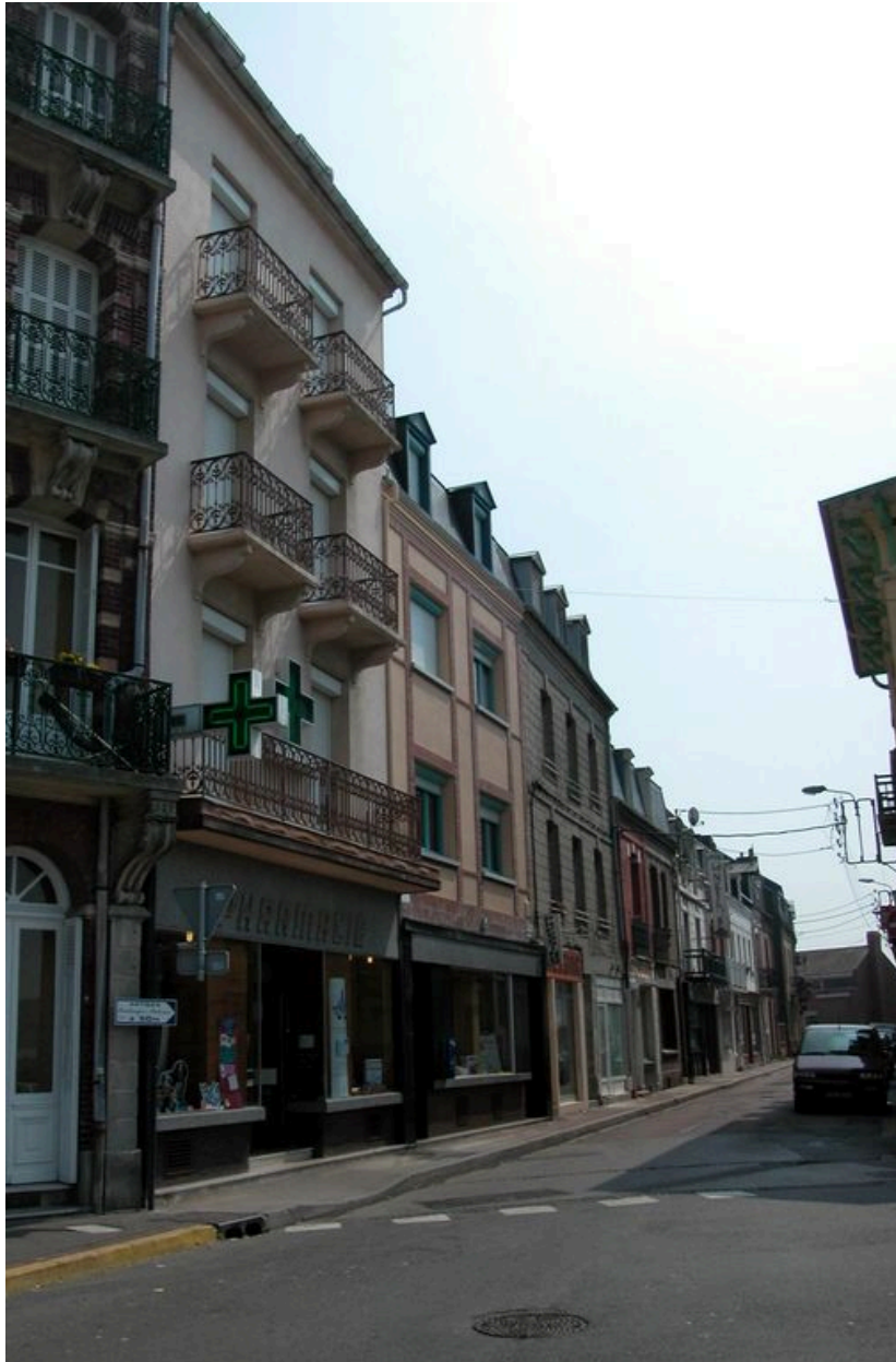
La rue André-Dumont.