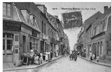
La rue d'Ault, actuelle rue André-Dumont, carte postale, 1er quart 20e siècle (coll. part.).

Phot. Monnehay-Vulliet Marie-Laure IVR22_20048000503XB