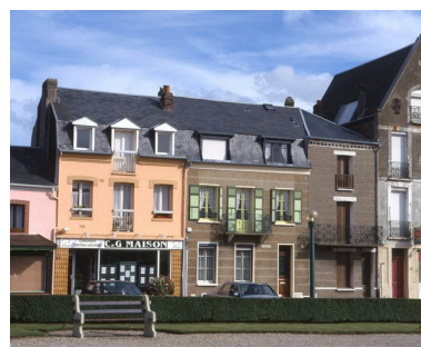
Maisons rue Clémenceau.

IVR22_20008000723XA