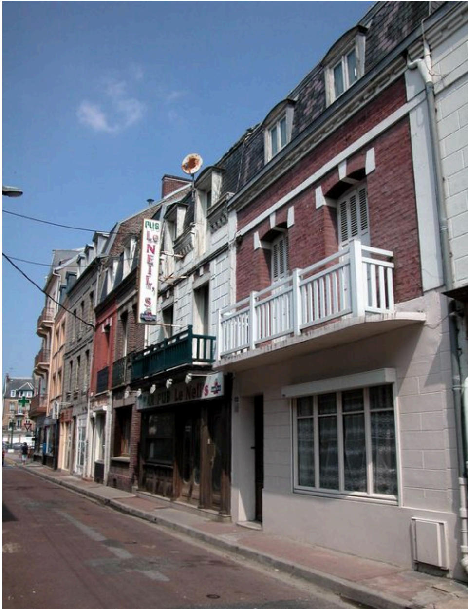
Maisons et commerces de la rue André-Dumont.