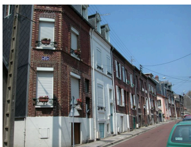
La rue André-Dumont au niveau de la ruelle Michel-Leboeuf.