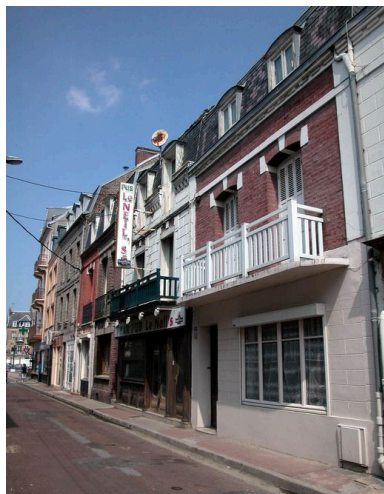
Maisons et commerces de la rue André-Dumont.