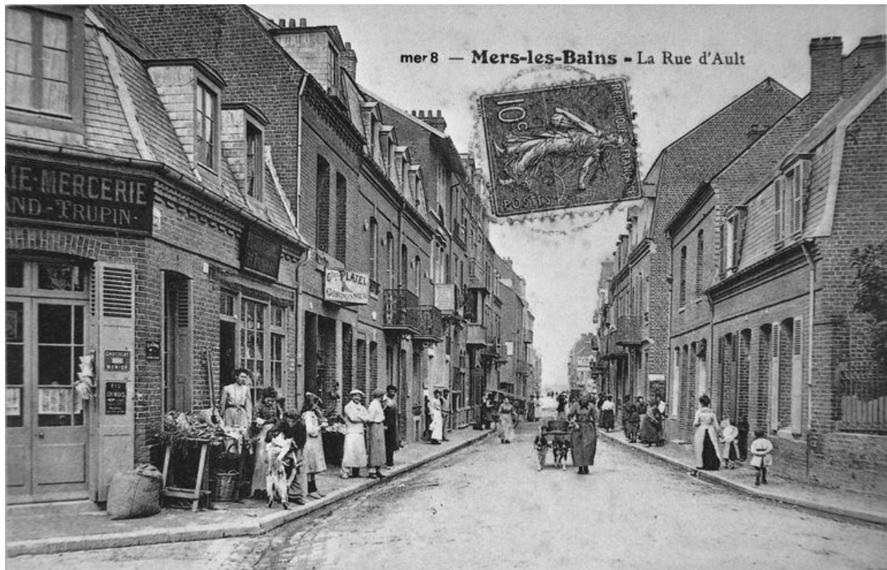
La rue d'Ault, actuelle rue André-Dumont, carte postale, 1er quart 20e siècle.