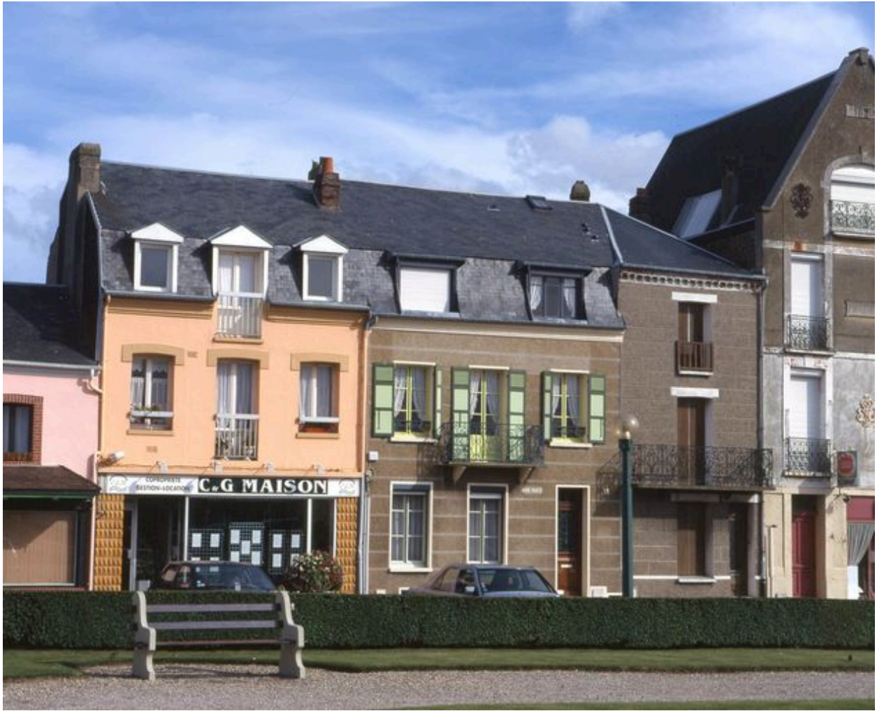
Maisons rue Clémenceau.