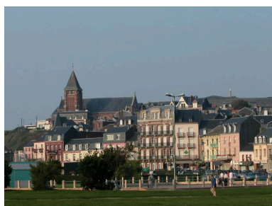
Le bourg, l'église paroissiale et Notre-Dame des Flots (à droite), vue depuis La Prairie.

Phot. Monnehay-Vulliet Marie-Laure IVR22_20048000501XB