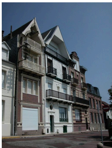
Ensemble de trois maisons près de l'église (12, 14 et 16 rue Joseph Legad). IVR22_20058003167NUCA