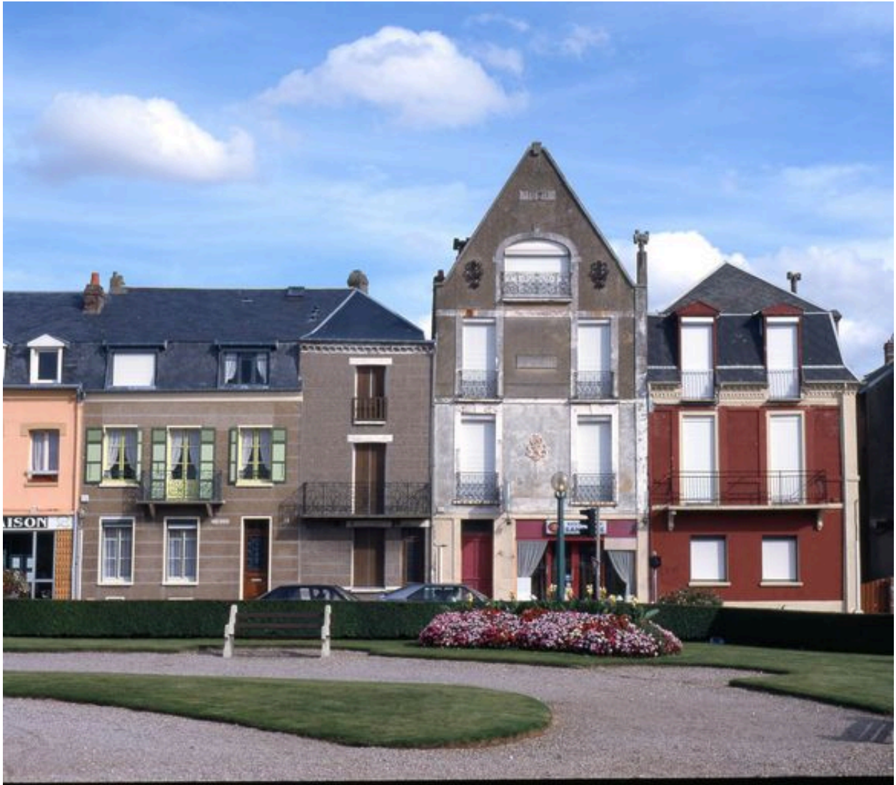
Maisons, rue Clémenceau.