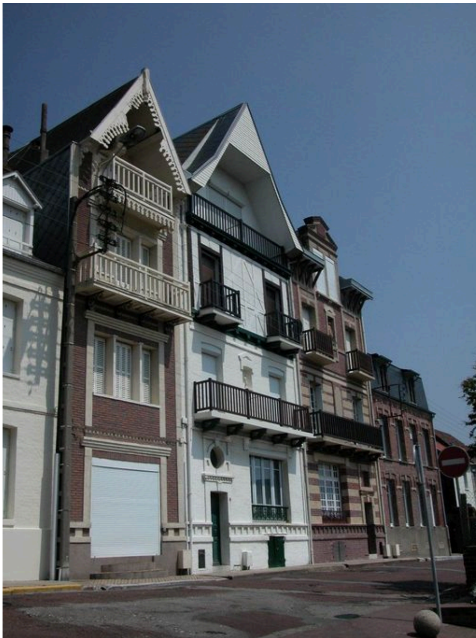
Ensemble de trois maisons près de l'église (12, 14 et 16 rue Joseph Legad).