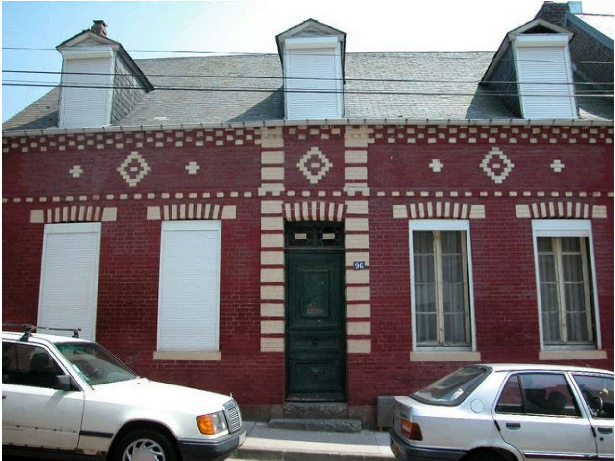
Maison portant la date 1868, 96 rue André-Dumont.