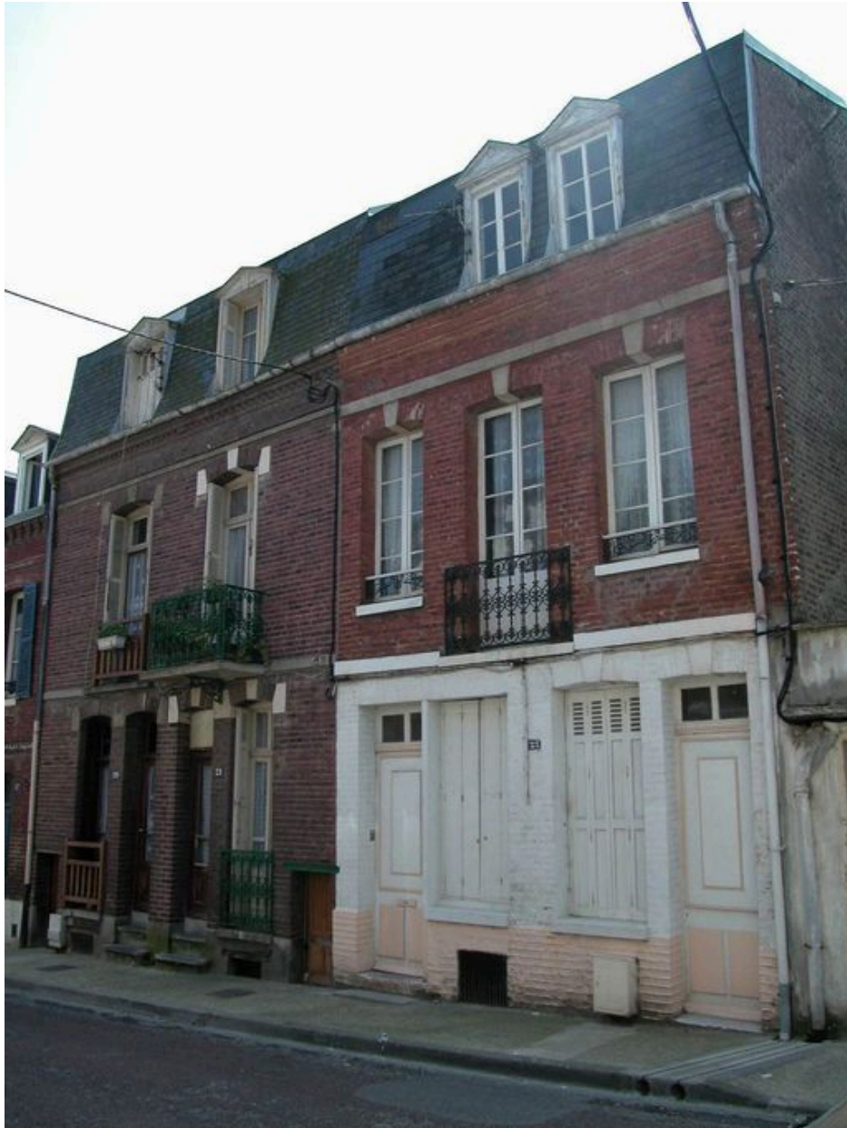
Ensemble de logements accolés (19, 21, 23 rue Pasteur).