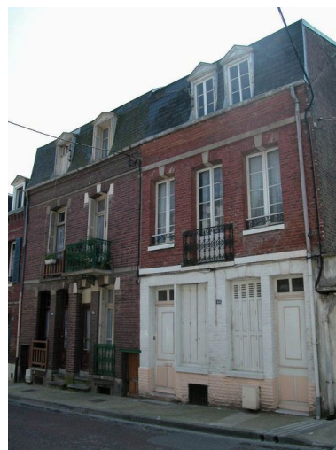
Ensemble de logements accolés (19, 21, 23 rue Pasteur). IVR22_20058003165NUCA