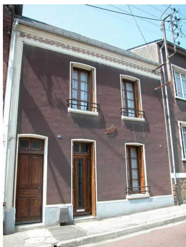
Maison dite Rien sans Mal, 105 rue André-Dumont, avec une porte excentrée ouvrant sur un couloir latéral desservant la cour. IVR22_20058003161NUCA