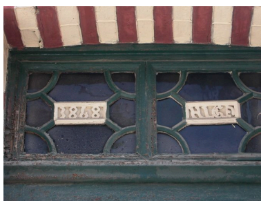
Détail de l'imposte de la maison sise au 96 rue André- Dumont, portant la date 1868.