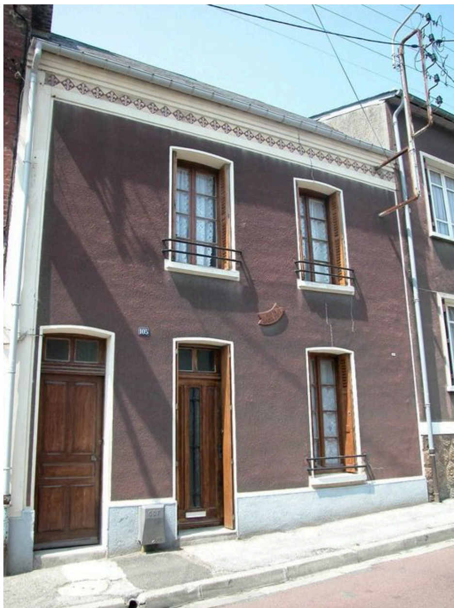
Maison dite Rien sans Mal, 105 rue André-Dumont, avec une porte excentrée ouvrant sur un couloir latéral desservant la cour.