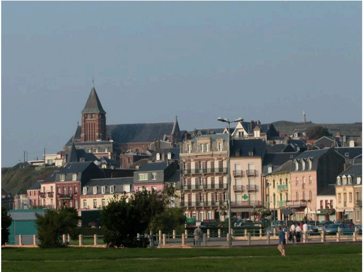
Le bourg, l'église paroissiale et Notre-Dame des Flots (à droite), vue depuis La Prairie.