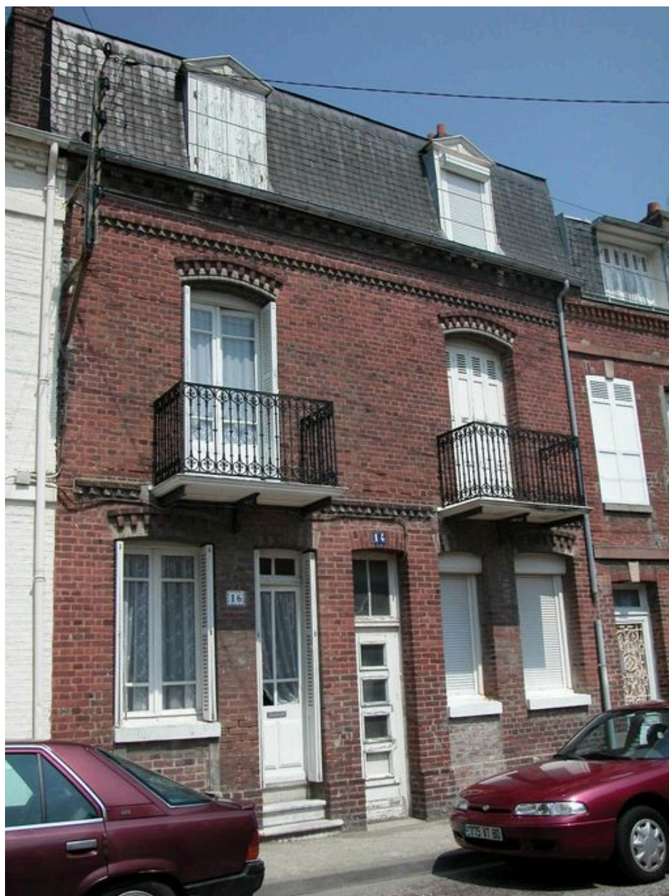
Maison à deux logements accolés et porte médiane d'accès à la cour (14 et 16 rue Pasteur).