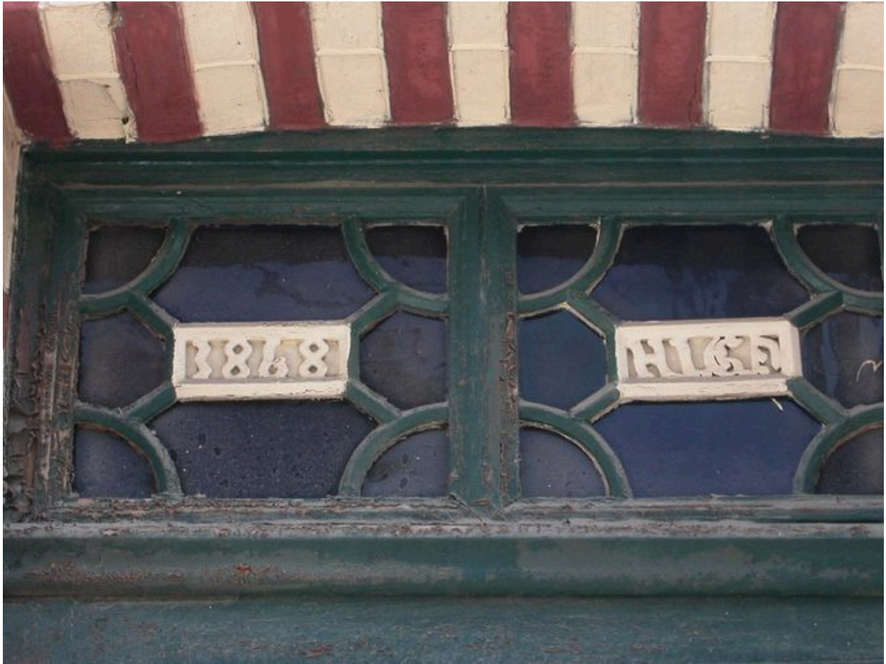
Détail de l'imposte de la maison sise au 96 rue André-Dumont, portant la date 1868.