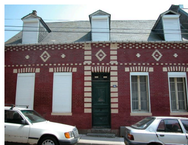
Maison portant la date 1868, 96 rue André-Dumont.