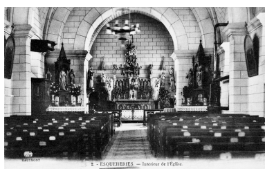
Vue intérieure vers le chœur, début 20e siècle