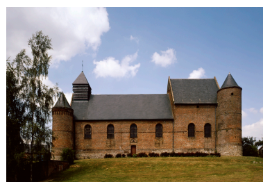
Vue de l'élévation sud.