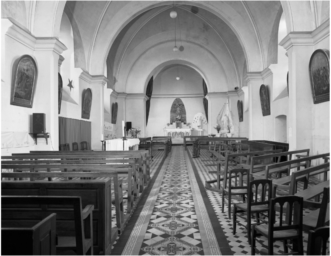
Vue intérieure, vers le choeur.