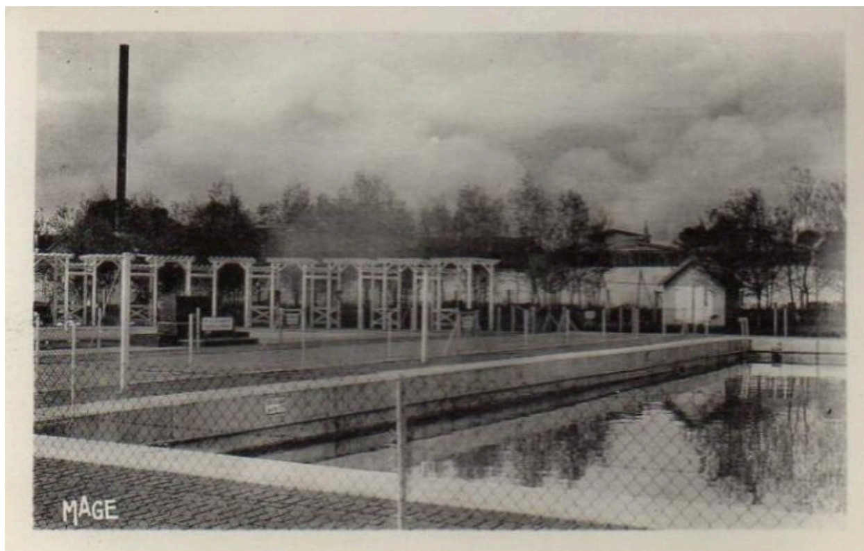
La piscine de la cité des cheminots de Longueau (Somme), carte postale, vers 1930.