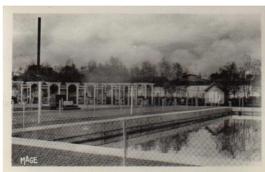
La piscine de la cité des cheminots de Longueau (Somme), carte postale, vers 1930 (coll. part.). IVR32_20178005381NUCA