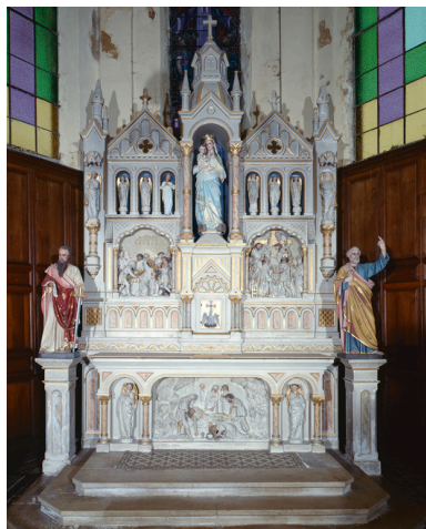
Vue d'ensemble du maître-autel, du tabernacle et du retable.

IVR22_19910201390VA