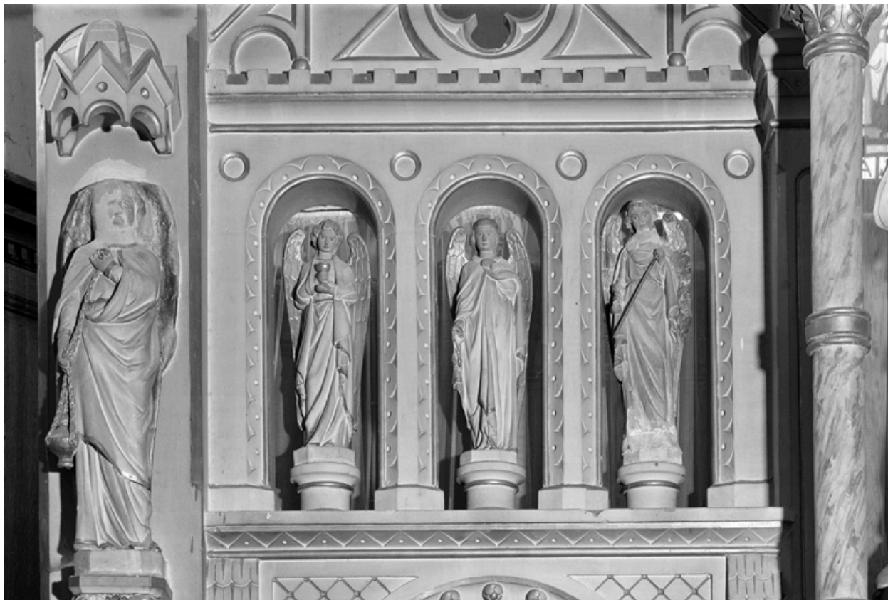
Détail des statuette d'anges du retable du maître autel.