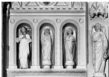
Détail des statuette d'anges du retable du maître-autel. IVR22_19910201053X

IVR22_19910201390VA