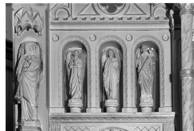
Détail des statuette d'anges du retable du maître autel. IVR22_19910201055X