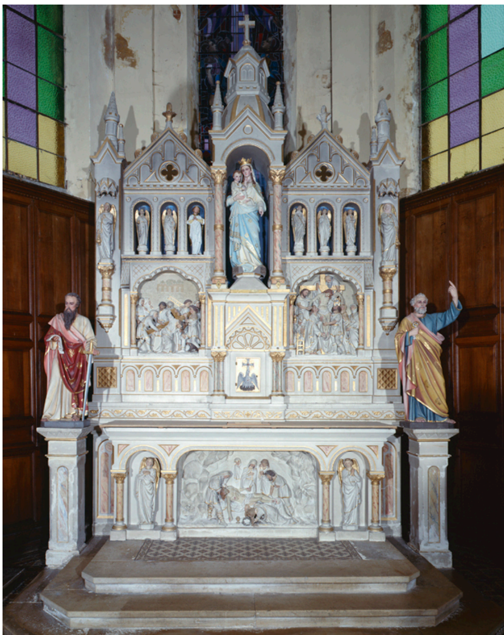
Vue d'ensemble du maître-autel, du tabernacle et du retable.