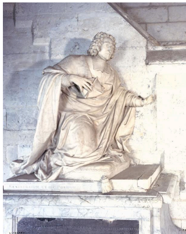
Vue d'ensemble. IVR22_19966003951VA