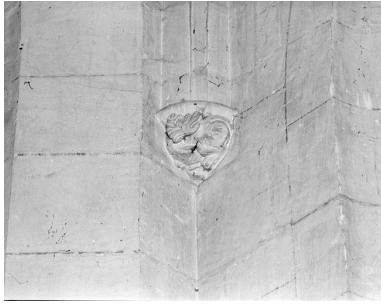
Culot, première travée, angle droit. IVR22_19940200958X