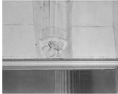
Culot, première travée, angle gauche, 16e siècle. IVR22_19940200959X