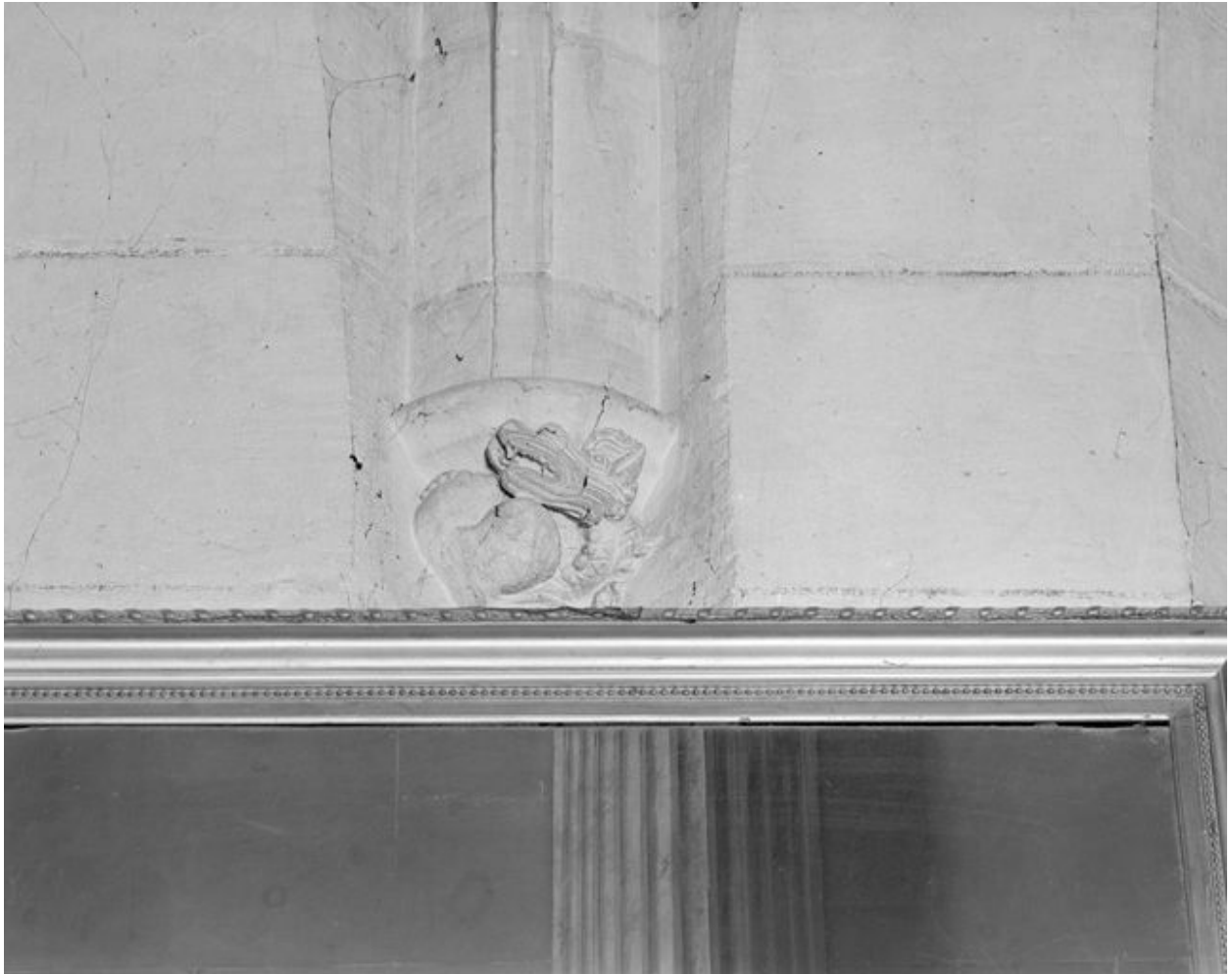
Culot, première travée, angle gauche, 16e siècle.