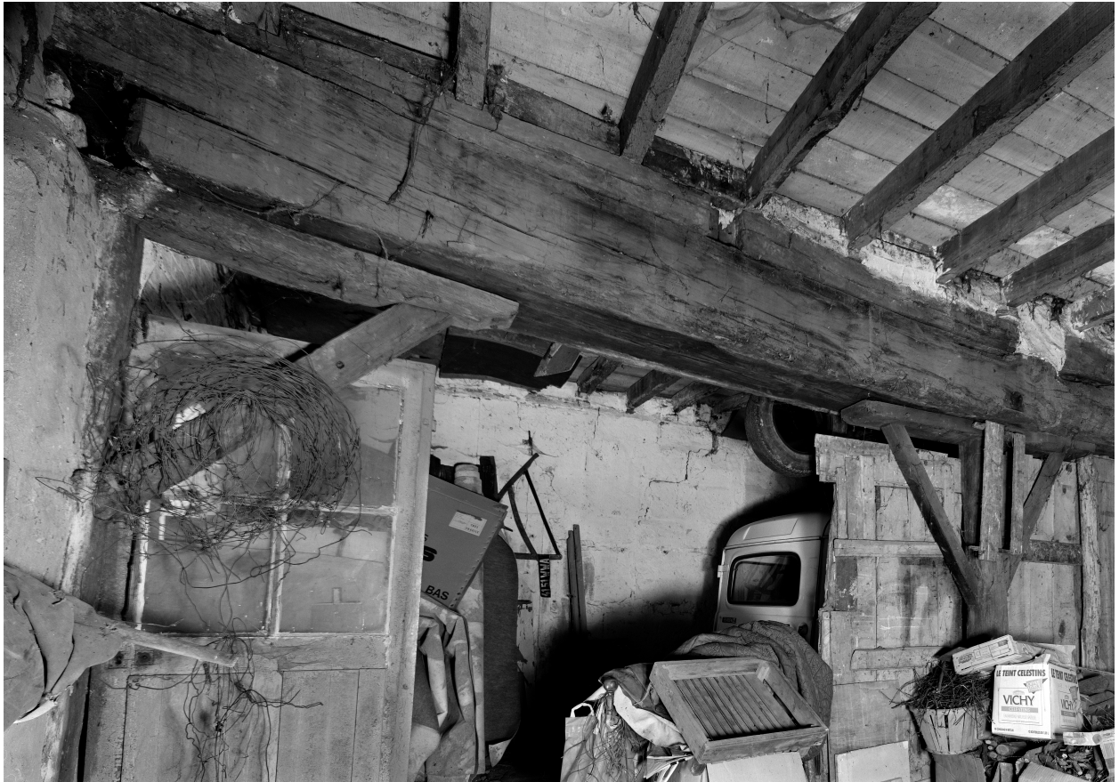
Poutre maîtresse du rez-de-chaussée.