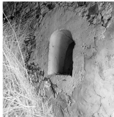
Baie condamnée dans le mur nord du rez-de-chaussée.