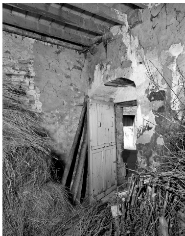
Porte sur la ruelle du Moulin à Tan. IVR22_19950203310V