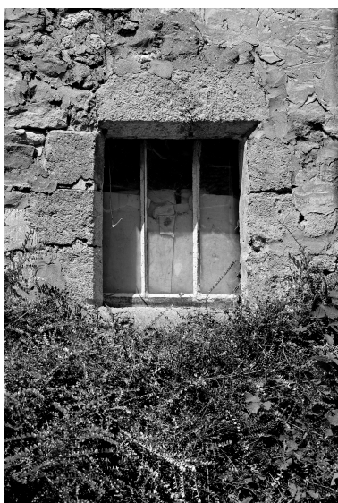
Fenêtre du rez-de-chaussée : vue de la cour intérieure.