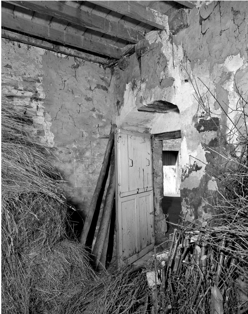
Porte sur la ruelle du Moulin à Tan.