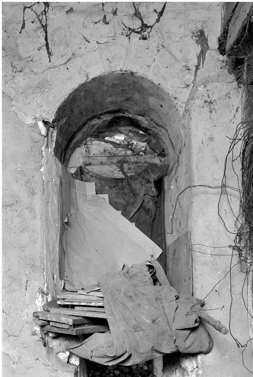
Baie du rez-de-chaussée : vue de l'intérieur.