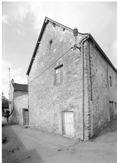
Vue de la façade sur la ruelle du moulin à Tan. IVR22_19950200331P