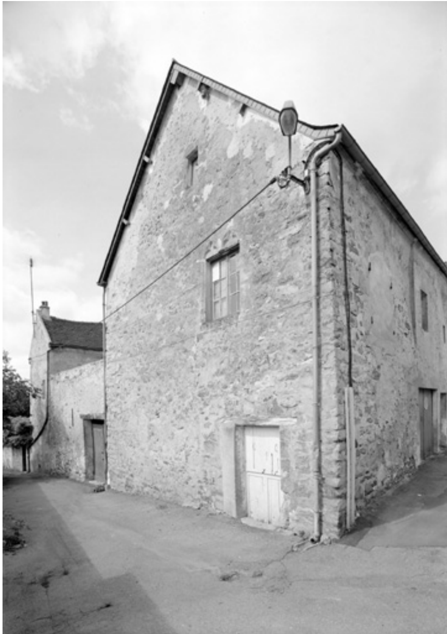
Vue de la façade sur la ruelle du moulin à Tan.