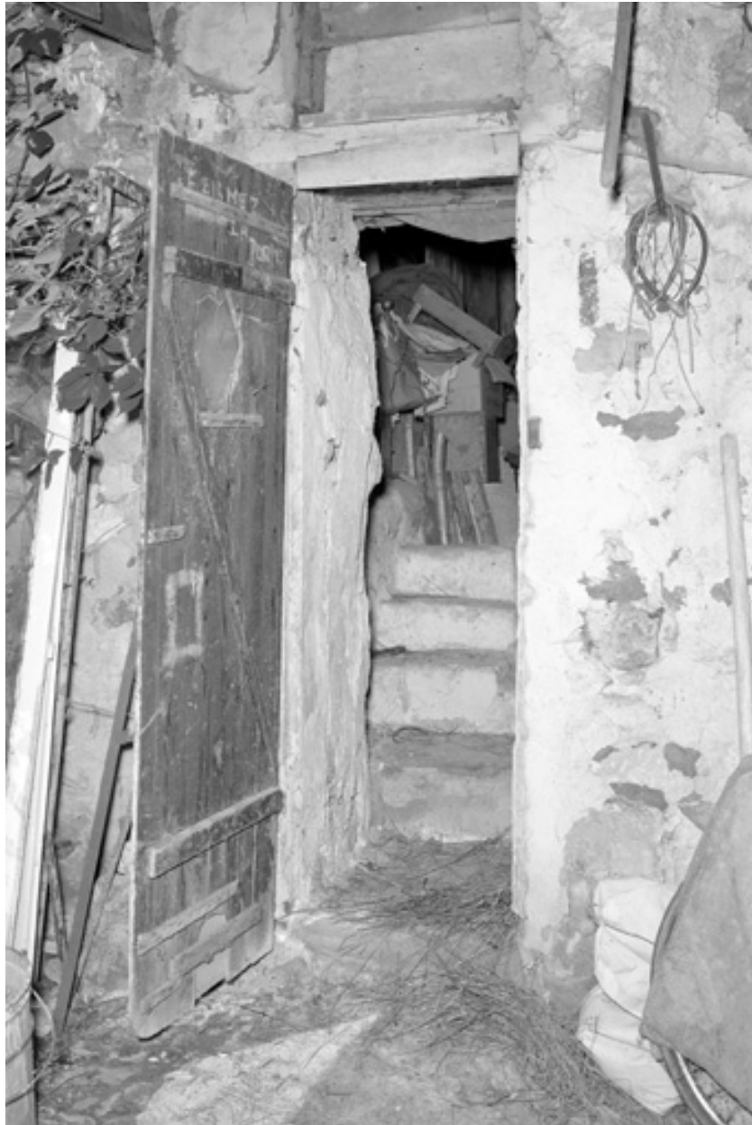
Entrée du bâtiment sur la cour intérieure.