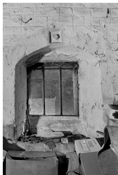
Fenêtre du rez-de-chaussée : vue de l'intérieur.