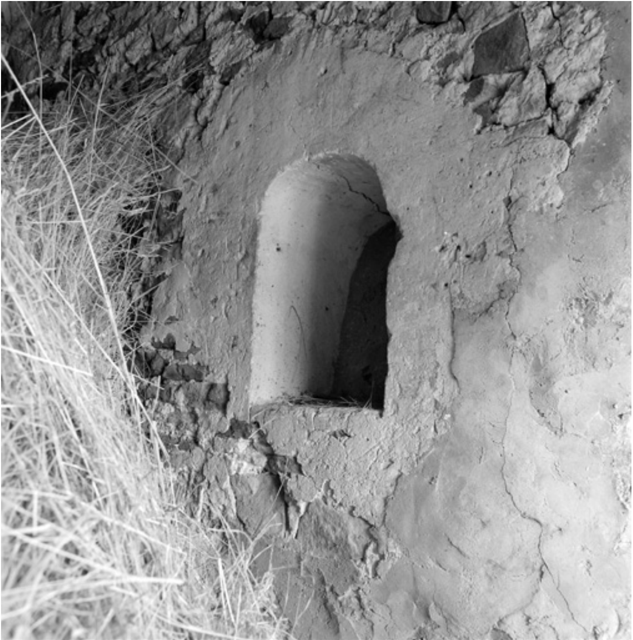
Baie condamnée dans le mur nord du rez-de-chaussée.