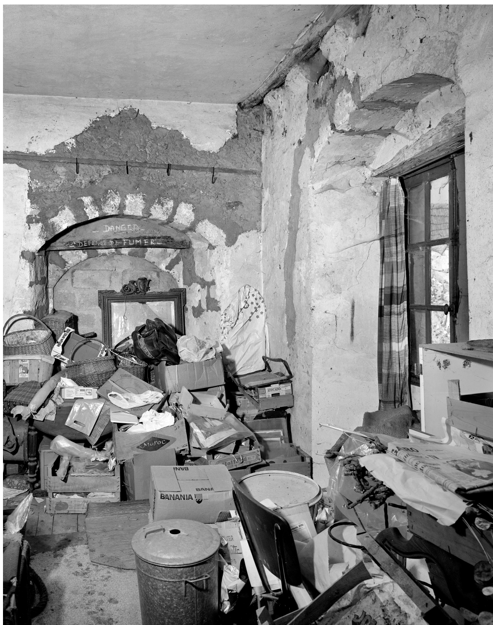
Vue de la pièce du premier étage avec les deux baies cintrées.