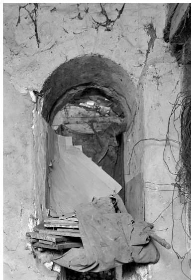
Baie du rez-de-chaussée : vue de l'intérieur. IVR22_19950203309X