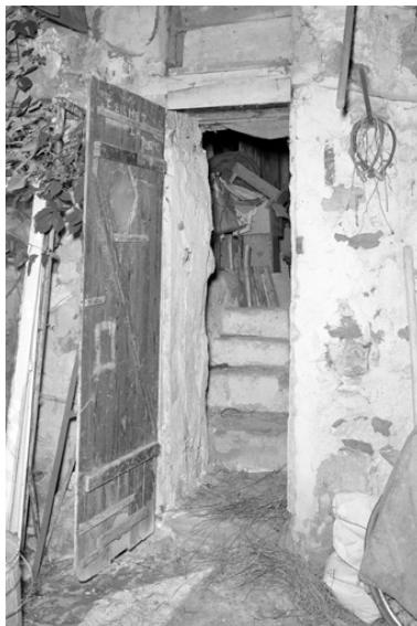
Entrée du bâtiment sur la cour intérieure.