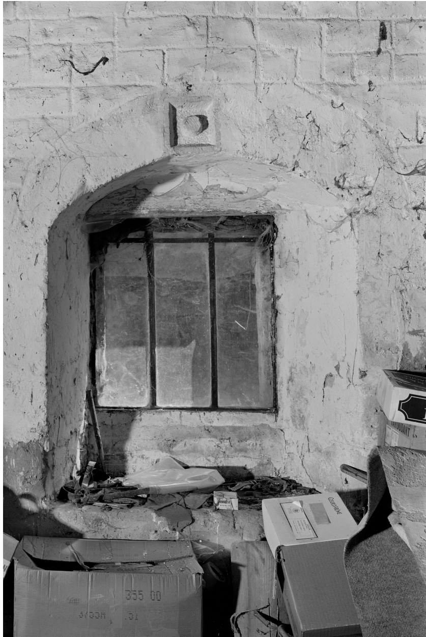
Fenêtre du rez-de-chaussée : vue de l'intérieur.