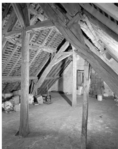
Vue de la charpente. IVR22_19950203236V