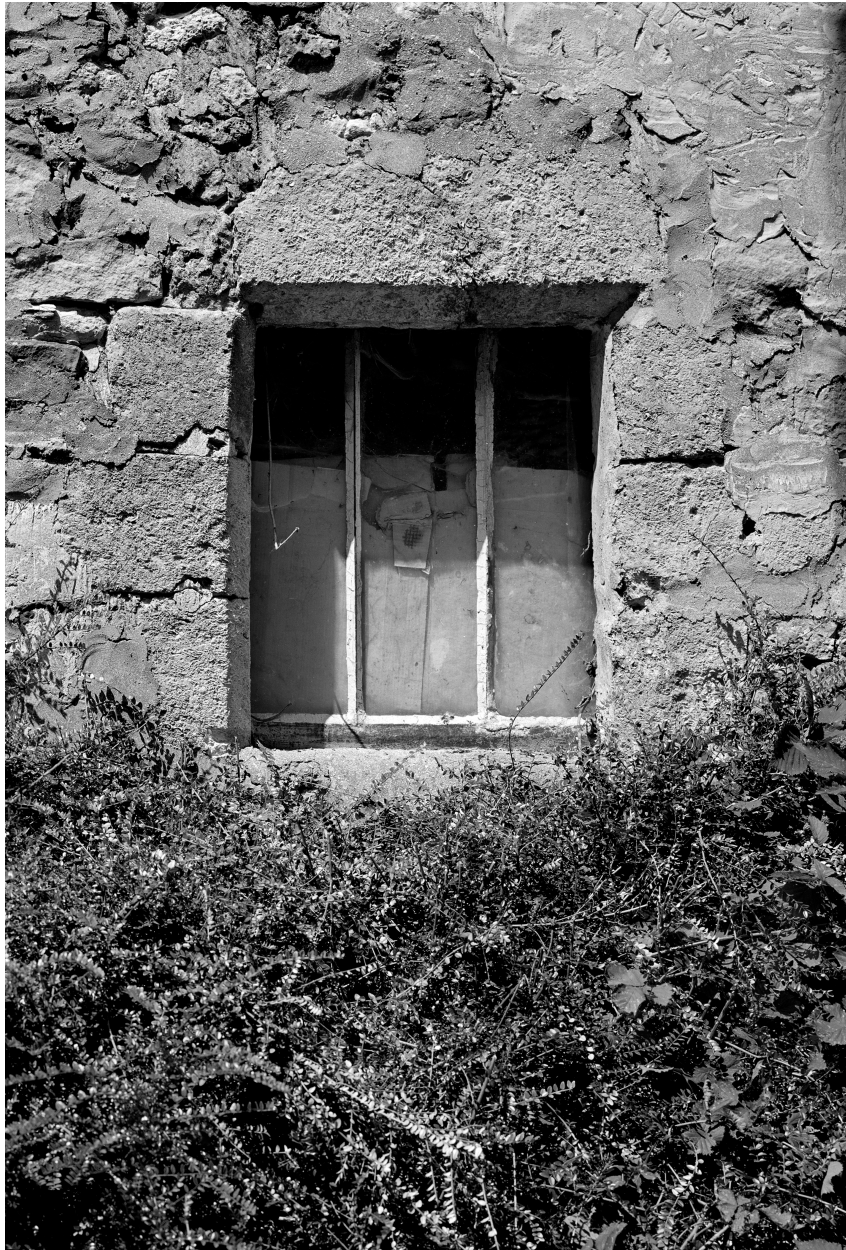
Fenêtre du rez-de-chaussée : vue de la cour intérieure.