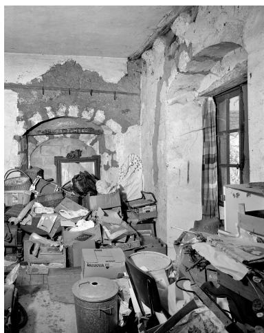
Vue de la pièce du premier étage avec les deux baies cintrées. IVR22_19950203312V