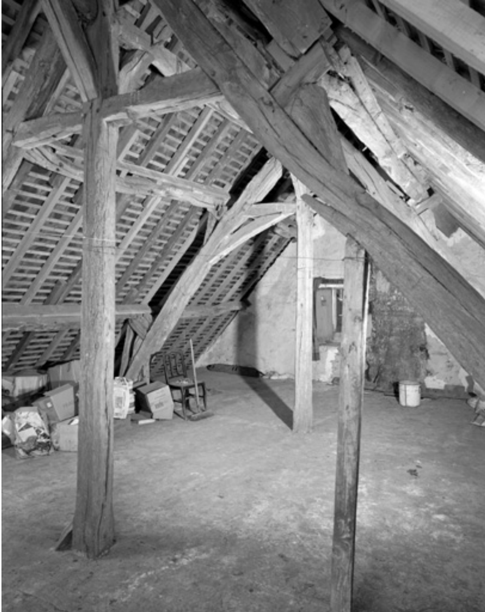
Vue de la charpente.