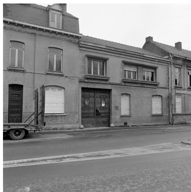
Élévation rue de la Liberté.