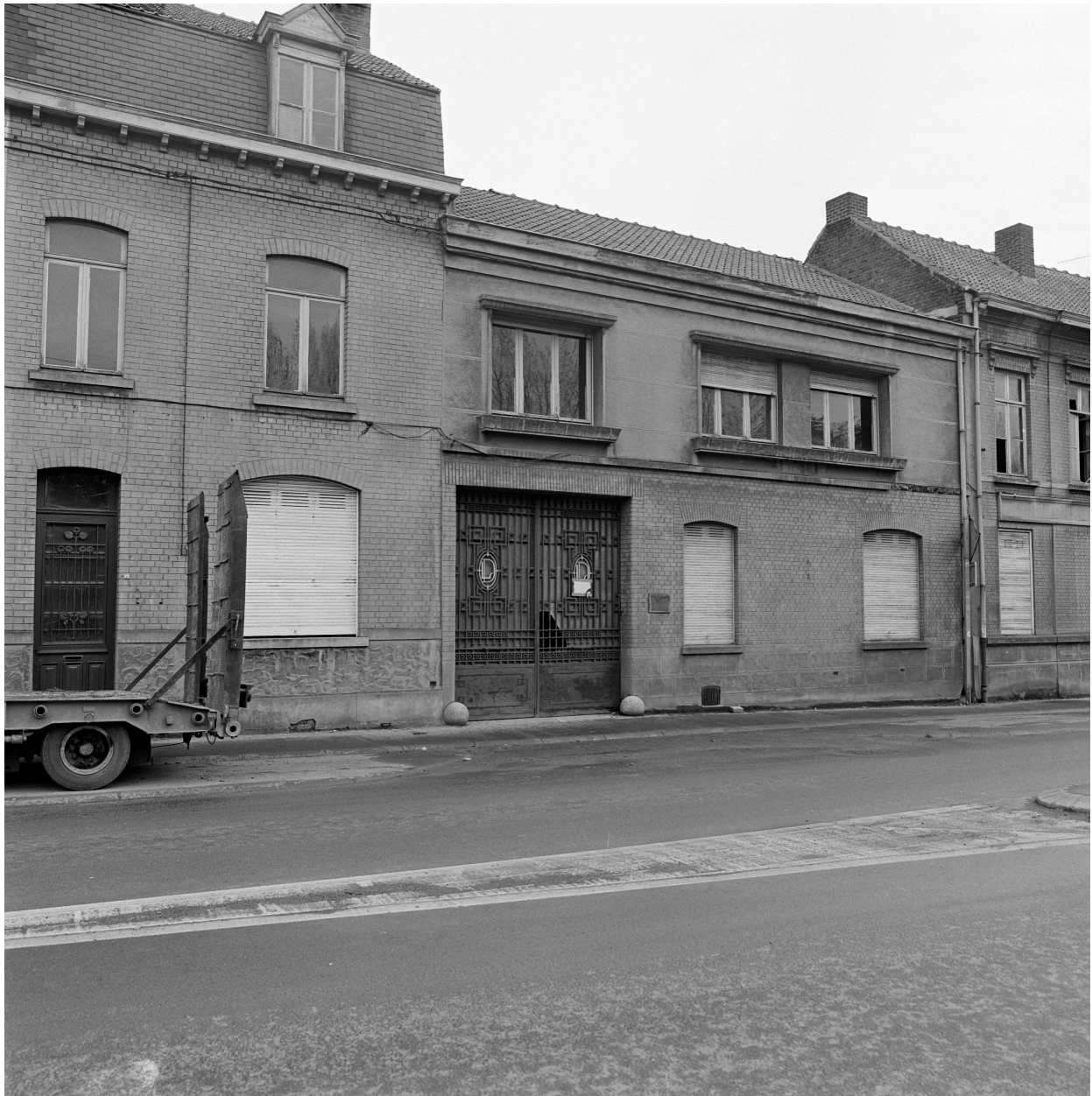
Élévation rue de la Liberté.