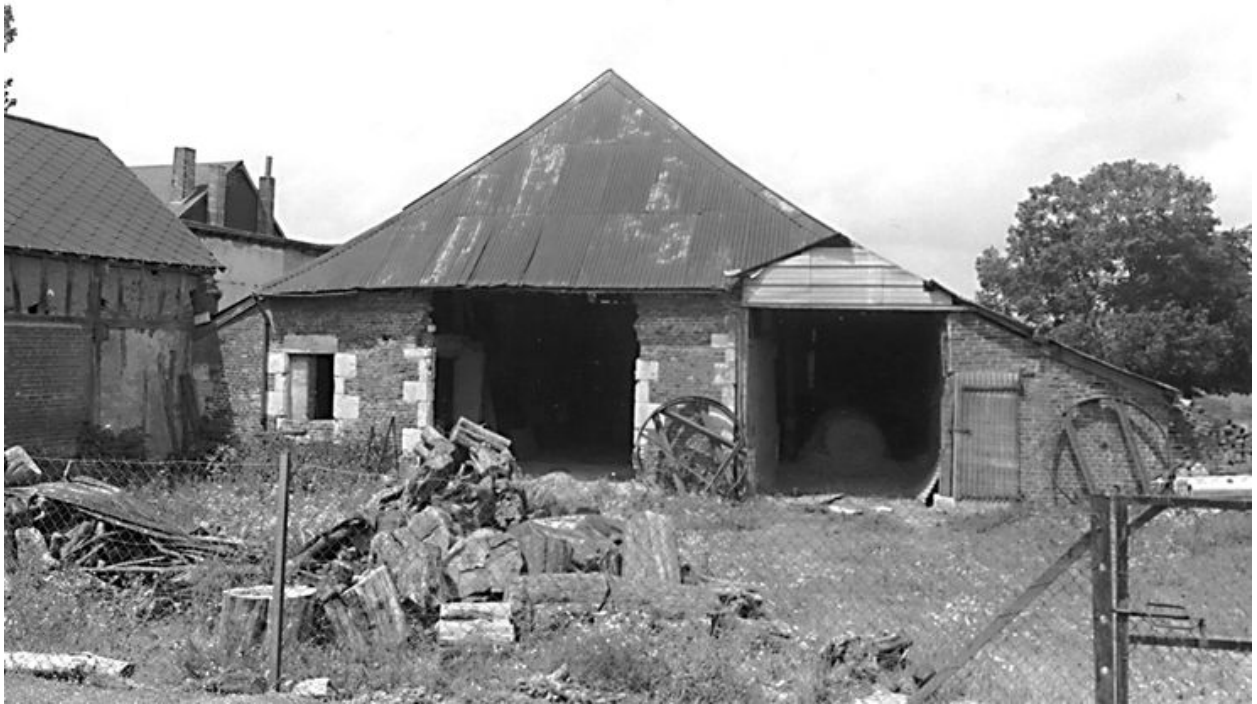
Vue de l'ancienne ferme, logis et grange attenante, transformée aujourd'hui en grange.