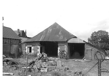
Vue de l'ancienne ferme, logis et grange attenante, transformée aujourd'hui en grange. IVR22_19980201473Z