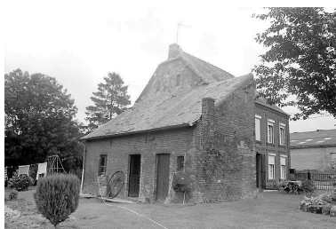
Vue du logis avec, au premier plan, l'atelier de fabrication.