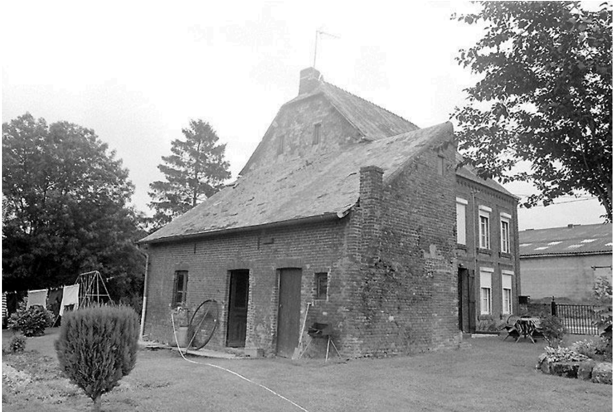
Vue du logis avec, au premier plan, l'atelier de fabrication.