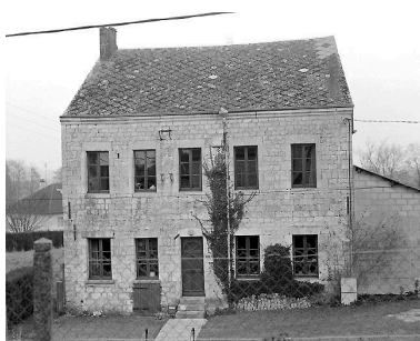
Vue générale. IVR22_19970202192X

IVR22_20080290135NUCA