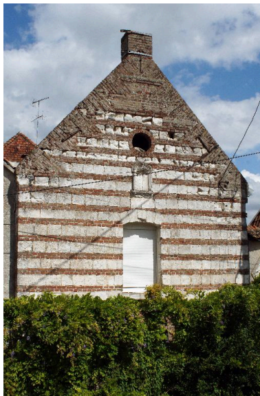
Vue du pignon à assises alternées brique et pierre.

IVR22_20118000432NUCA