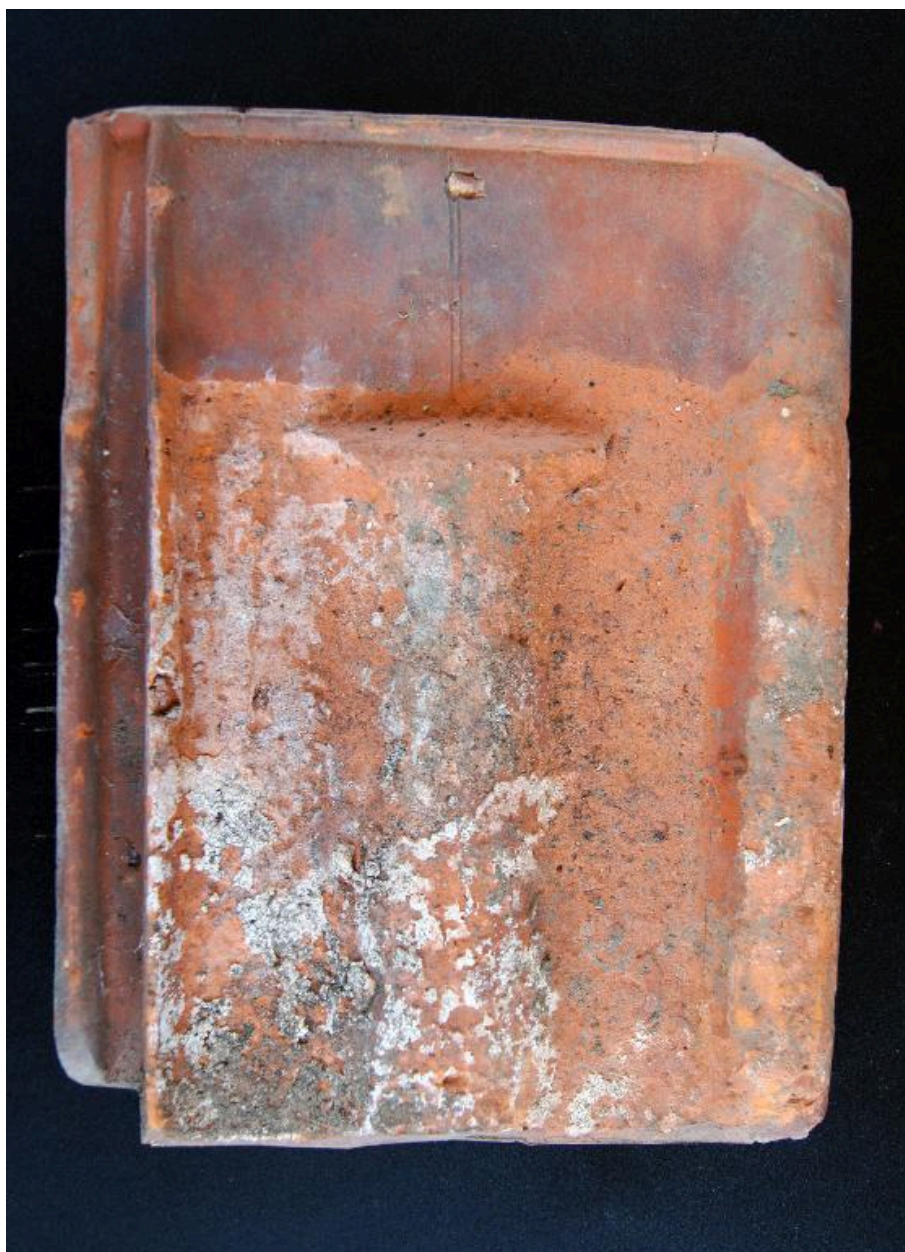
Panne provenant de la fabrique (face externe).