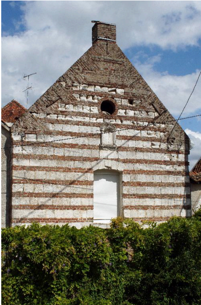
Vue du pignon à assises alternées brique et pierre.