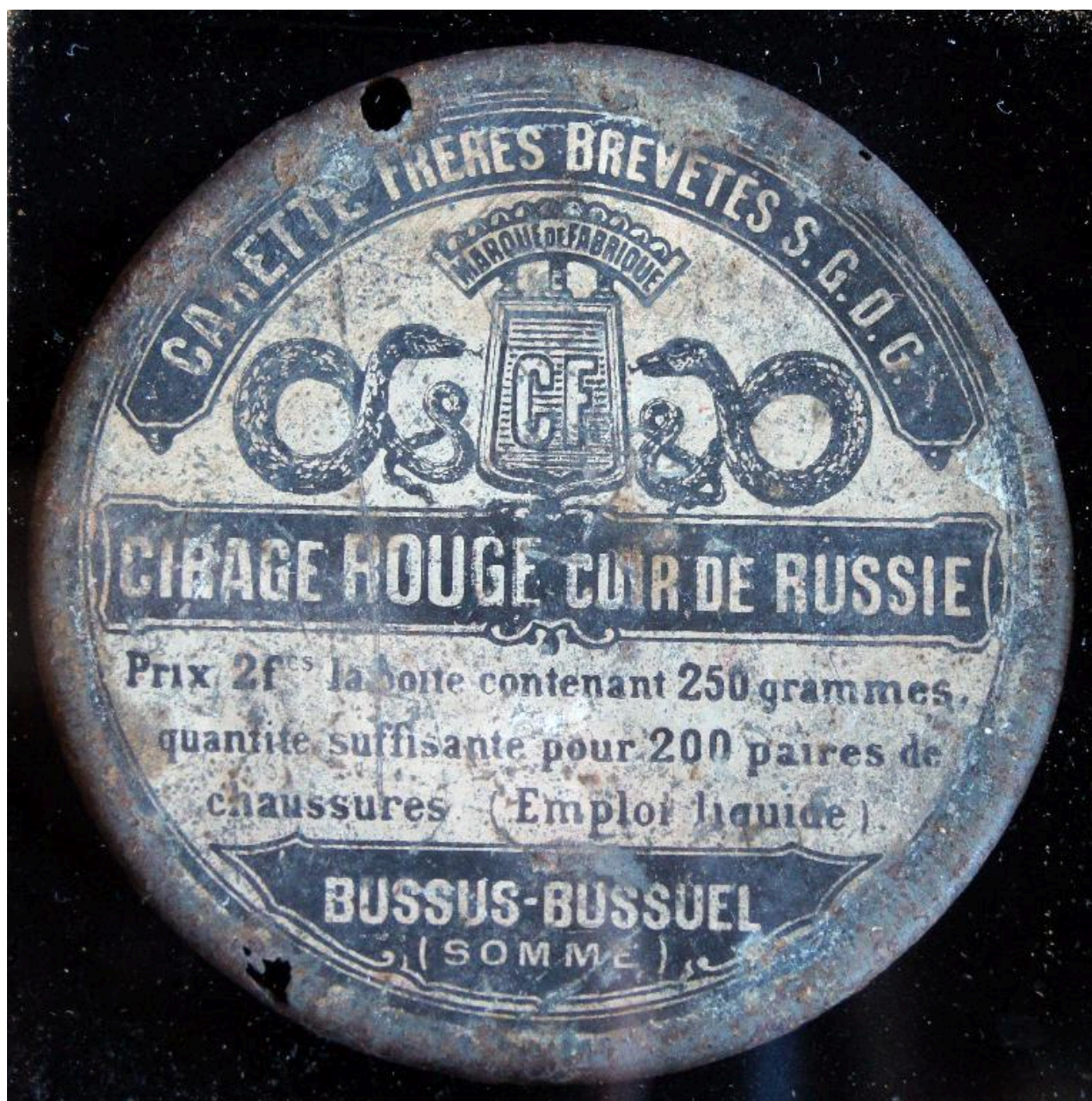
Boîte de cirage provenant de l'ancienne fabrique Carette.