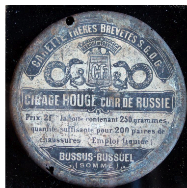
Boîte de cirage provenant de l'ancienne fabrique Carette.

Phot. Marie-Laure Monnehay-Vulliet IVR22_20118000395NUC2A