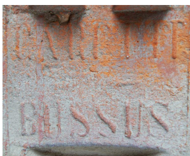
Panne provenant de la fabrique (face interne). Détail de la marque de fabricant.

Phot. Marie-Laure Monnehay-Vulliet IVR22_20118000394NUC2A