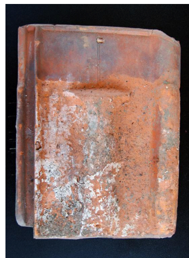
Panne provenant de la fabrique (face externe).

Phot. Marie-Laure Monnehay-Vulliet IVR22_20118000434NUC2A