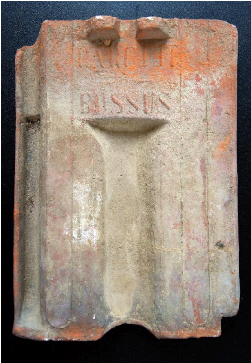
Panne provenant de la fabrique (face interne).