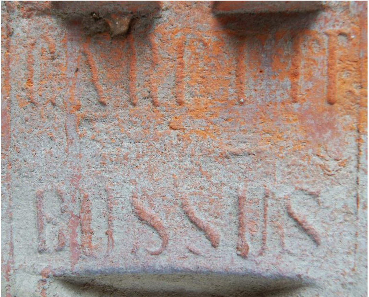
Panne provenant de la fabrique (face interne). Détail de la marque de fabricant.