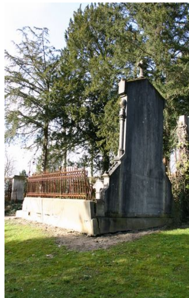
Vue générale de la face postérieure du monument. IVR22_20078000477NUCA