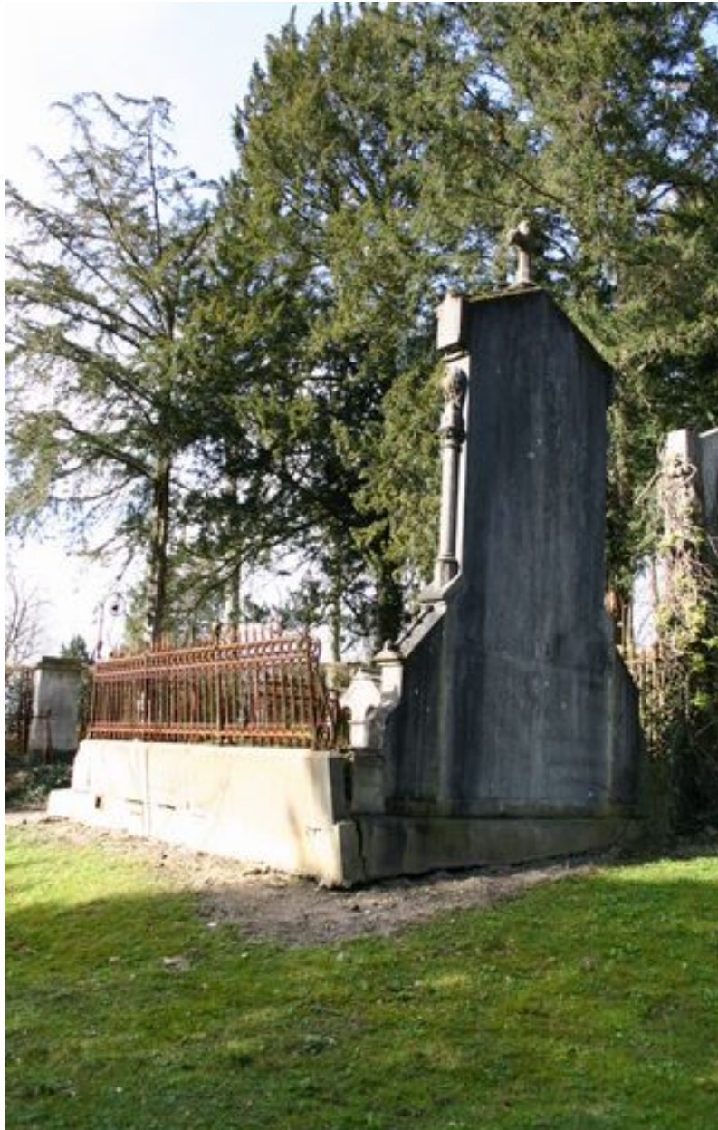
Vue générale de la face postérieure du monument.