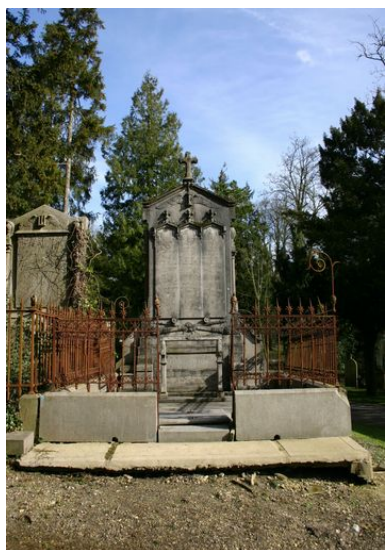
Vue générale de face. IVR22_20078000478NUCA