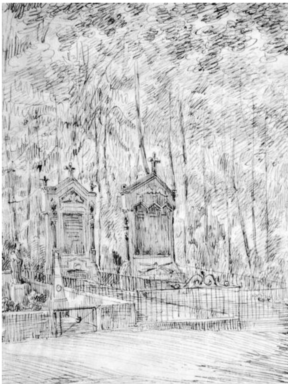
Le tombeau de Chassepot au cimetière de la Madeleine, dessin des frères Duthoit, 3e quart 19e siècle (Amiens, Musée de Picardie, MP Duthoit VI-89).