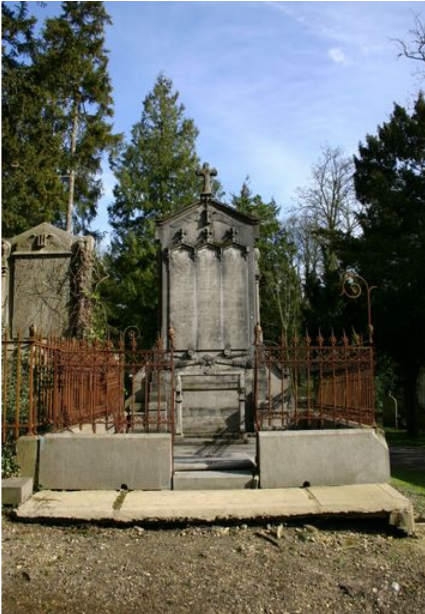
Vue générale de face.