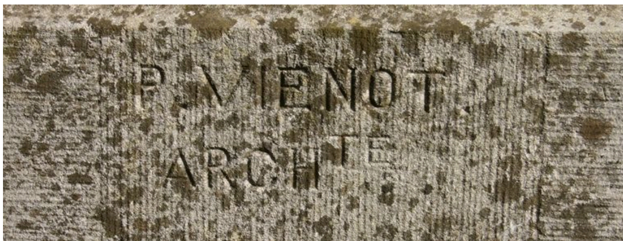
Signature de l'architecte P. Vienot.