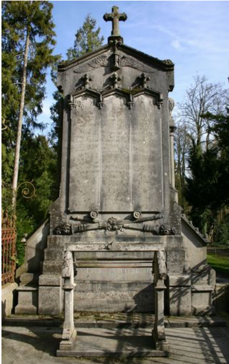
Stèle architecturée et porte-couronne mortuaire.