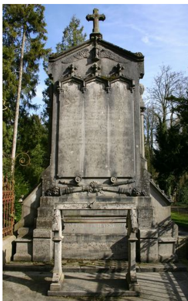
Stèle architecturée et porte-couronne mortuaire. IVR22_20078000479NUCA