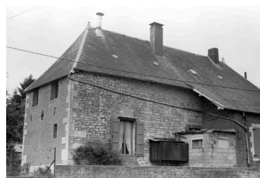
Elévation postérieure.