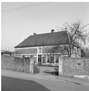
Elévation antérieure. IVR22_20020200253X

IVR22_20080290156NUCA