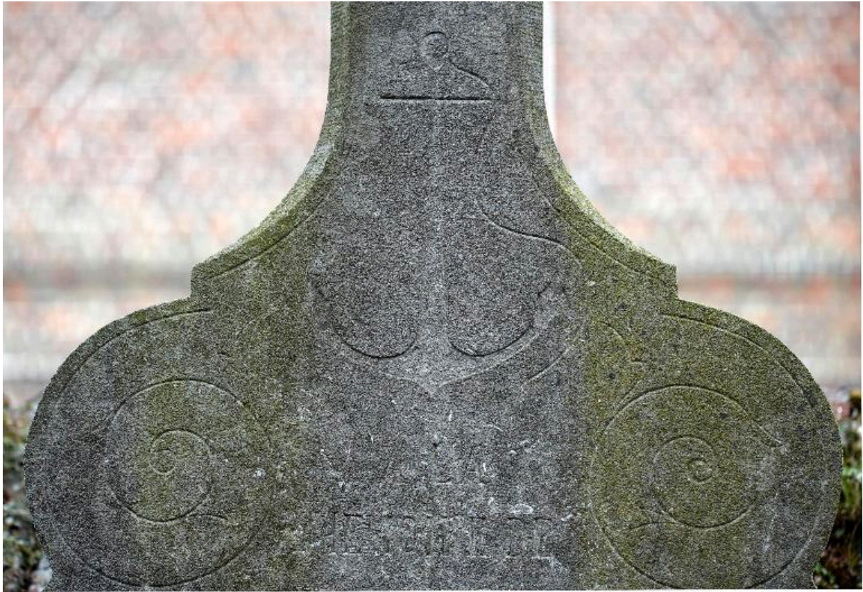
Ancre décorant une tombe de batelier.