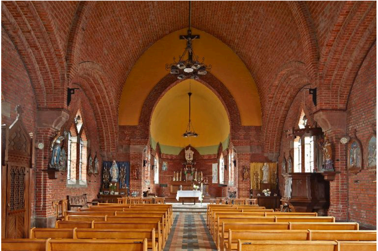
Vue générale vers le chœur.