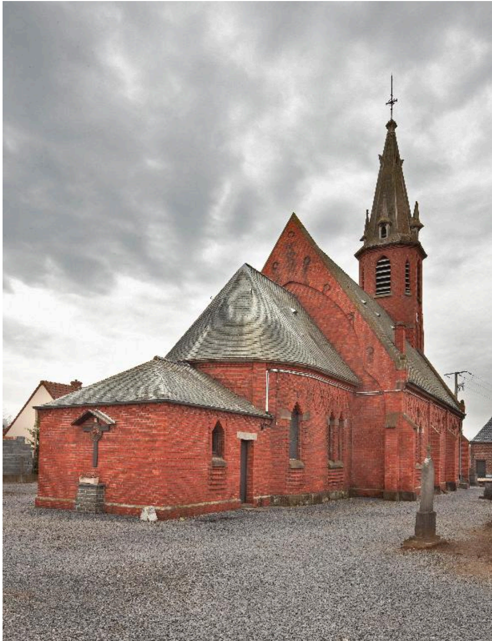
Vue générale depuis le chevet.