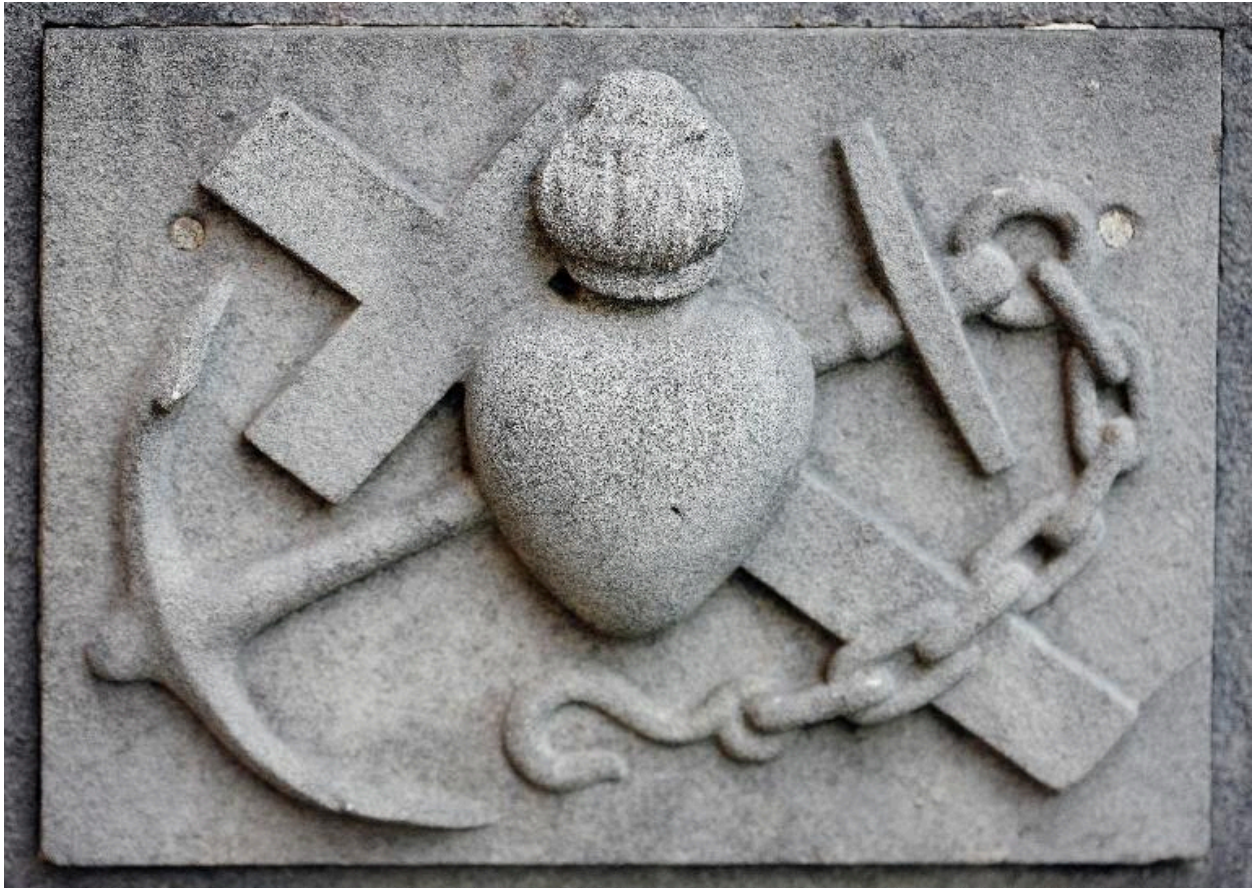
Ancre décorant une tombe de batelier située dans le cimetière entourant l'église.