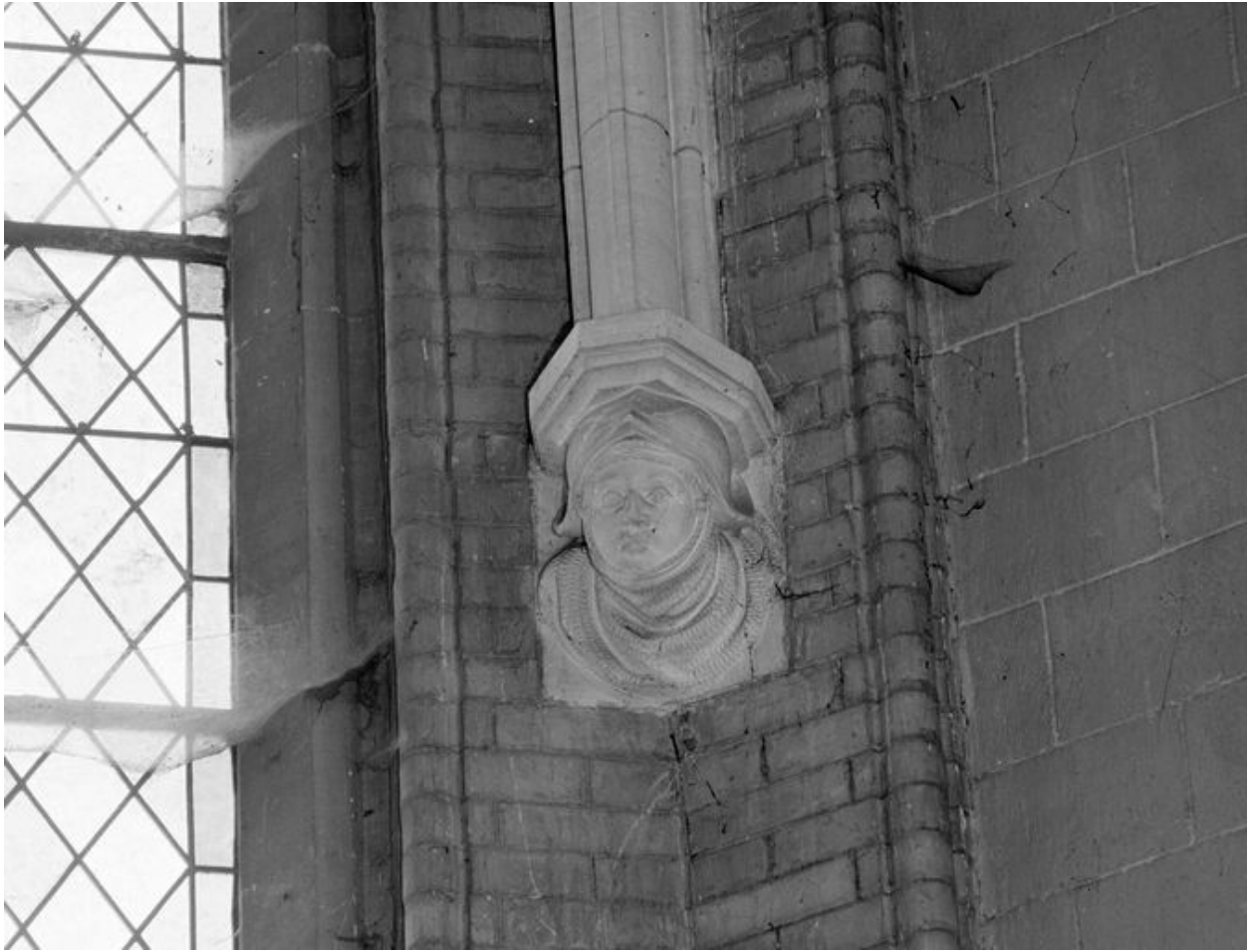
Détail d'un cul de lampe figuré.