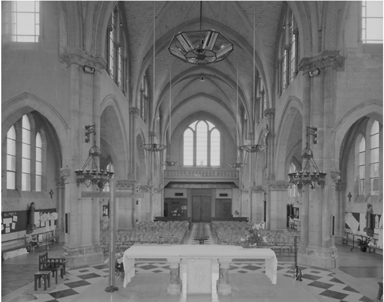
Vue intérieure vers l'est.