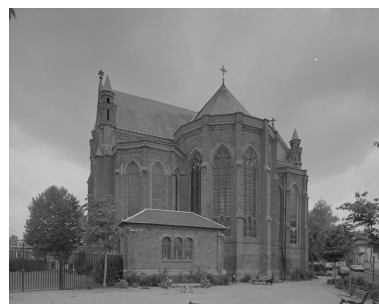
Vue générale depuis le nord-ouest. IVR22_19968000230V