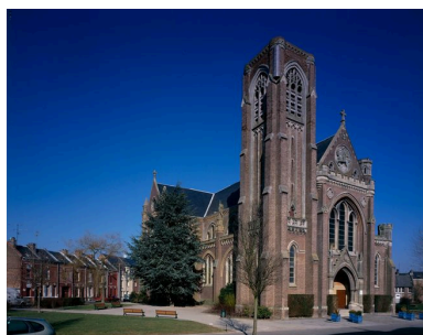
Vue générale. IVR22_20038000219VA