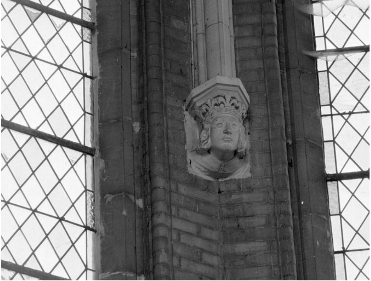
Détail d'un cul de lampe figuré.