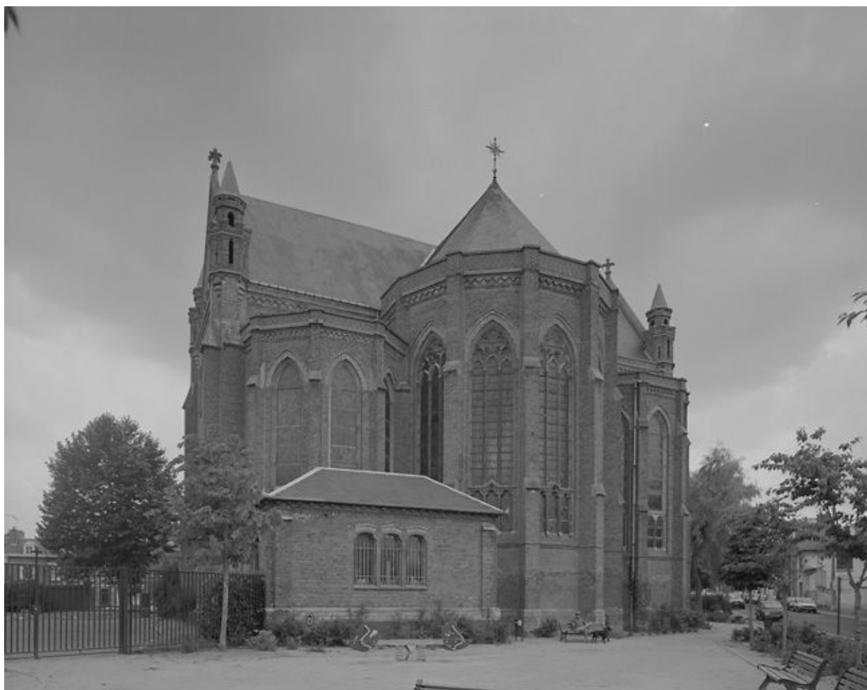
Vue générale depuis le nord-ouest.