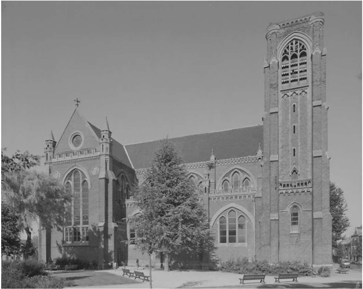
Vue générale depuis le sud.