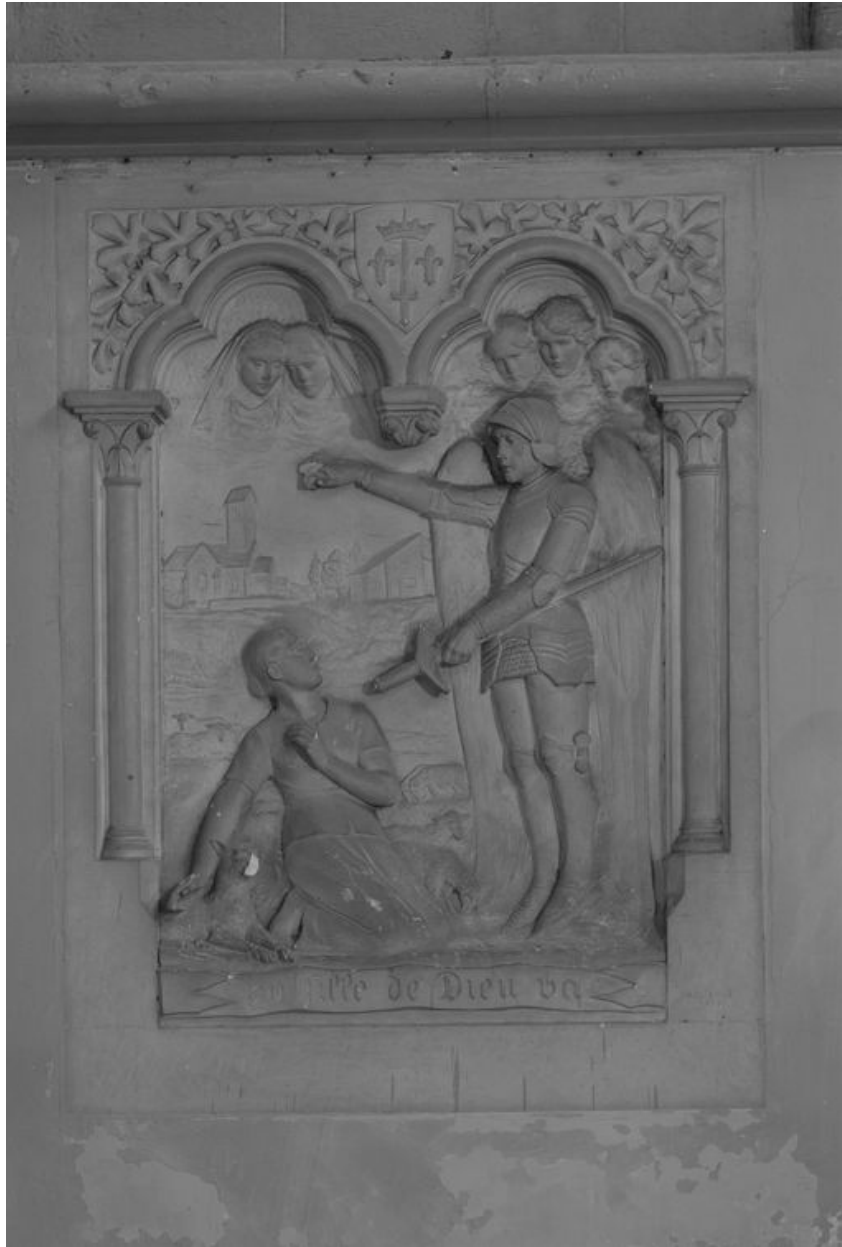
Bas-relief : la révélation de Jeanne la bergère, Albert Roze, 1921.