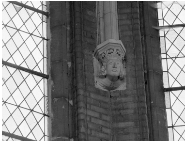
Détail d'un cul de lampe figuré. IVR22_19968000227X