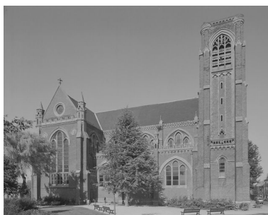
Vue générale depuis le sud. IVR22_19968000229V