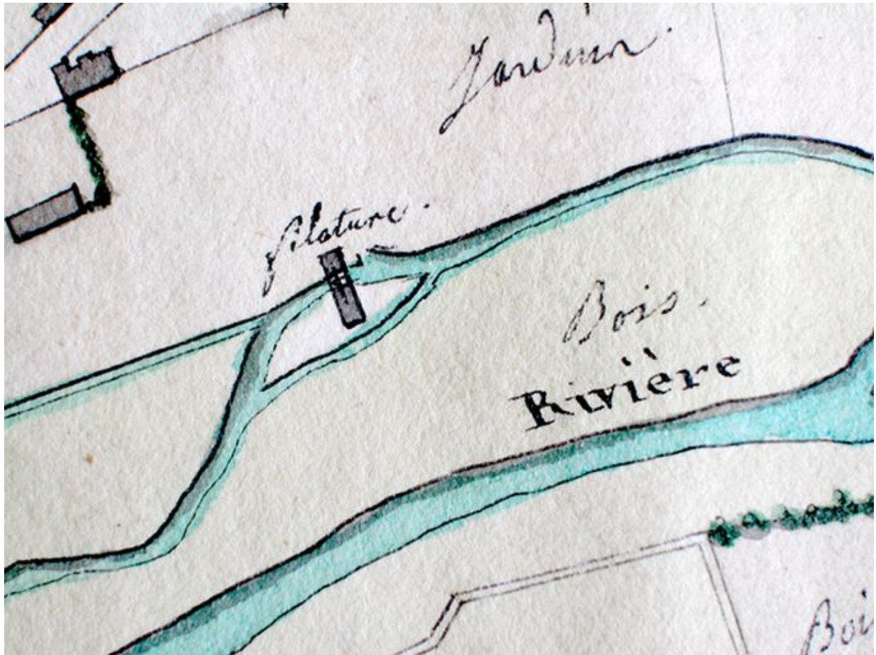
Plan de la filature sur le Thérain, 1819 (AD Oise ; plan 1323 7).