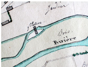
Plan de la filature sur le Thérain, 1819 (AD Oise ; plan 1323 7).