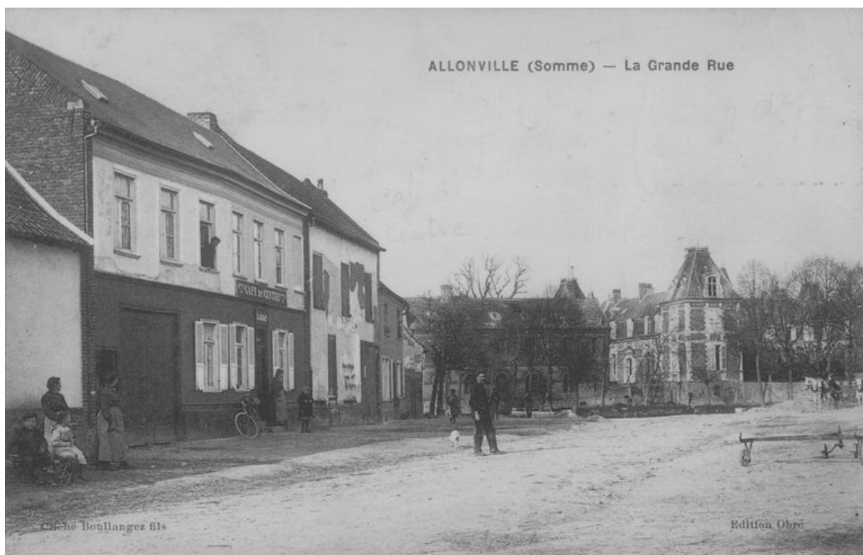
La Grande Rue, carte postale, cliché Boullangez fils, édit. Oubré, 1er quart 20e siècle (AD Somme ; collection particulière)