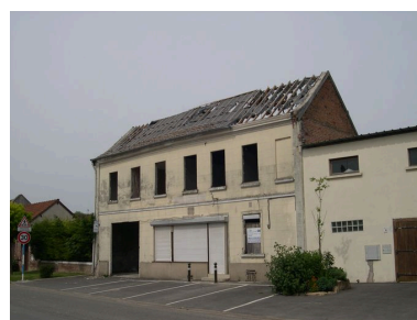
Vue générale. IVR22_20038010429NUCA