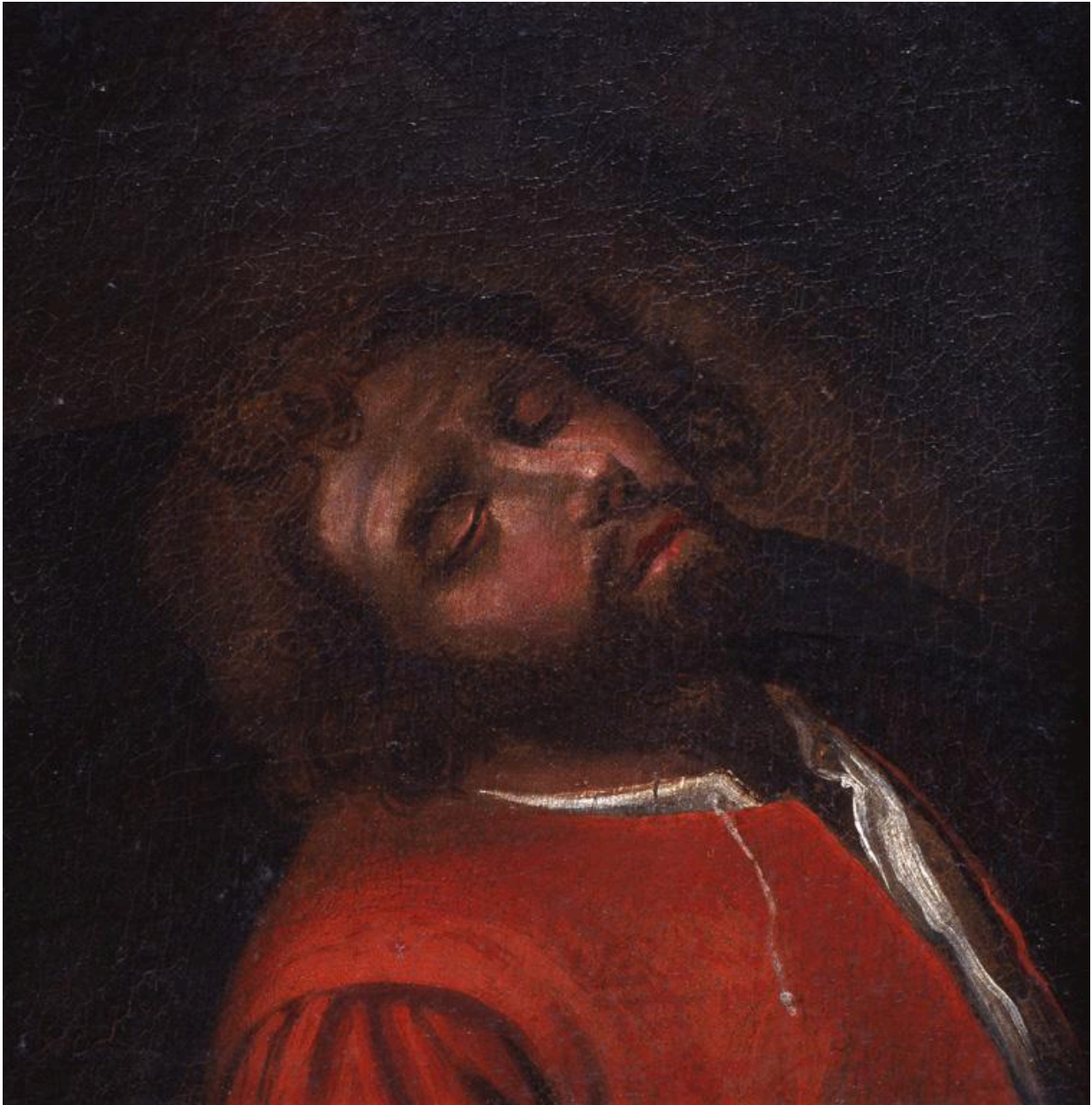
Détail de la tête de Jacob, reposant sur un bétyle.