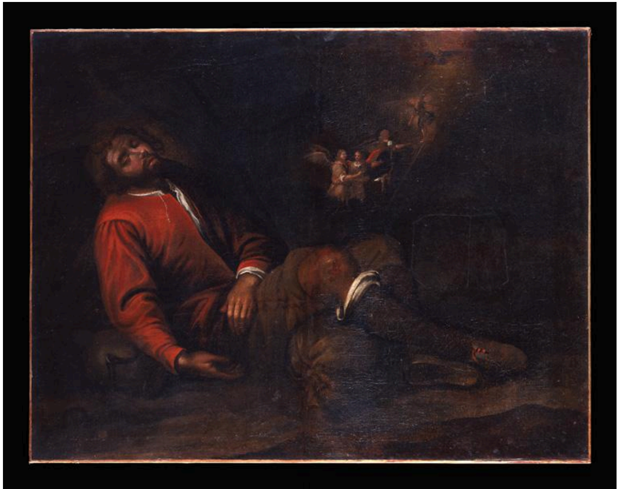
Vue de l'oeuvre.