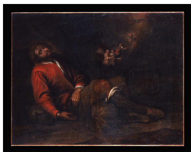
Vue de l'oeuvre. IVR22_20000200761VA