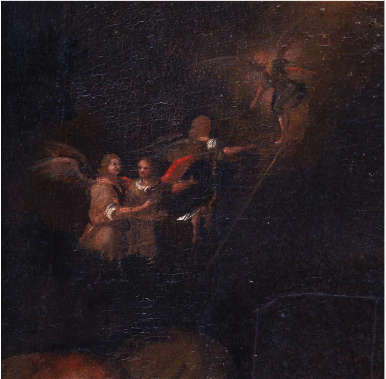
Détail de l'échelle céleste, avec les anges emmenant une âme au Paradis.