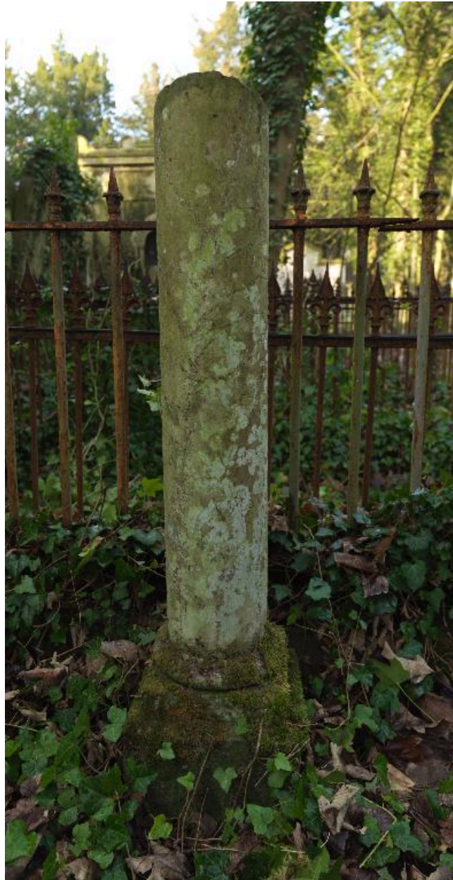
Colonne funéraire brisée, vers 1864.