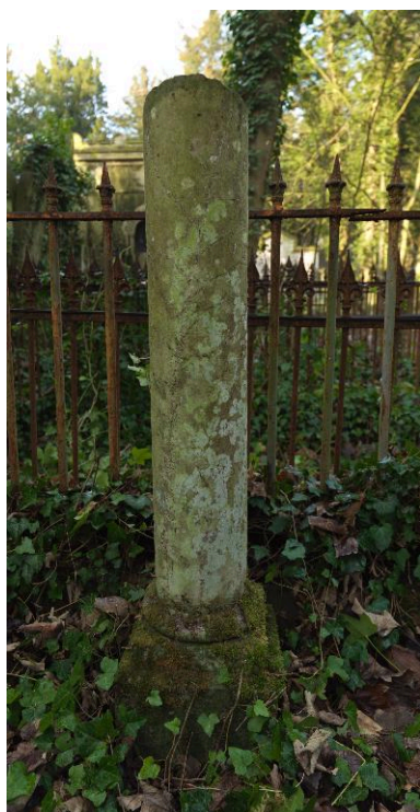
Colonne funéraire brisée, vers 1864. IVR22_20138000618NUC2A

IVR22_20138000616NUC2A