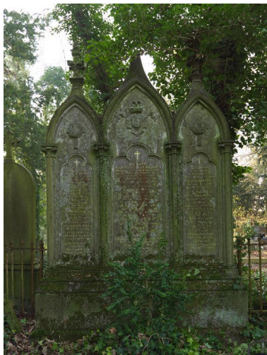
Stèle architecturée, de style néogothique.

IVR22_20138000613NUC2A