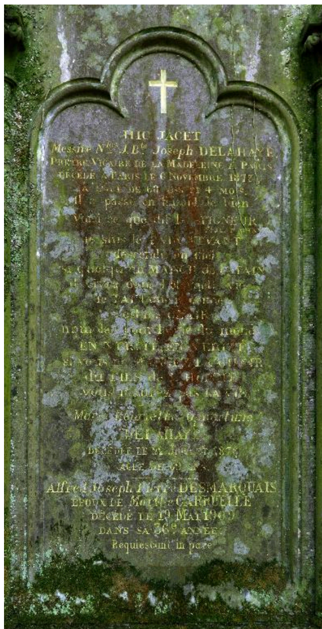
Vue de la table centrale de la stèle.