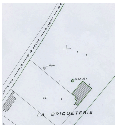
Plan de situation. Extrait du plan cadastral de 1982, section AB 227 et 1.

Autr. Michel Hérold IVR22_20096000164NUCA