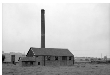
Le hangar et la cheminée d'usine portant la date de 1919.