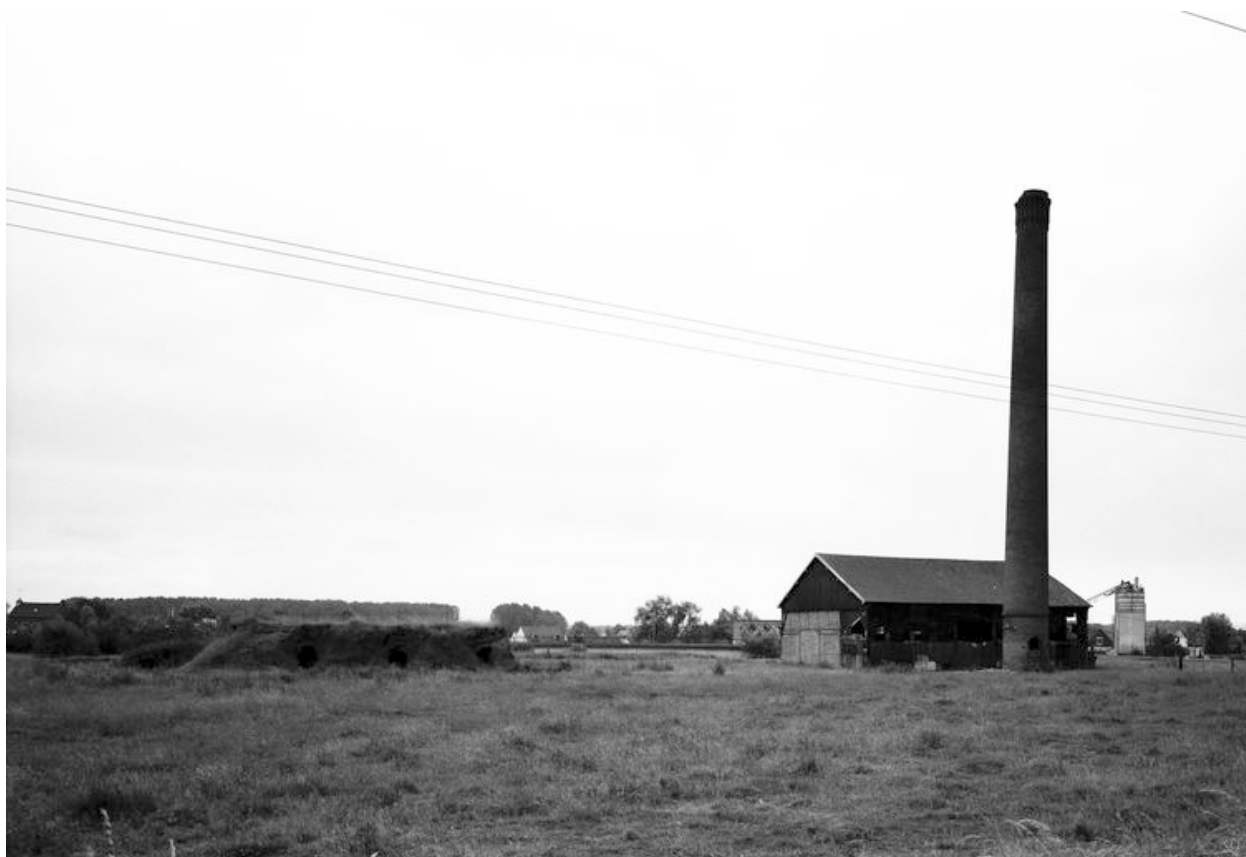
La briqueterie avec les vestiges du four à gauche, le hangar et la cheminée d'usine à droite.