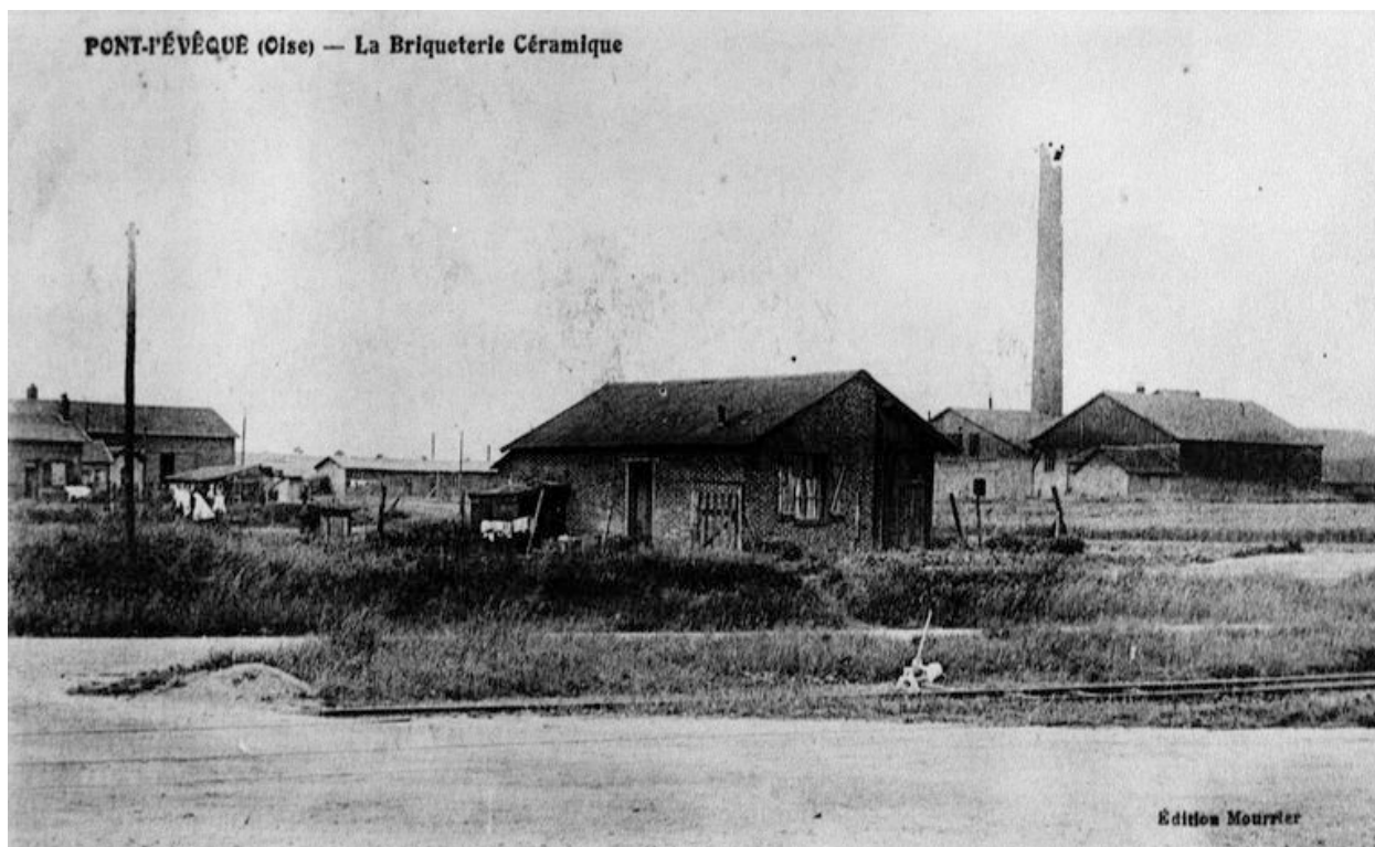
La briqueterie avant 1914 (AP).