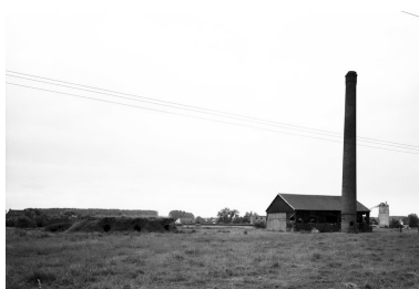
La briqueterie avec les vestiges du four à gauche, le hangar et la cheminée d'usine à droite.