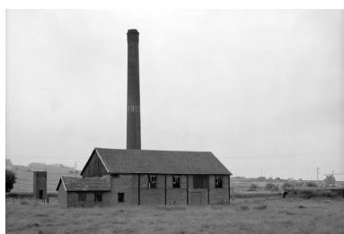
Le hangar et la cheminée d'usine portant la date de 1919. IVR22_19856000968X