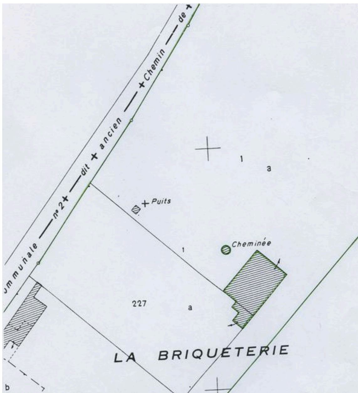
Plan de situation. Extrait du plan cadastral de 1982, section AB 227 et 1.