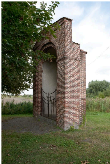
Vue générale de trois quarts. IVR31_20125902187NUCA