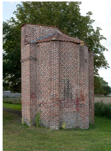
Vue générale postérieure. IVR31_20125902188NUCA