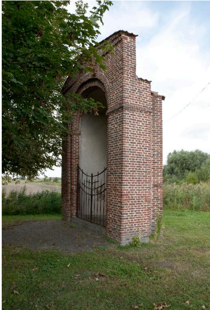
Vue générale de trois quarts.