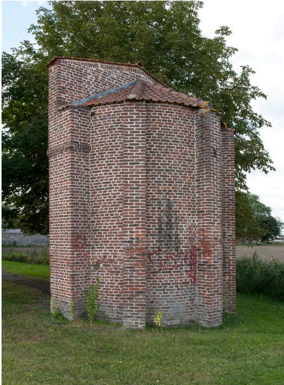
Vue générale postérieure.