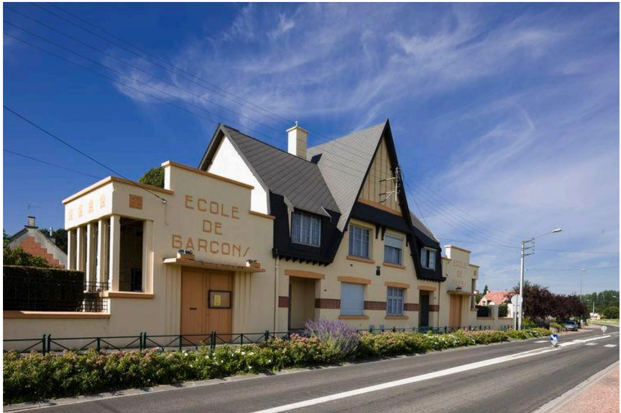
Vue générale de trois quarts depuis la rue.