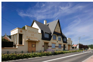
Vue générale de trois quarts depuis la rue.