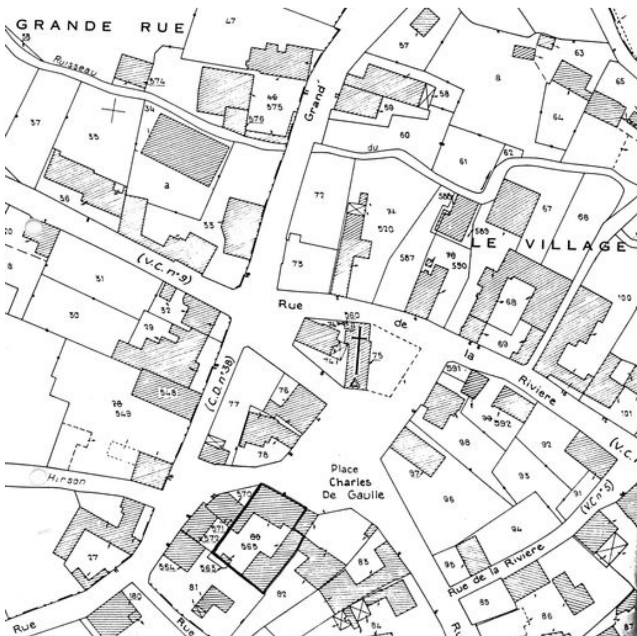
Plan de situation. Extrait du plan cadastral de 1986, section C1.