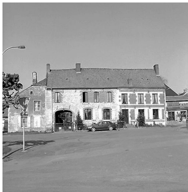
Vue générale. IVR22_20020200282X