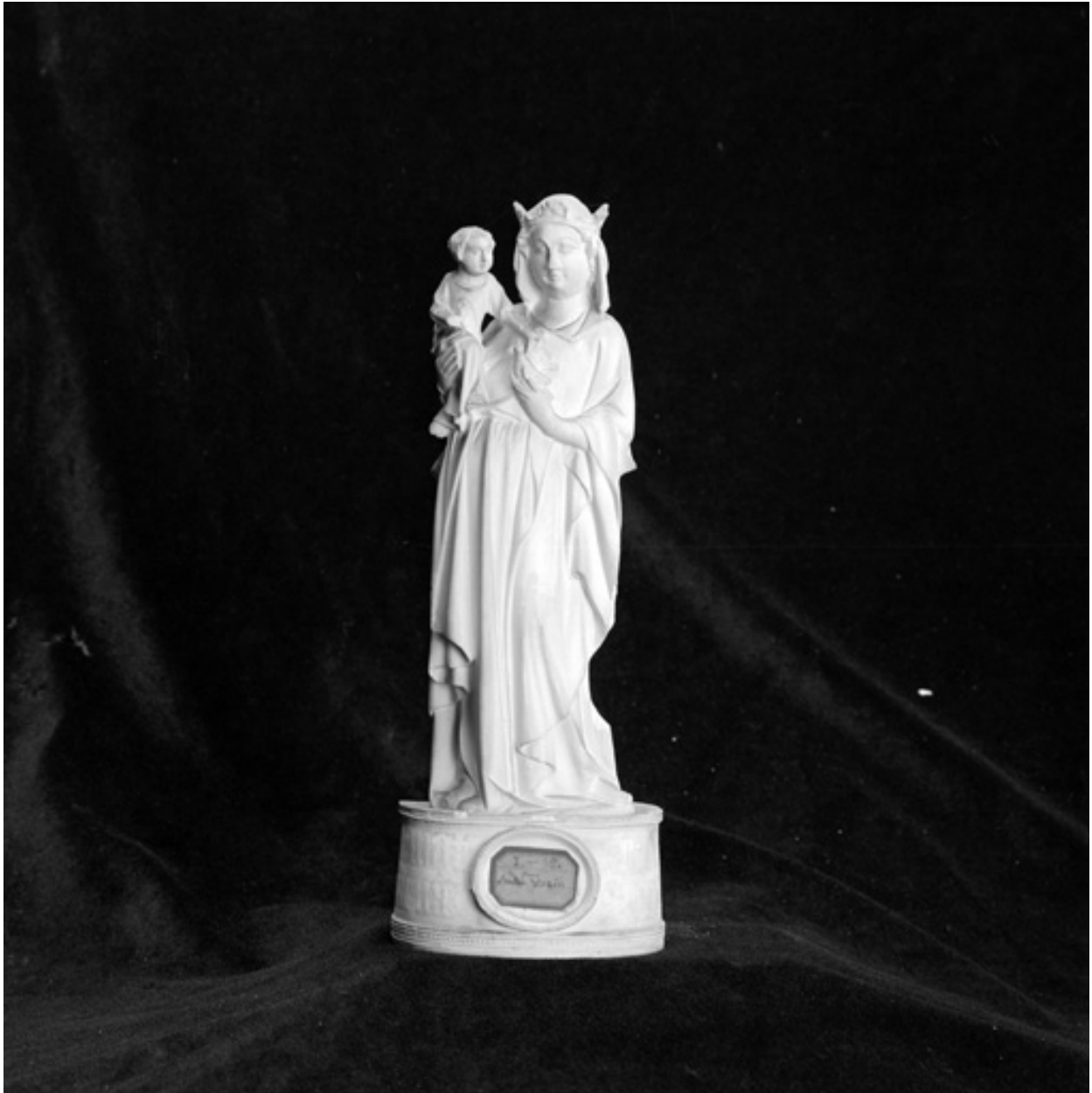
Moulage en plâtre, 19e siècle, d'une Vierge de l'église de Pavant de 1471. Collections de la S.H.A.C.T.