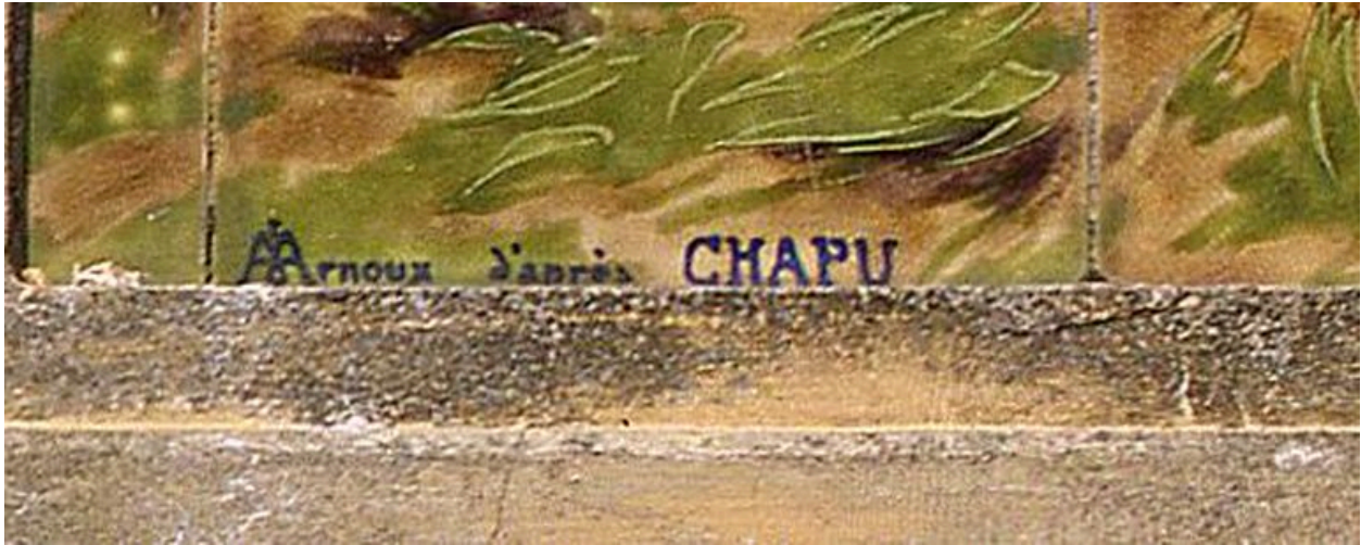
Détail de la signature du panneau de céramique.