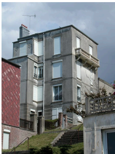
Vue depuis la rue de Saint-Valery, façade sur mer. IVR22_20058003514NUCA