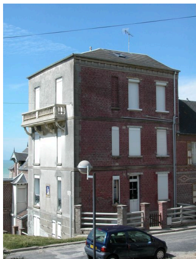
Vue d'ensemble depuis l'avenue du Casino.