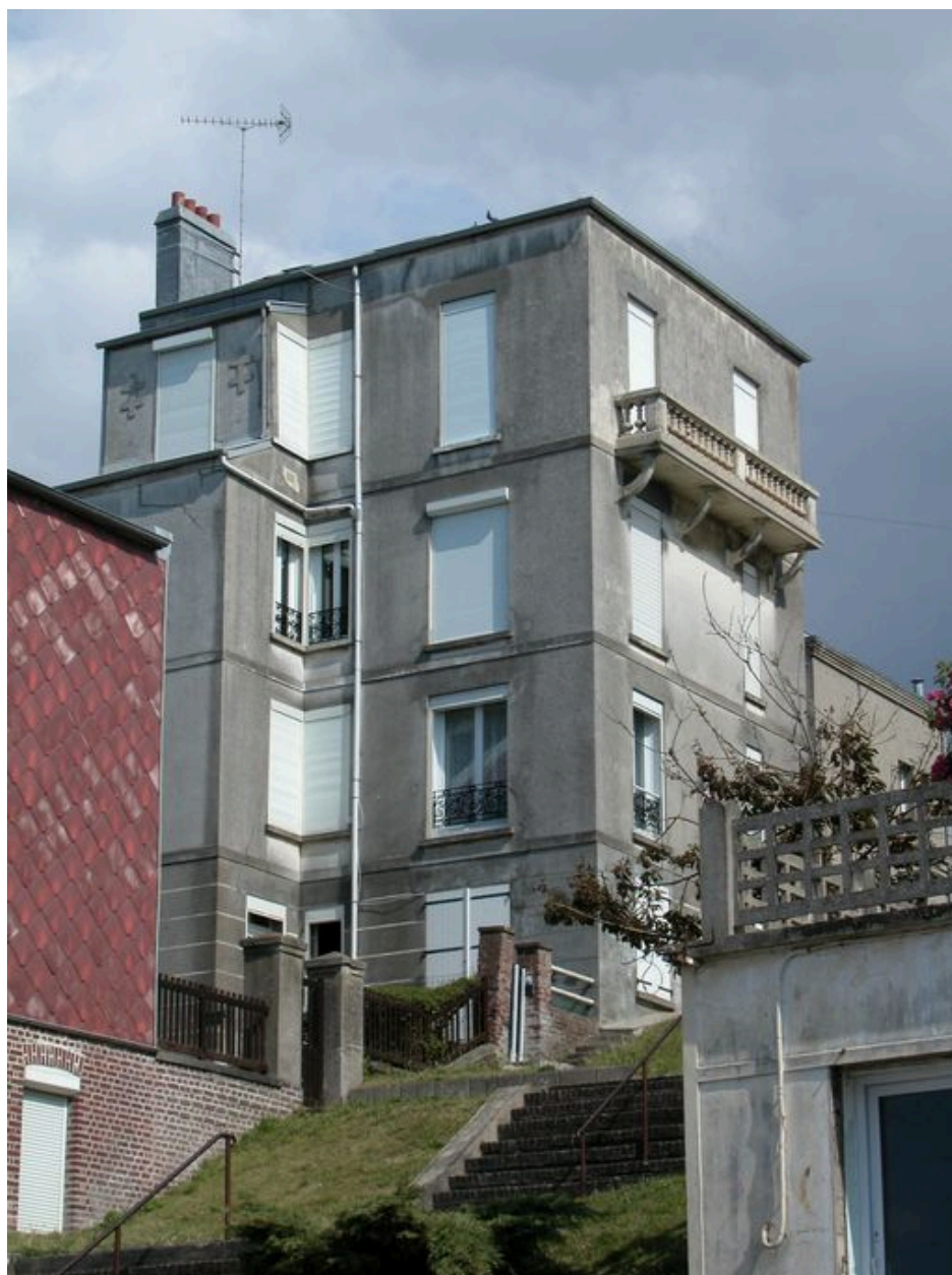
Vue depuis la rue de Saint-Valery, façade sur mer.