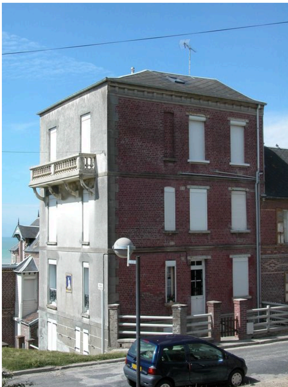
Vue d'ensemble depuis l'avenue du Casino.