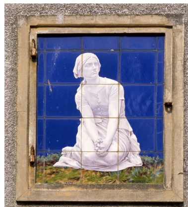
Détail du panneau de céramique apposé sur la façade latérale. IVR22_20058000955XA