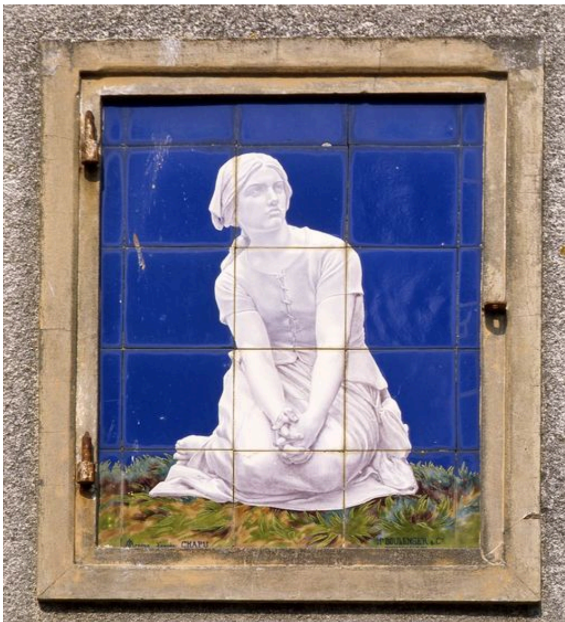
Détail du panneau de céramique apposé sur la façade latérale.