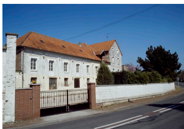
Vue générale. IVR22_20108000137XA