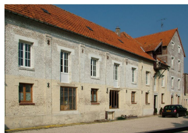
Élévation antérieure. IVR22_20098005403NUCA