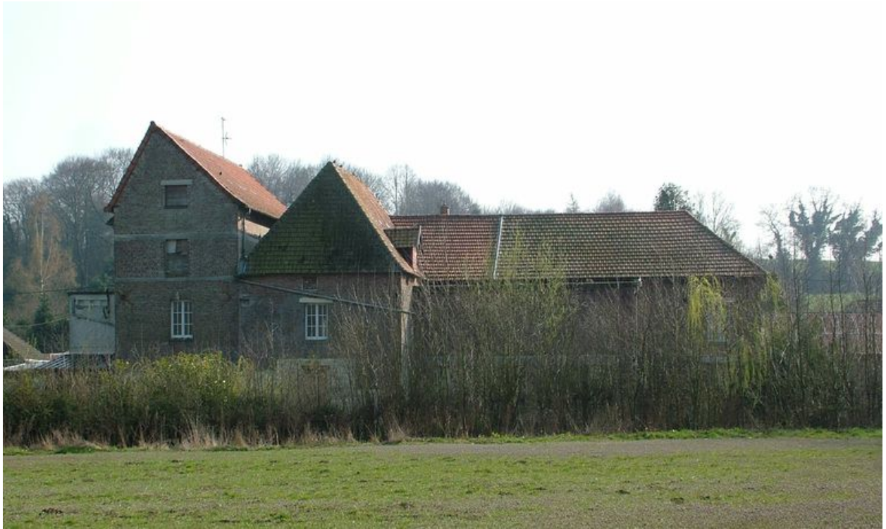
Vue générale sur la Nièvre.