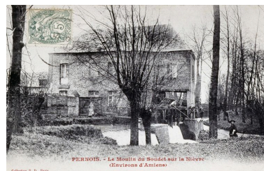
Vue générale depuis la rivière, avant 1914.