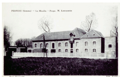
Vue générale depuis la route, avant 1933 (coll. part.). IVR22_20108000072XA