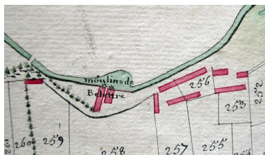
Extrait de l'atlas terrier, première carte, 4e quart 18e siècle (AD Somme ; 3G 79). IVR22_20088015399NUCA