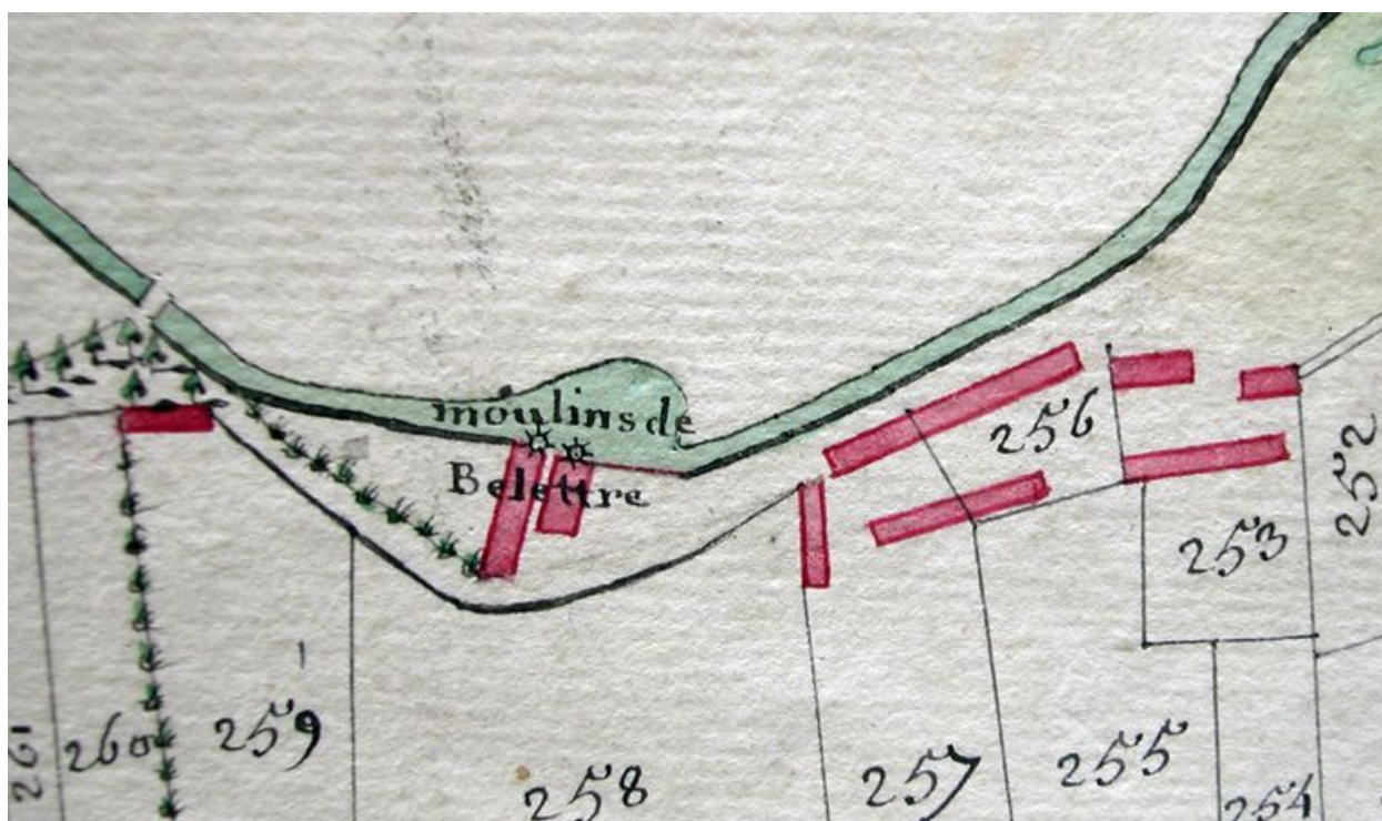
Extrait de l'atlas terrier, première carte, 4e quart 18e siècle (AD Somme ; 3G 79).