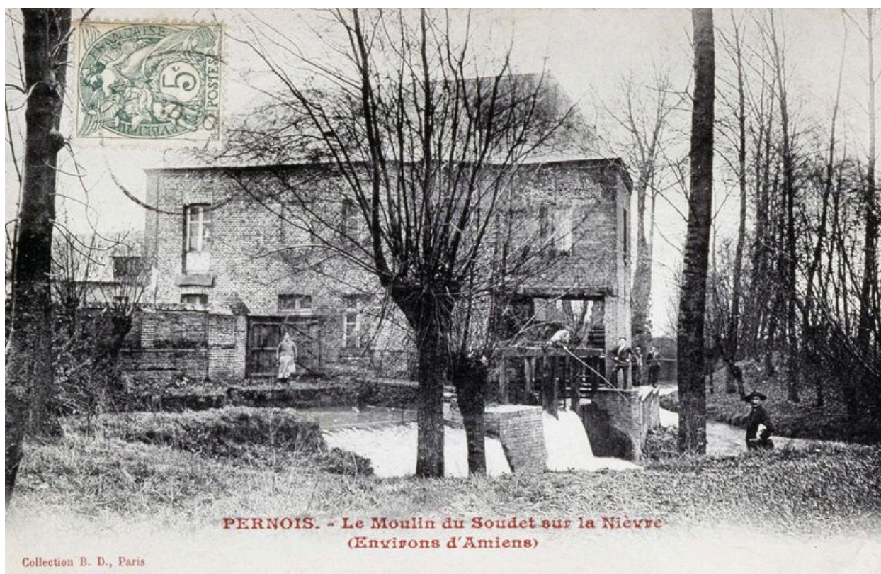
Vue générale depuis la rivière, avant 1914.