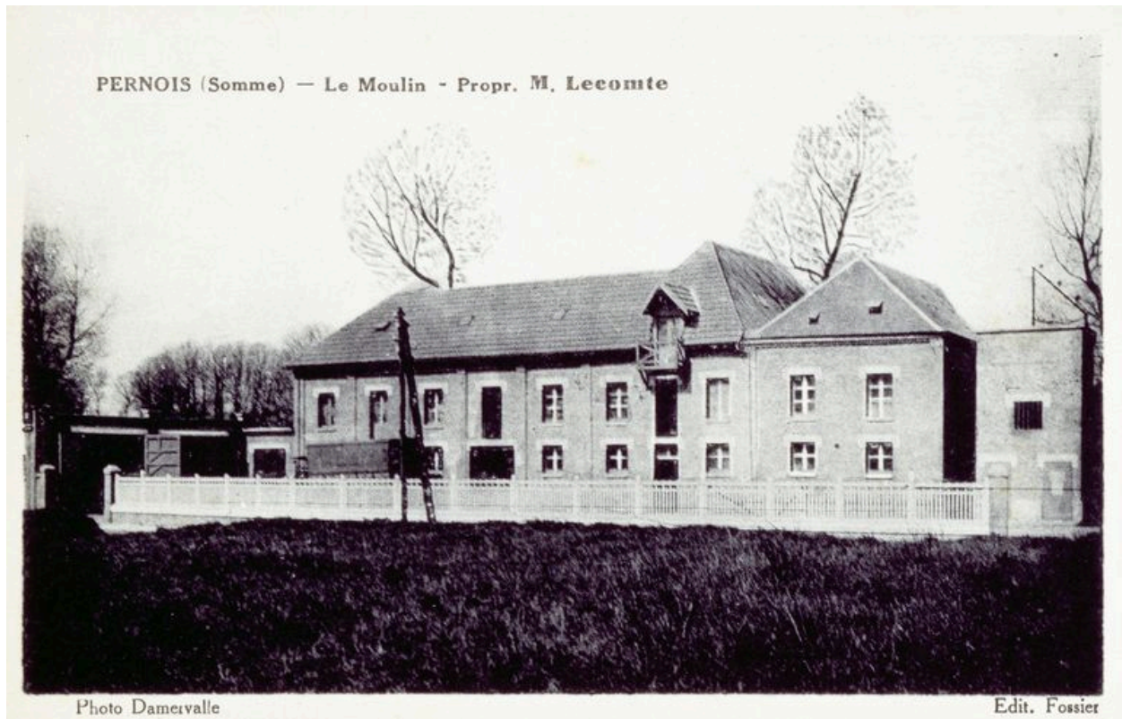
Vue générale depuis la route, avant 1933.