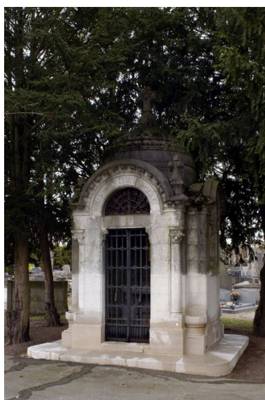
Vue générale. IVR22_20058000289NUCA