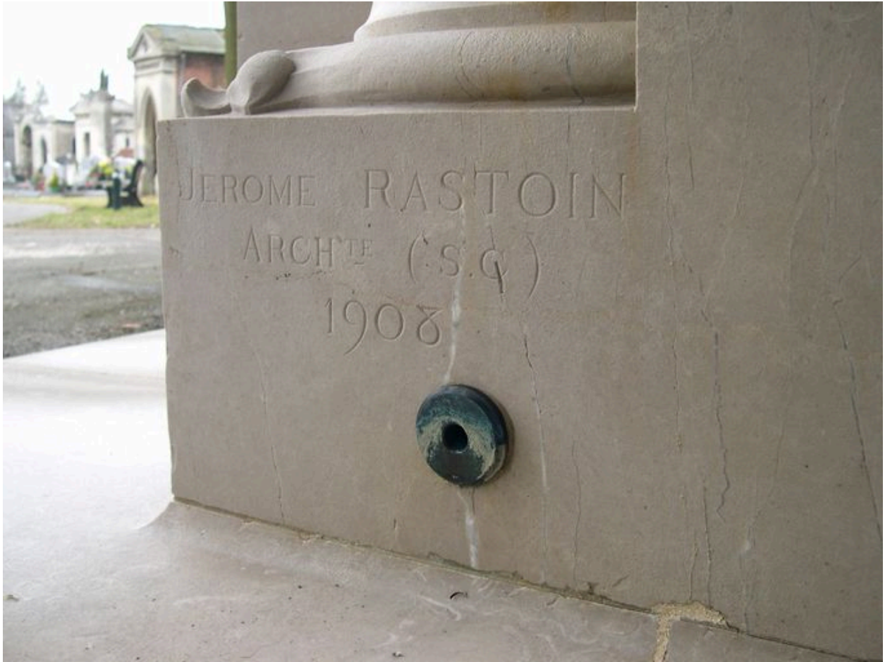
Vue de détail sur la signature.