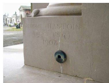
Vue de détail sur la signature.