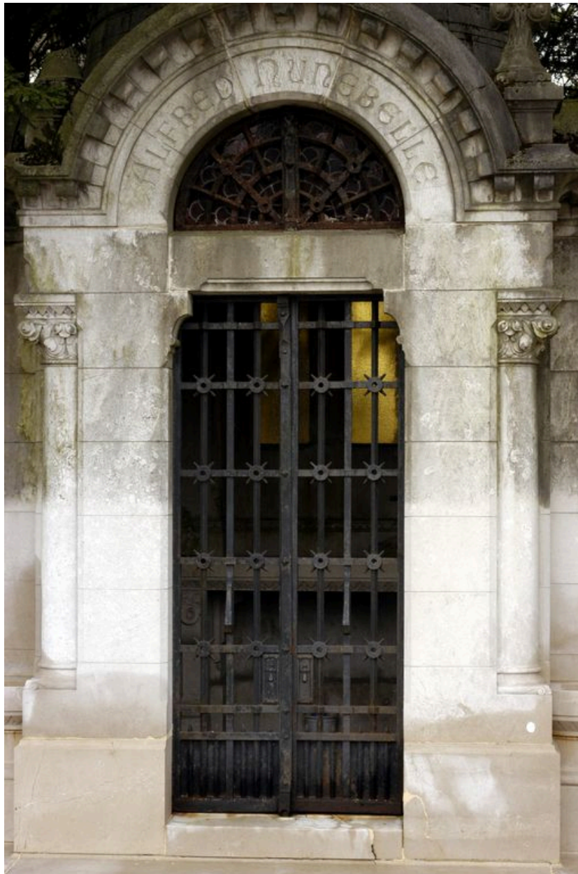
Vue de détail sur la porte.