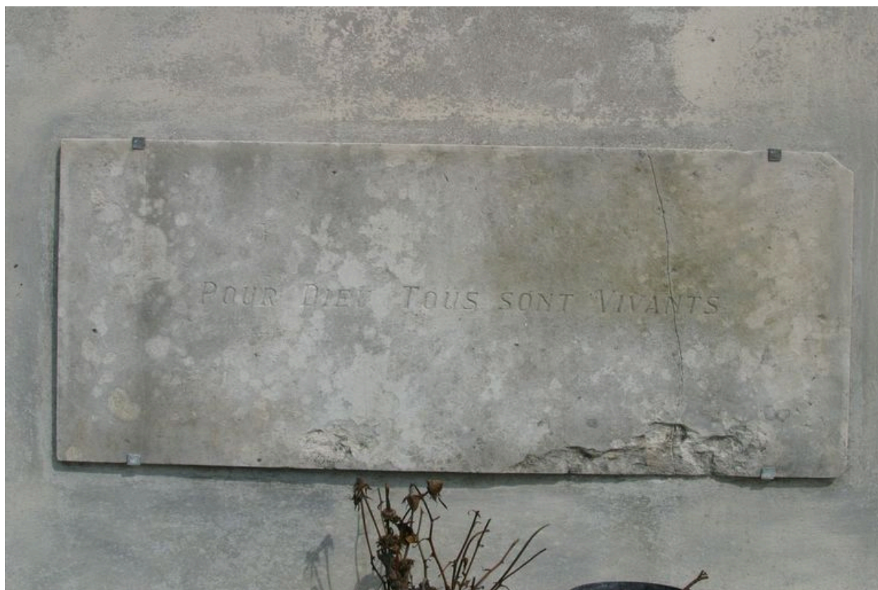
Détail d'une plaque commémorative.