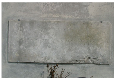
Détail d'une plaque commémorative.