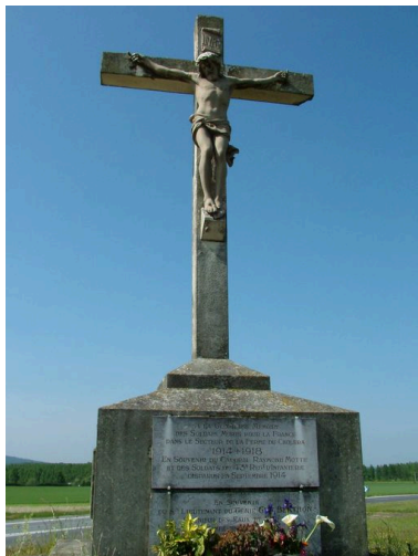
Vue générale. IVR22_20030202068NUCA