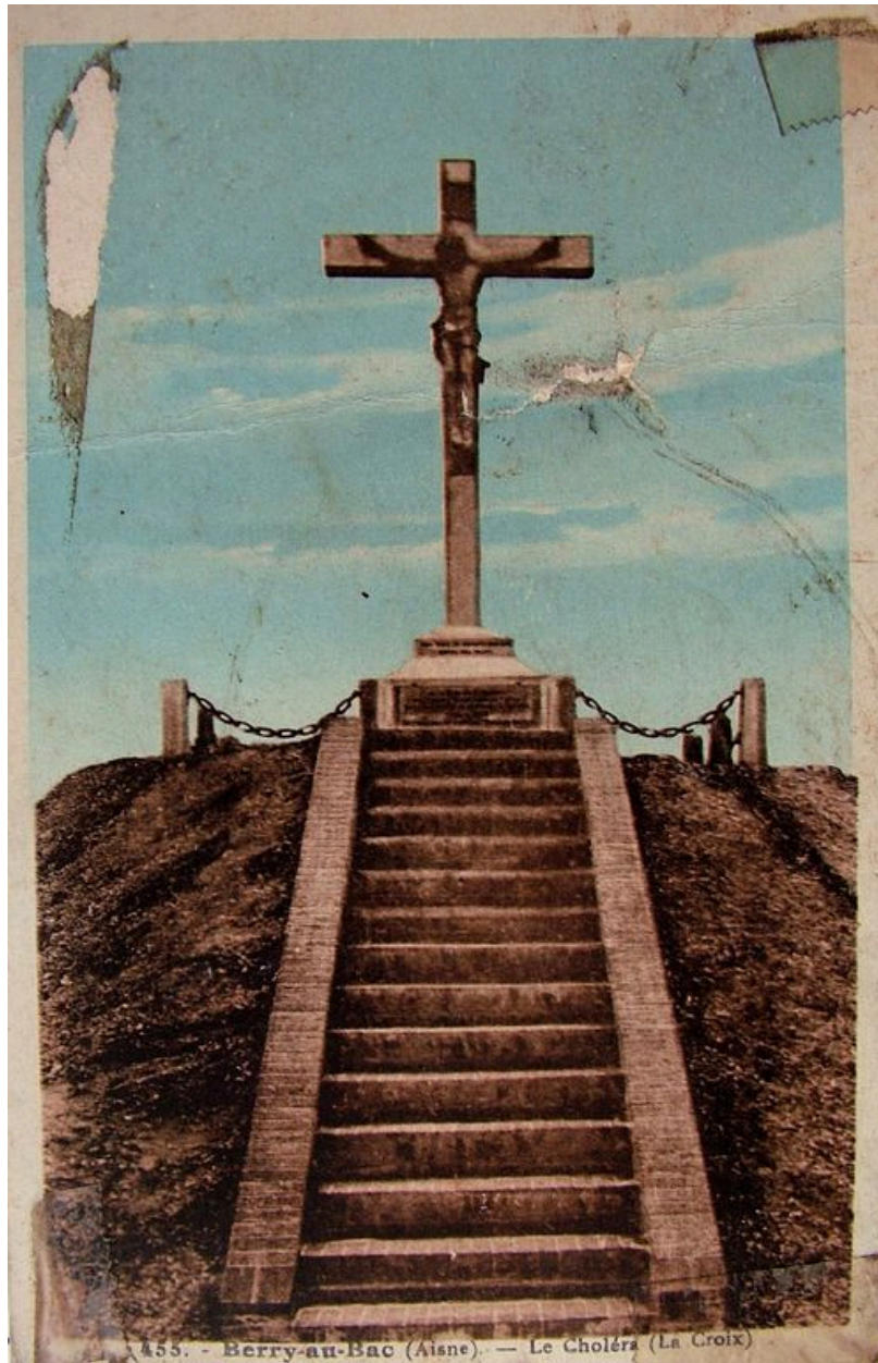
Vue ancienne de la croix (coll. part).