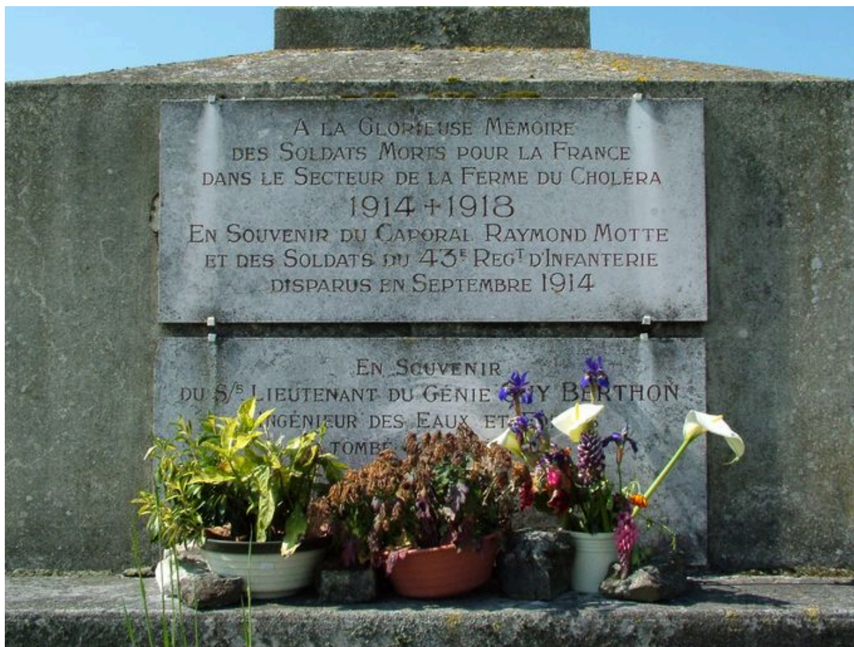
Détail d'une plaque commémorative.