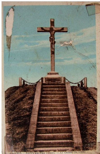
Vue ancienne de la croix.