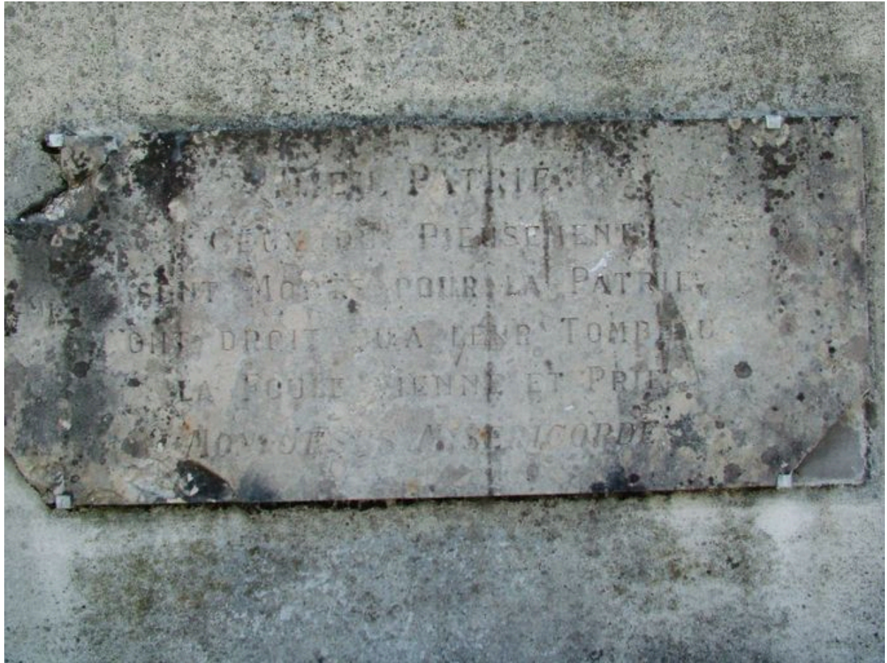
Détail d'une plaque commémorative.