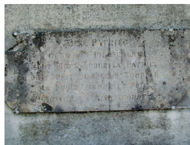
Détail d'une plaque commémorative.