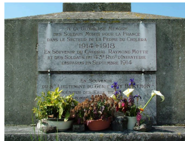
Détail d'une plaque commémorative.