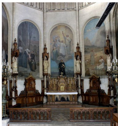
Vue générale. IVR22_20058001895NUCA