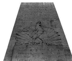
Détail du revers : le coq gaulois sur fond de soleil levant. IVR22_19968000020ZA