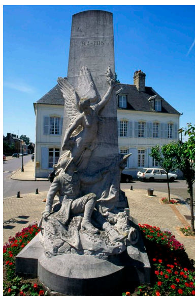
Vue générale. IVR22_19948000611ZA