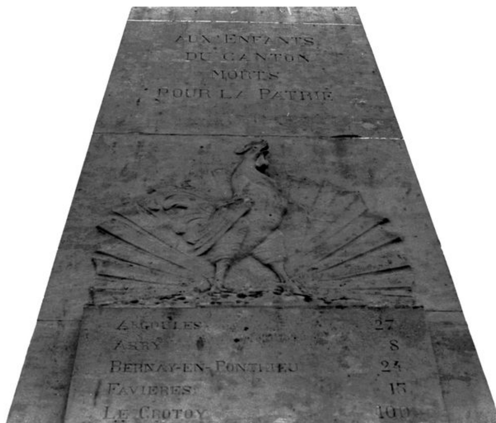
Détail du revers : le coq gaulois sur fond de soleil levant.