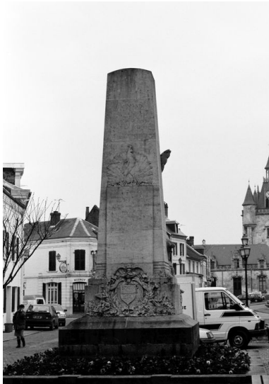
Vue postérieure.