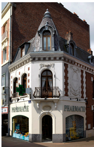
La pharmacie Musart, 14 place de l'Hôtel-de-Ville.

IVR22_20158000634NUC2A