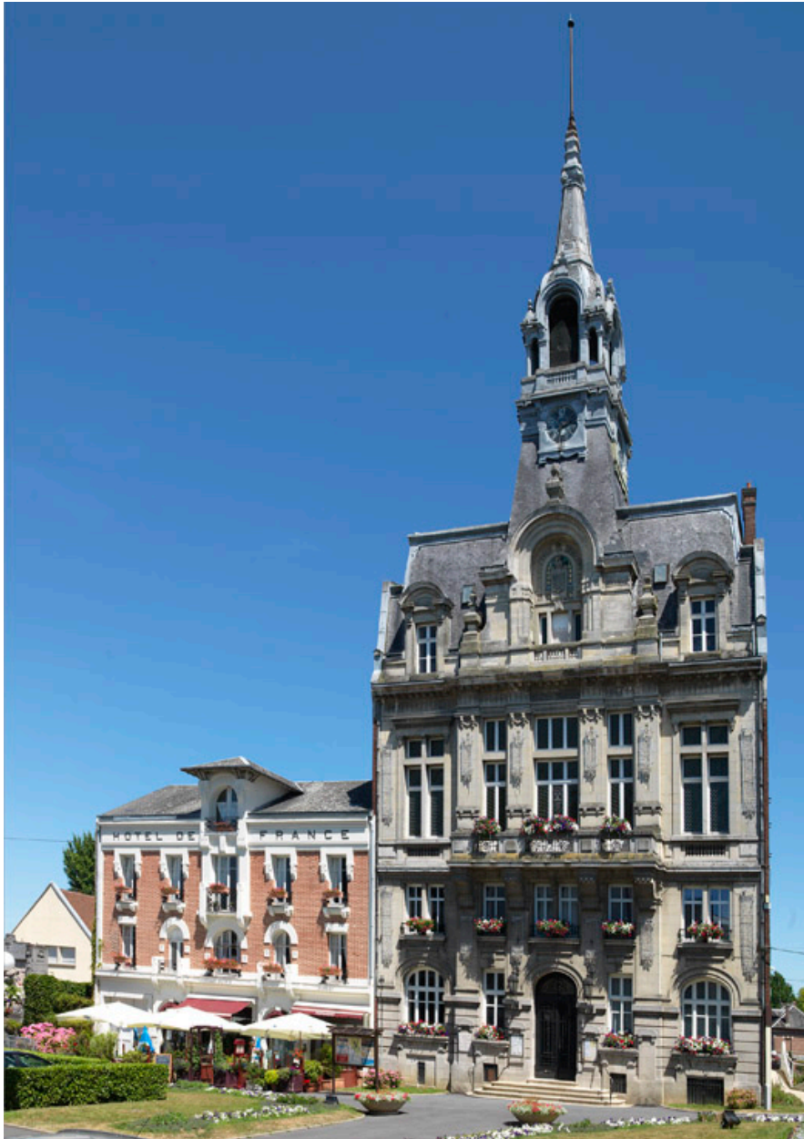
L'hôtel de ville et l'hôtel de France.