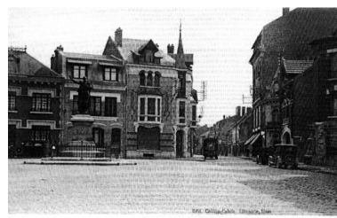
La place de l'hôtel de ville, carte postale, vers 1925. IVR22_20158005374NUCA