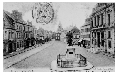
Ham. Place de l'Hôtel-de-Ville, Lib. Juniet-Rasse à Ham, carte postale, début 20e siècle (coll. part.). IVR22_19988001779XB