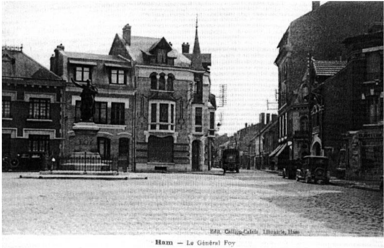
La place de l'hôtel de ville, carte postale, vers 1925 (AD Somme ; 8 Fi 1525).