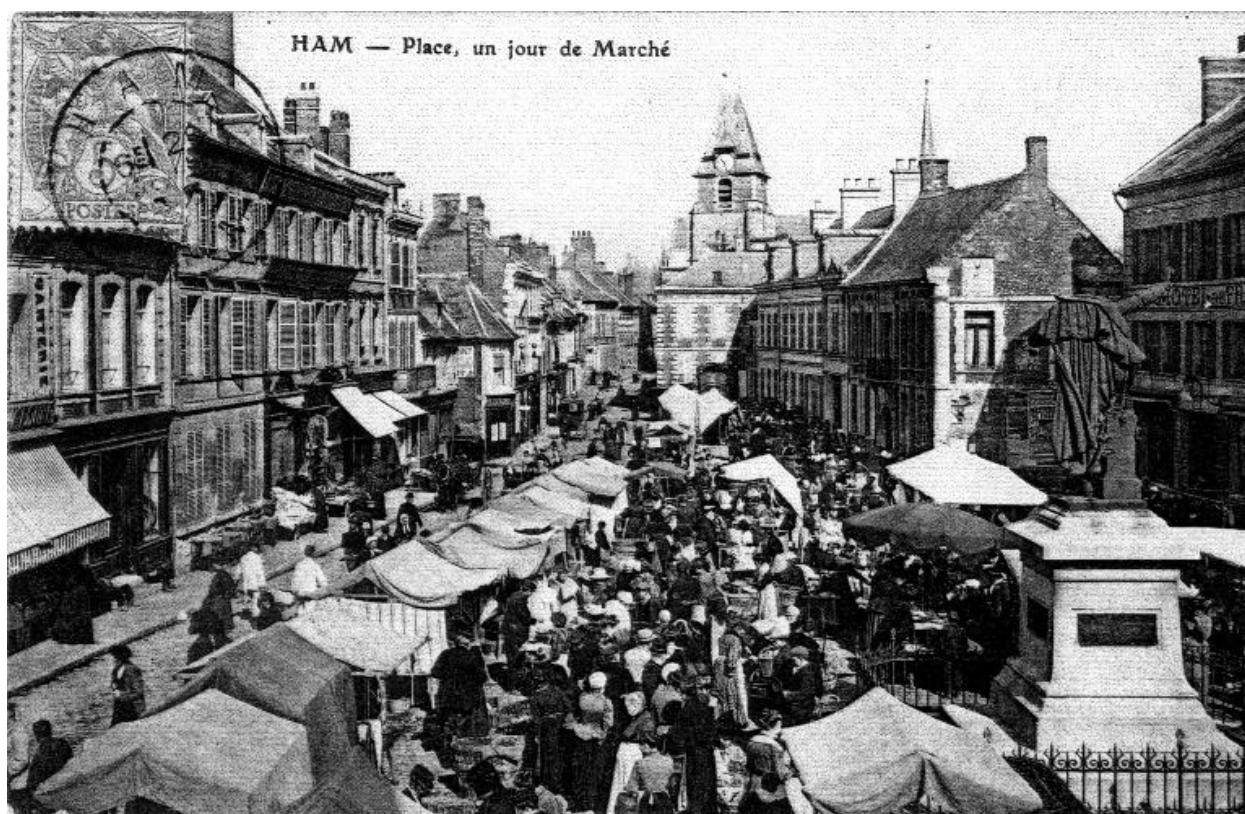
La place, avant 1914 (Historial de la Grande Guerre, n° 33995).