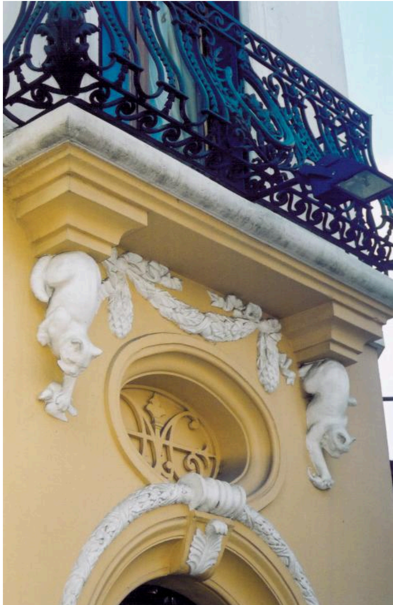
Détail du décor de la pharmacie Musart, 14 place de l'Hôtel-de-Ville.