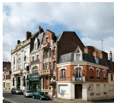
Maisons, 2, 4 et 6 place de l'Hôtel-de-Ville.