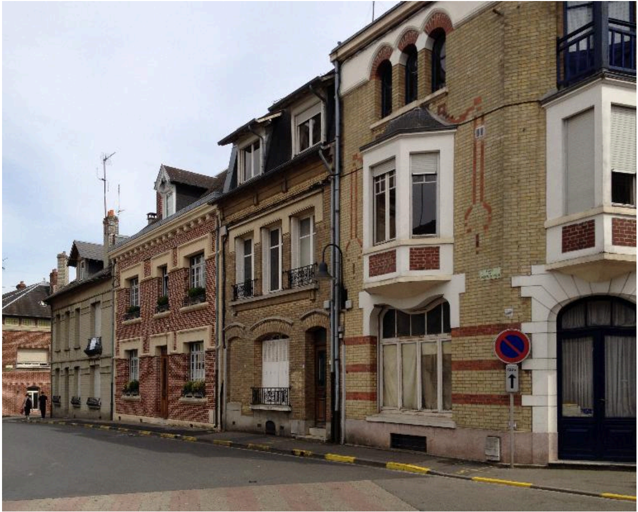
Demeures de la rive sud de la place, 15 à 11 place de l'Hôtel-de-Ville.