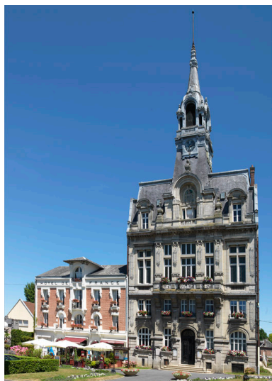
L'hôtel de ville et l'hôtel de France. IVR22_20158000622NUC2A