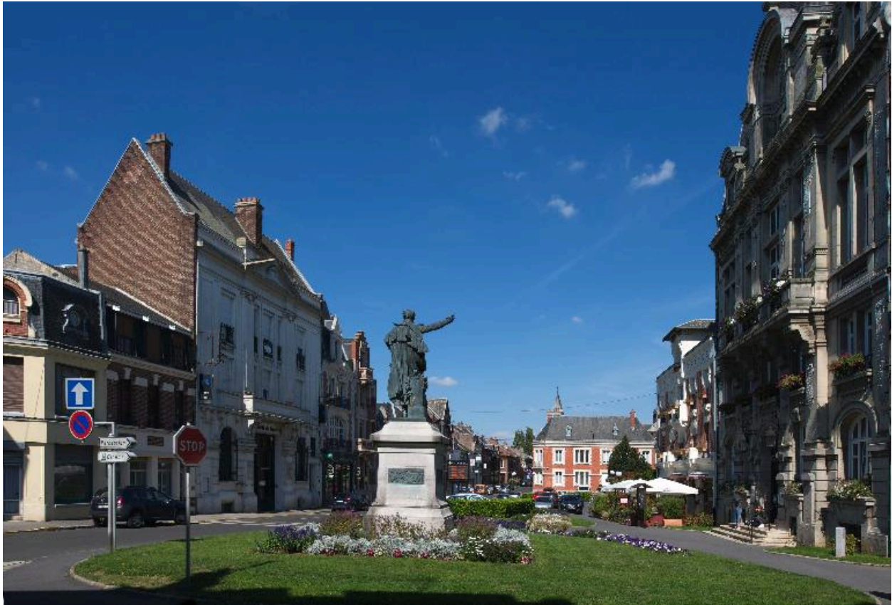
Vue générale vers le nord.