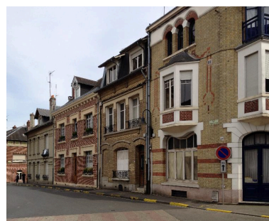
Demeures de la rive sud de la place, 15 à 11 place de l'Hôtel-de-Ville.

Phot. Gilles-Henri Bailly IVR22_20158005384NUCA