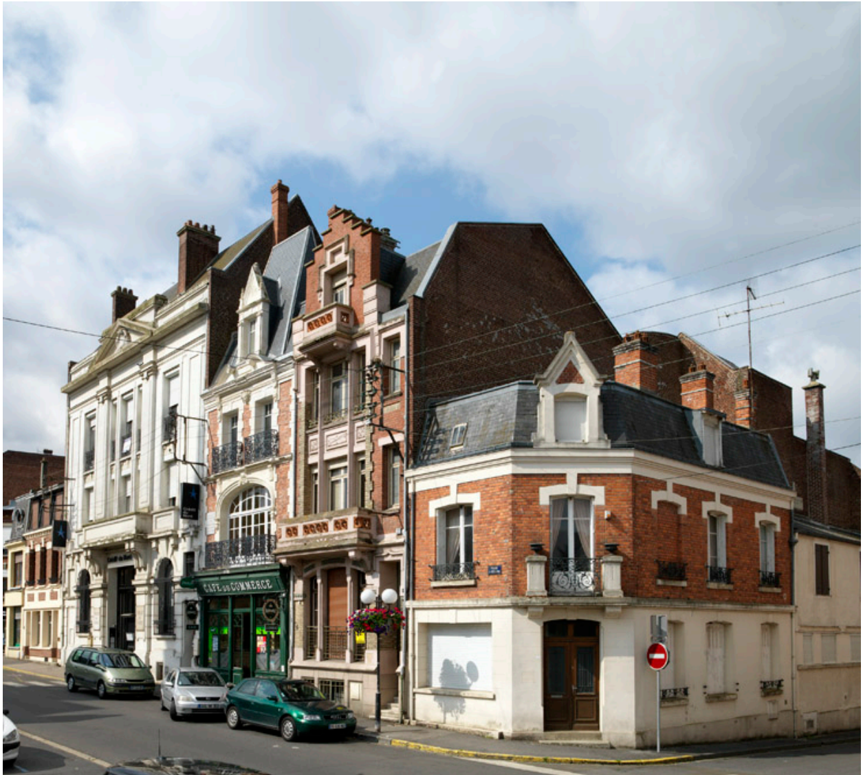
Maisons, 2, 4 et 6 place de l'Hôtel-de-Ville.