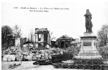
La Place de l'hôtel de ville, après les destructions de 1918.