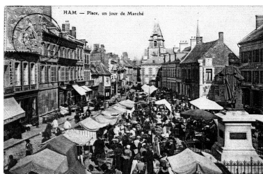
La place, avant 1914 (Historial de la Grande Guerre, n° 33995).