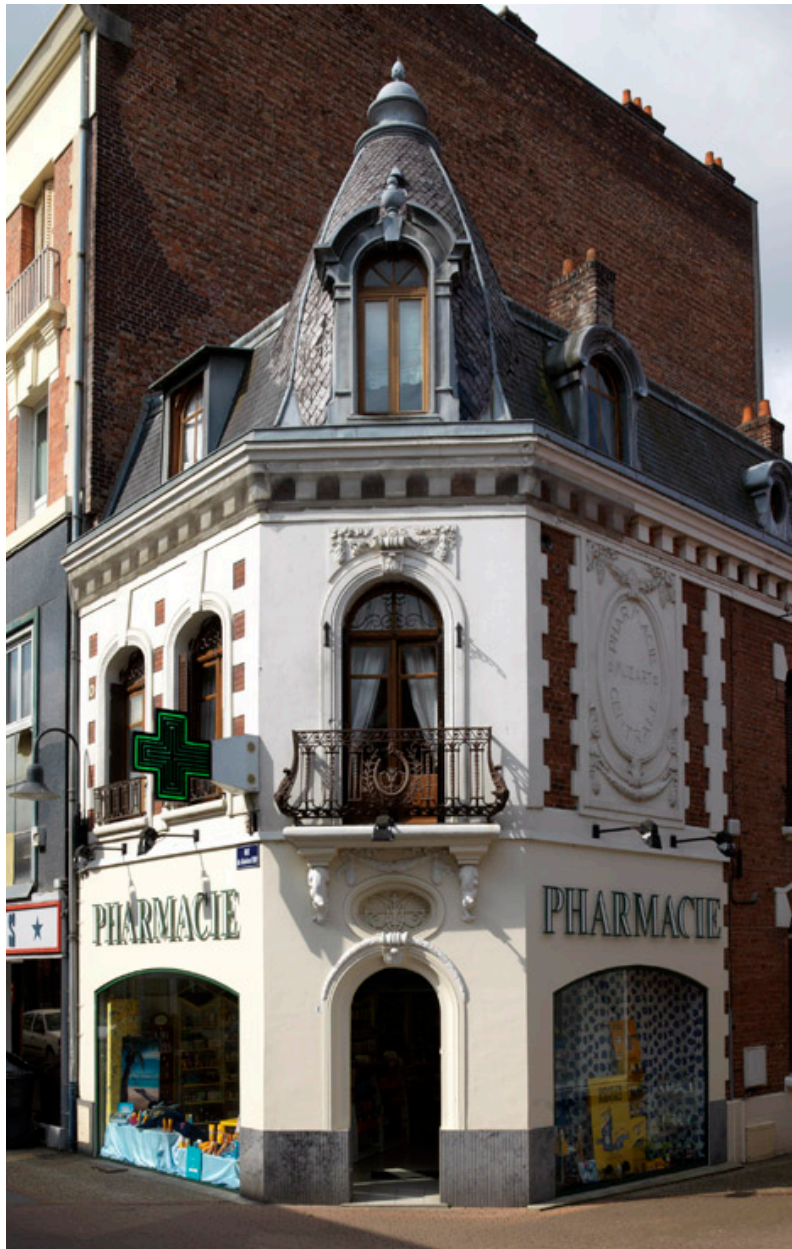
La pharmacie Musart, 14 place de l'Hôtel-de-Ville.