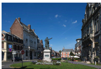
Vue générale vers le nord.

IVR22_20158006214NUCA