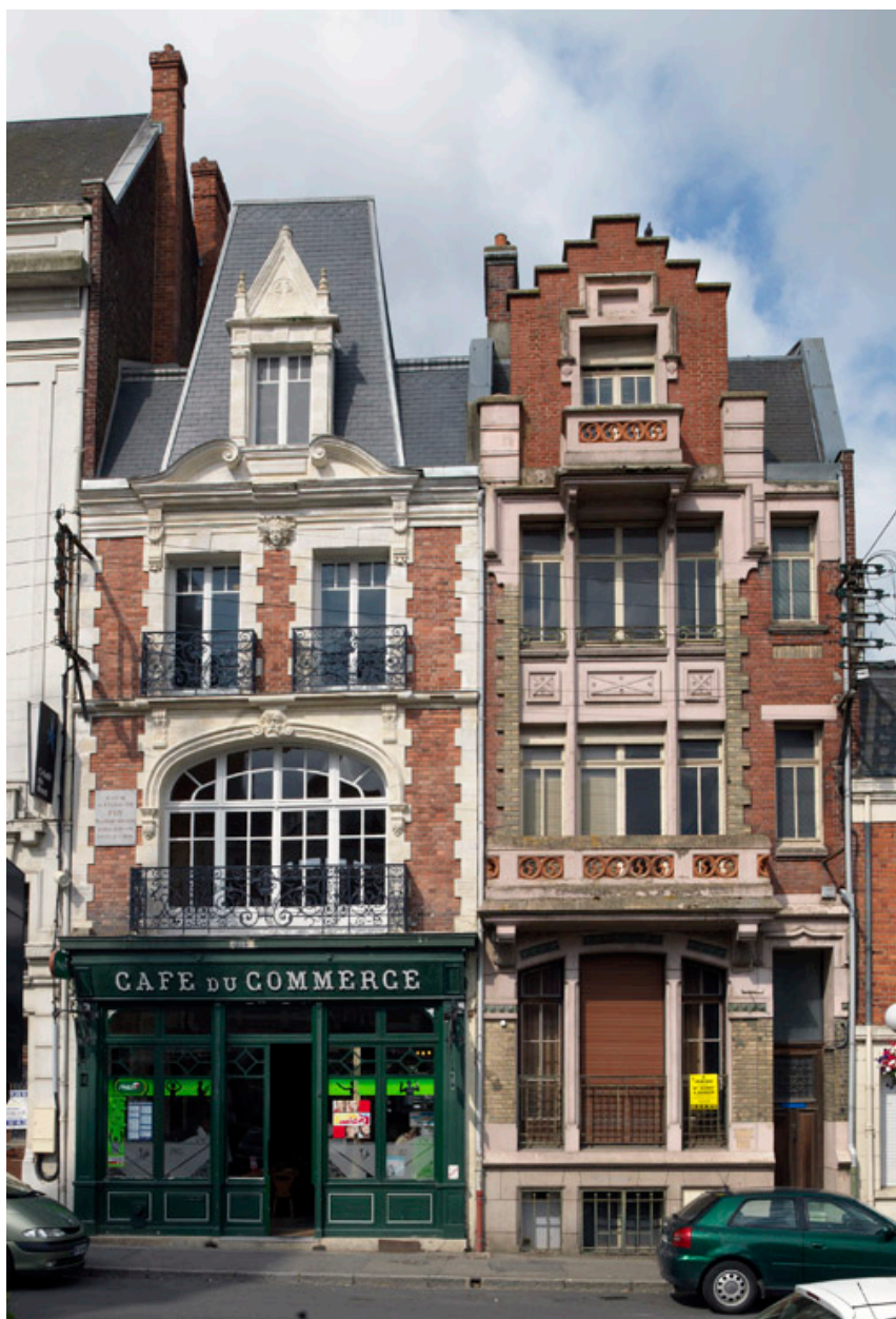
Maisons, 4 et 6 place de l'Hôtel-de-Ville. Au n°4 : Brassart-Mariage (agence d'architecture), Bompar (entrepreneur), datée 1926. Au n° 6 : maison natale du Général Foy (reconstruite), T. Carcaud père et fils (architectes), 1924.