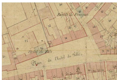
Extrait du cadastre de 1826 (AD Somme). IVR22_20158006207NUCA