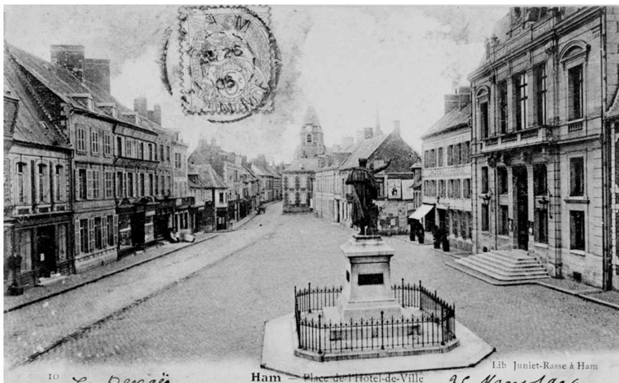
Ham. Place de l'Hôtel-de-Ville, Lib. Juniet-Rasse à Ham, carte postale, début 20e siècle (coll. part.).