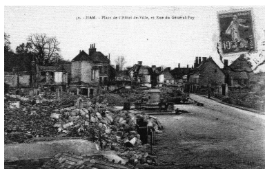
Place de l'Hôtel de Ville et Rue du Général-Foy, après les destructions de 1918.