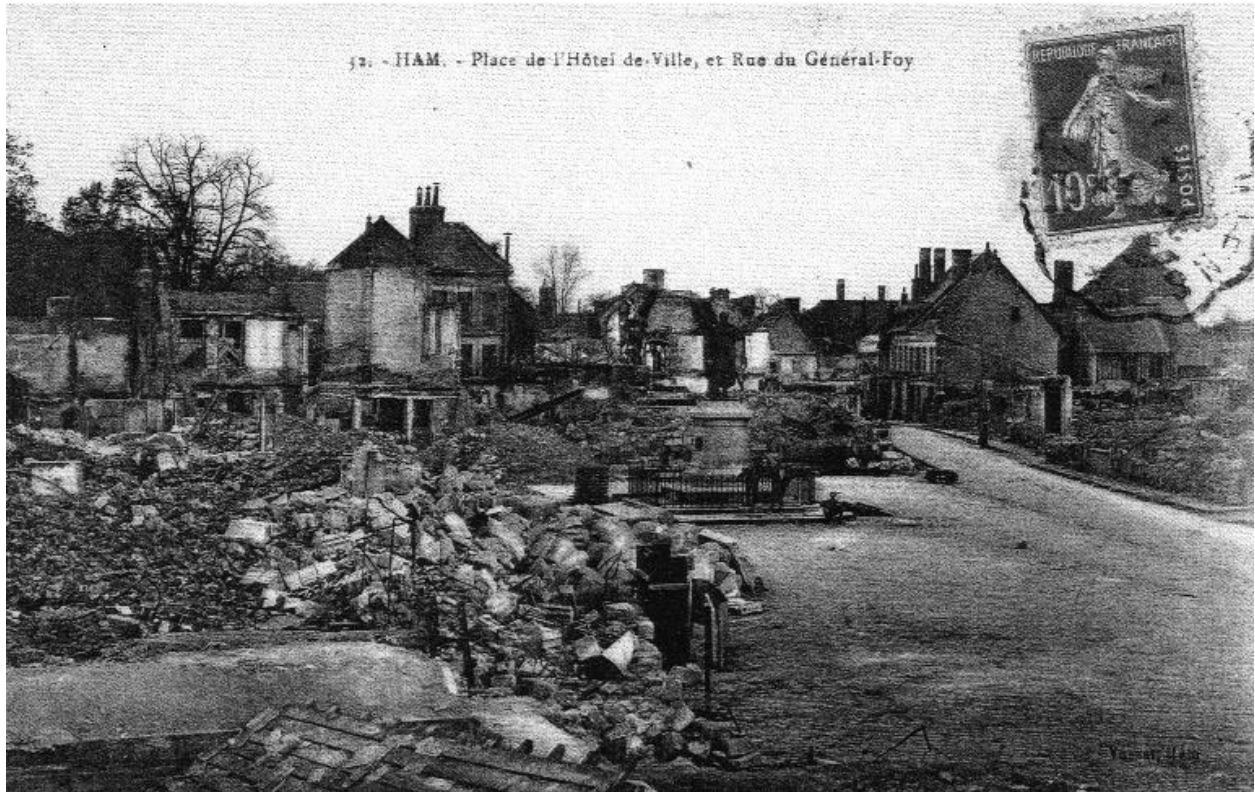
Place de l'Hôtel de Ville et Rue du Général-Foy, après les destructions de 1918.