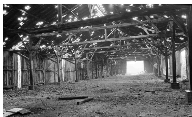
Magasin industriel : vue intérieure. IVR22_19936002450Z