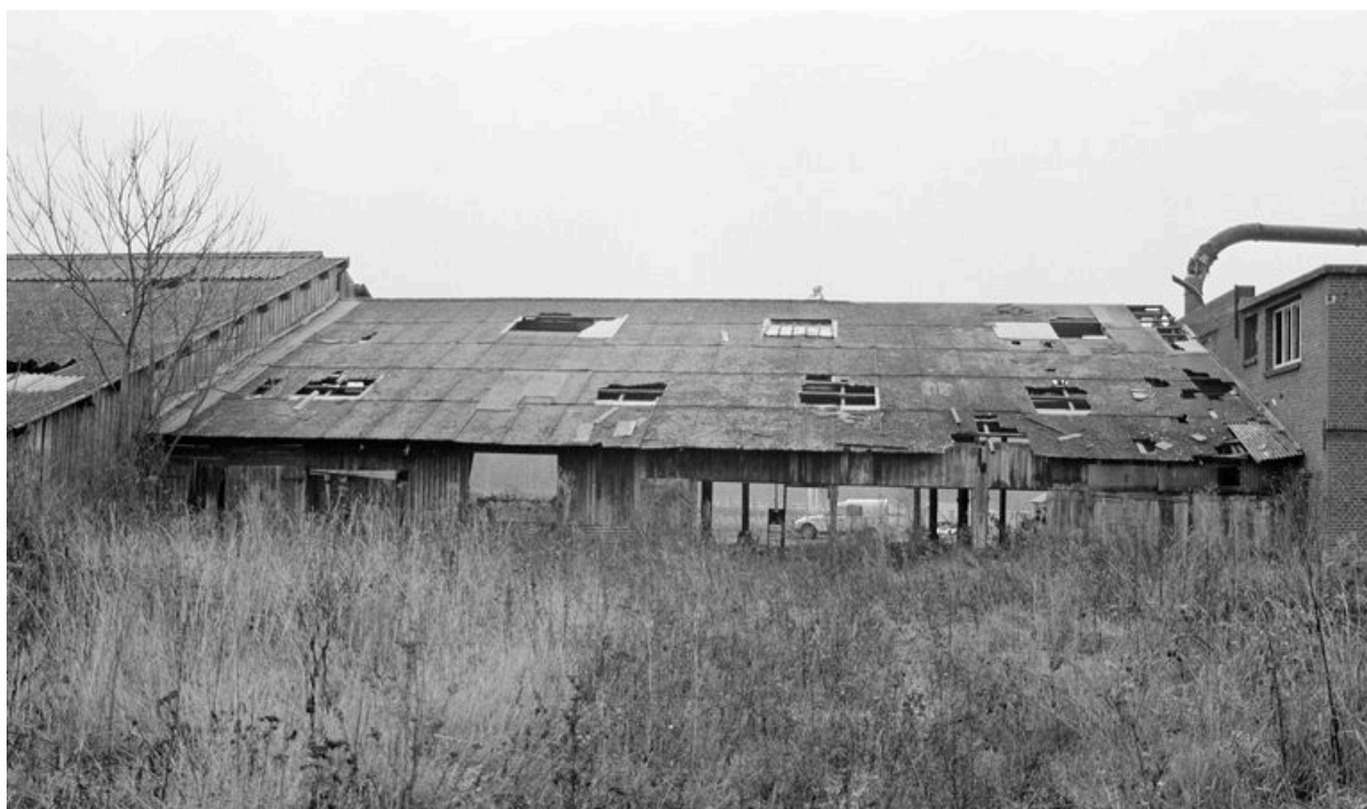
Atelier de fabrication principal.