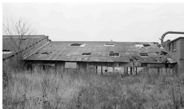
Atelier de fabrication principal. IVR22_19936002457Z