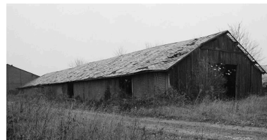
Entrepôt. IVR22_19936002451Z