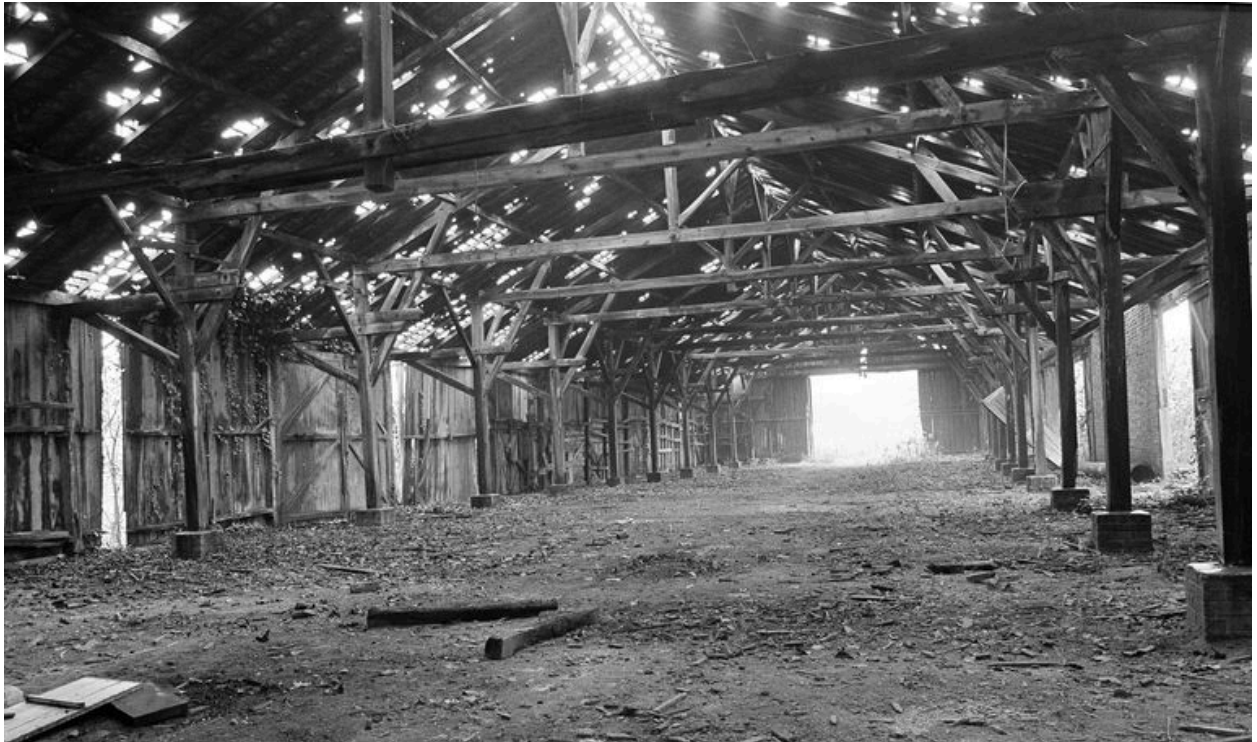
Magasin industriel : vue intérieure.