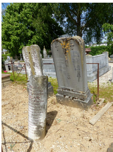
Vue des tombeaux conservés dans la concession.