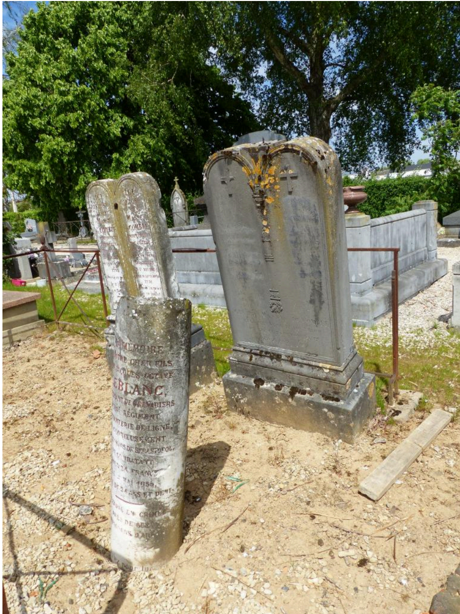
Vue des tombeaux conservés dans la concession.