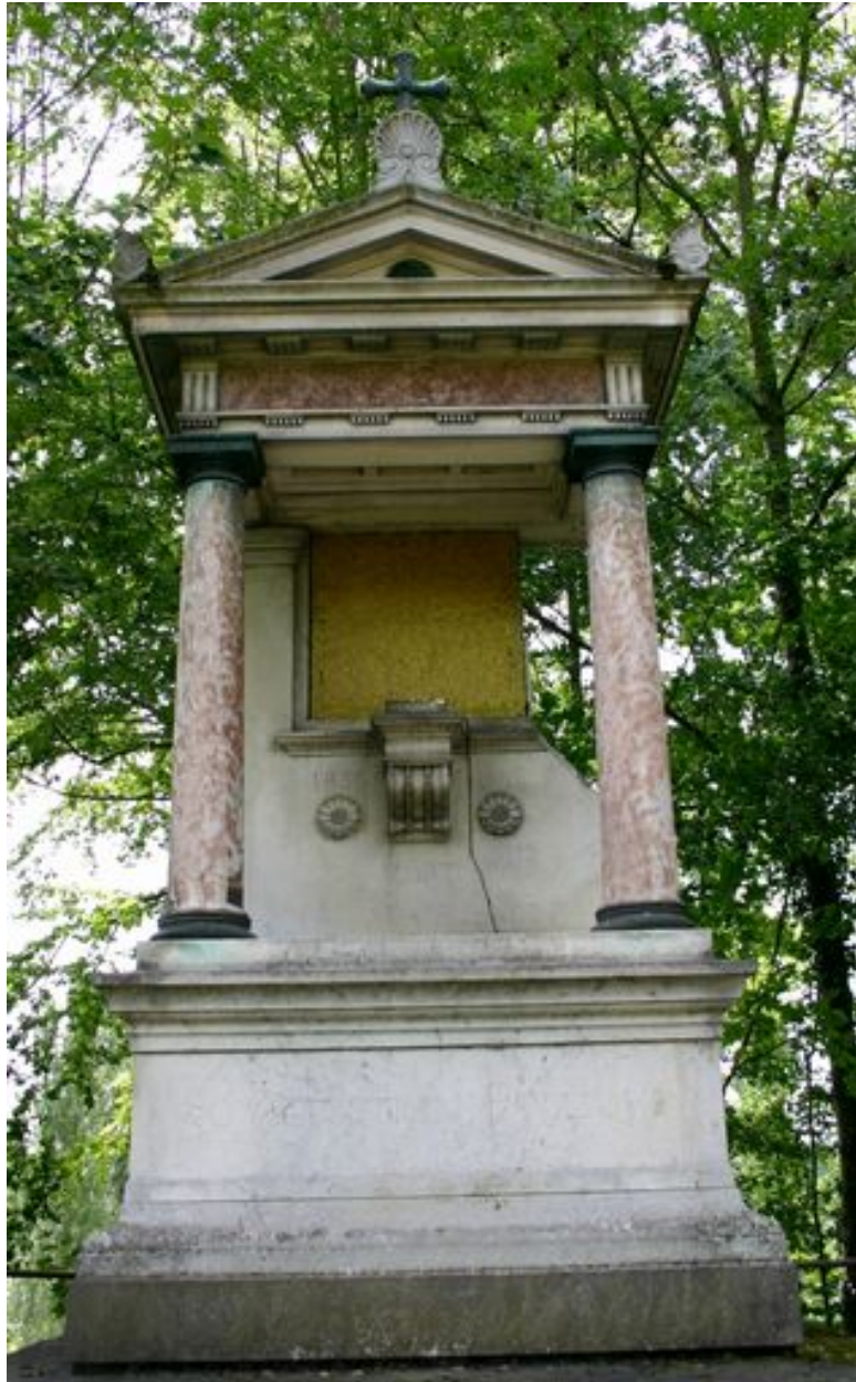
Vue rapprochée du tombeau-monument.