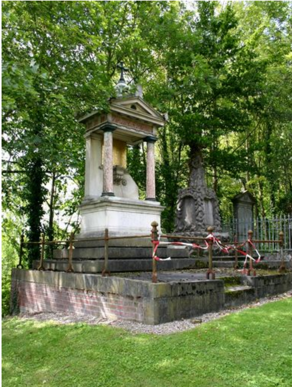
Vue générale, depuis la gauche.