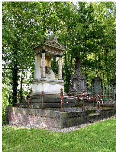
Vue générale, depuis la gauche. IVR22_20078000965NUCA