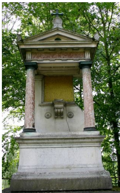
Vue rapprochée du tombeau-monument. IVR22_20078000968NUCA