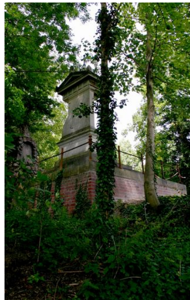
Vue générale de la face postérieure du tombeau-monument.