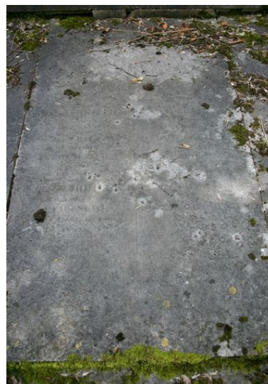
Dalle fermant le caveau et sur laquelle sont gravées les épitaphes des défunts de la famille.