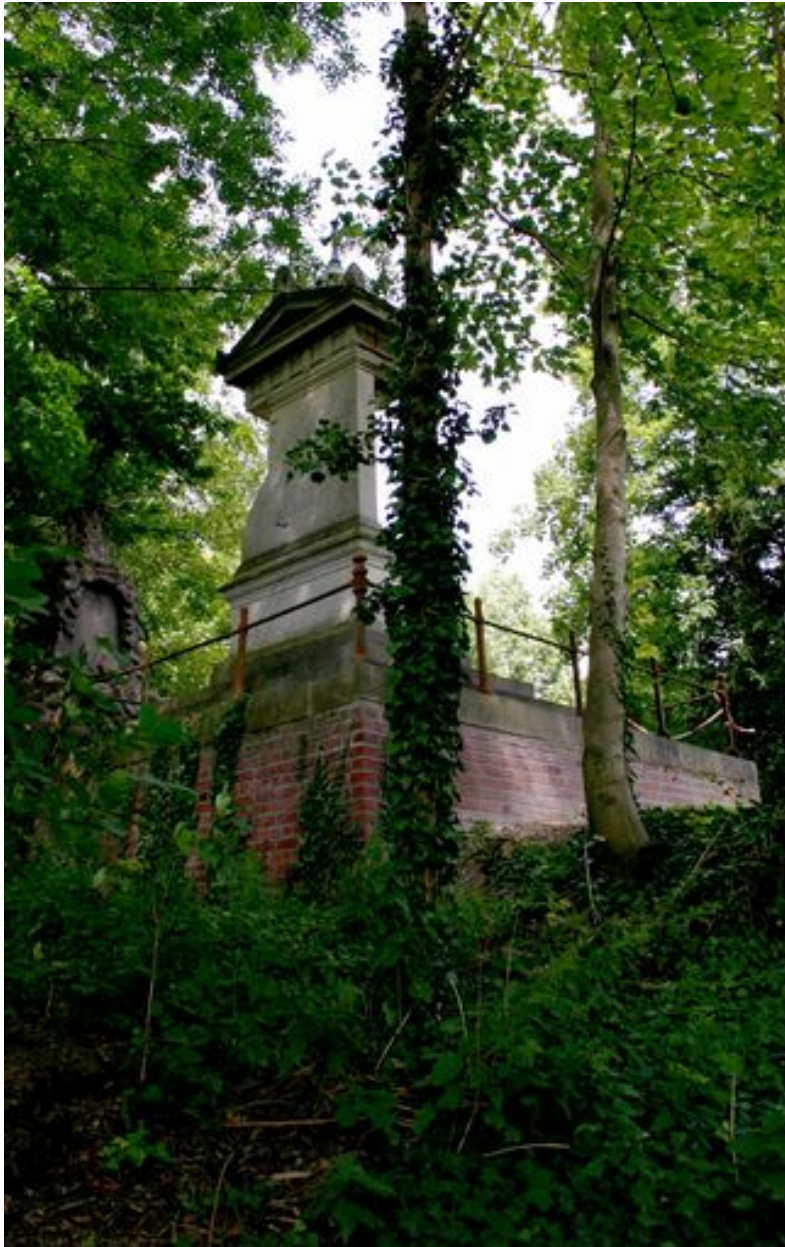
Vue générale de la face postérieure du tombeau-monument.