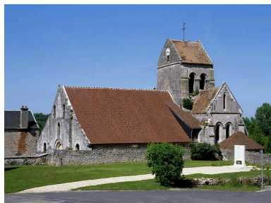
Vue générale, depuis le sud-ouest. IVR22_20050201675XA