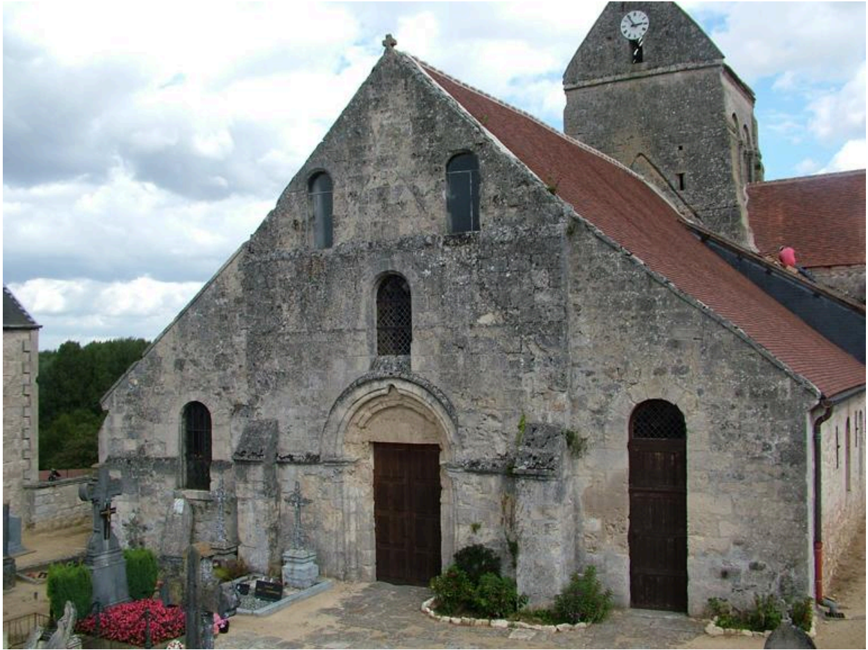
Vue générale de l'élévation occidentale.