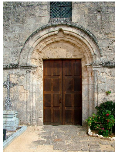
Vue du portail occidental. IVR22_20040202966NUC1A