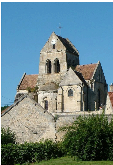
Vue générale, depuis l'est. IVR32_20170200442NUC1A