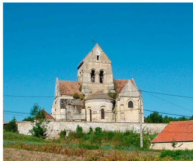
Vue d'ensemble. IVR22_20040202961NUC1A