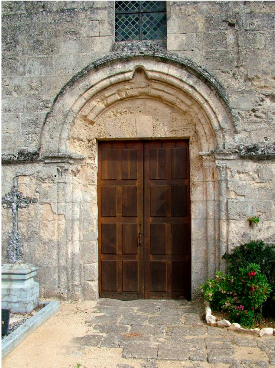
Vue du portail occidental.