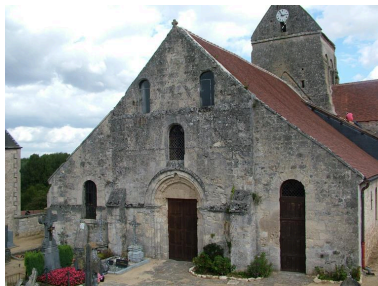
Vue générale de l'élévation occidentale.