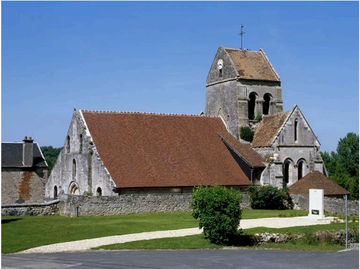
Vue générale, depuis le sud-ouest.