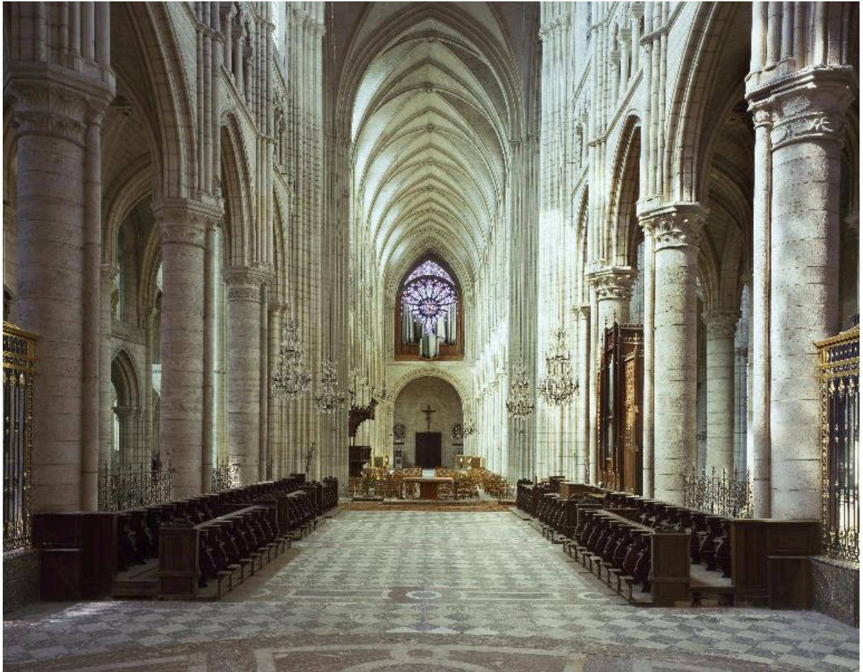
Vue du pavement du chœur.