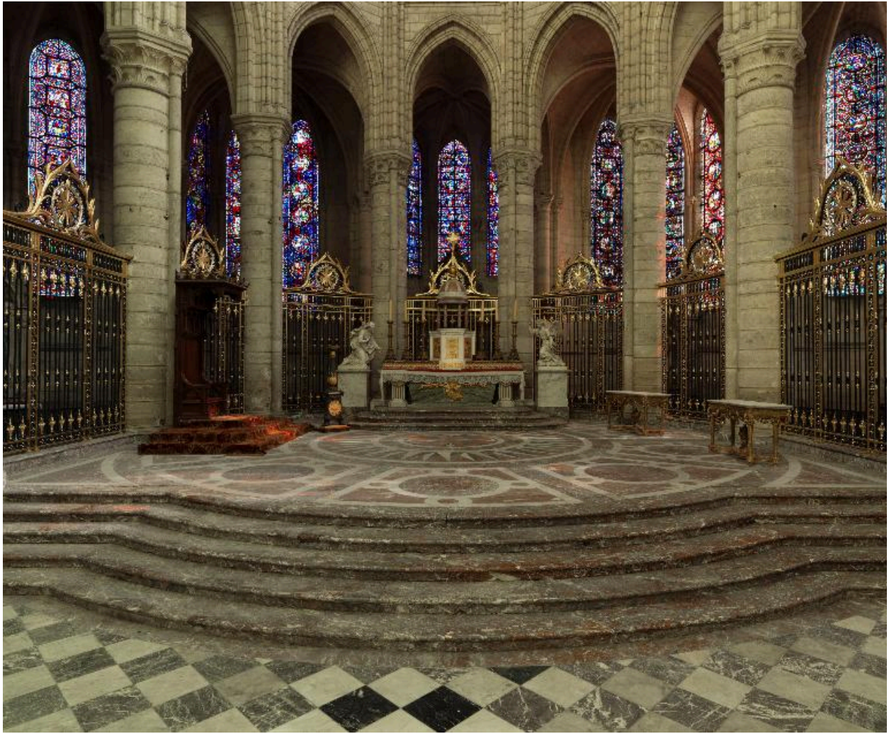
Vue actuelle du sanctuaire.