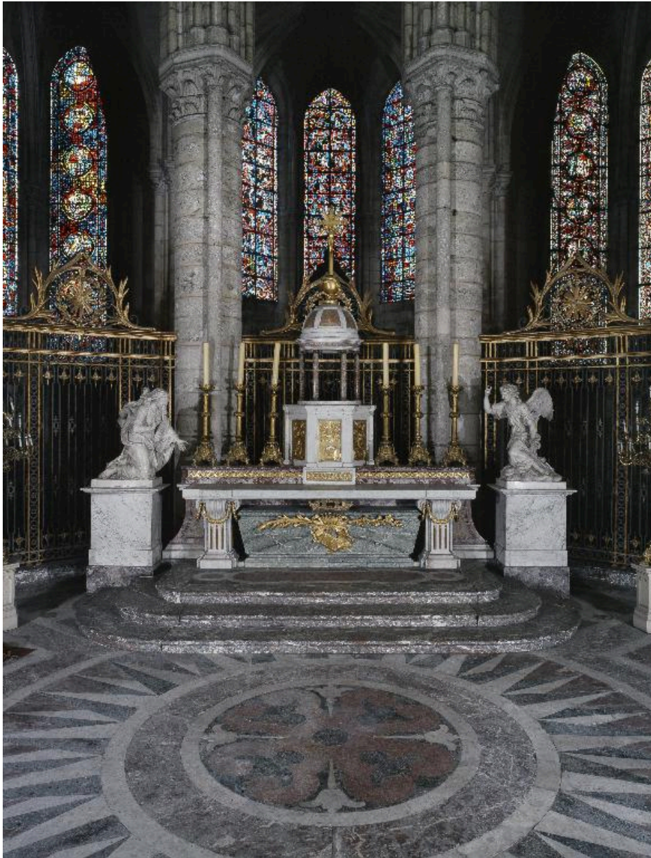
Détail du pavement du sanctuaire.