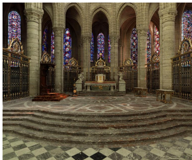
Vue actuelle du sanctuaire. IVR22_20130200018NUC2A