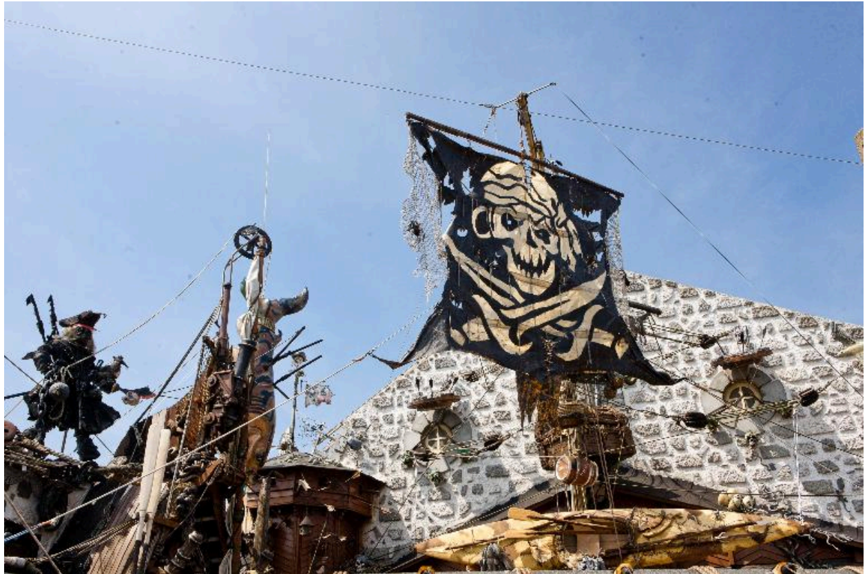
L'installation d'un anonyme dans la région de Dunkerque.