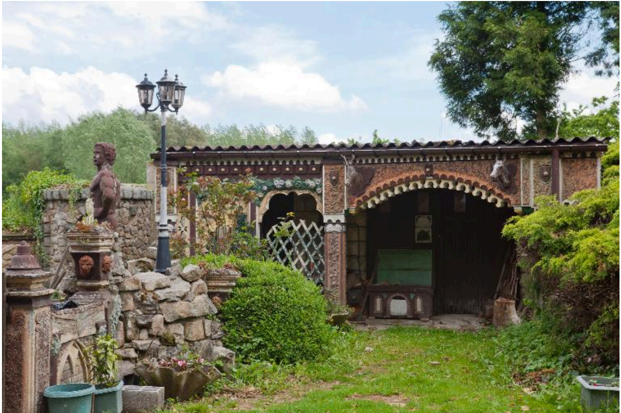
Le jardin d'un anonyme dans le région de Marchiennes.