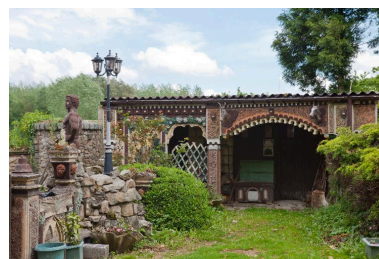
Le jardin d'un anonyme dans le région de Marchiennes. IVR31_20145902888NUC4A