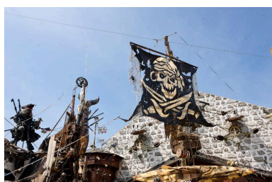
L'installation d'un anonyme dans la région de Dunkerque.