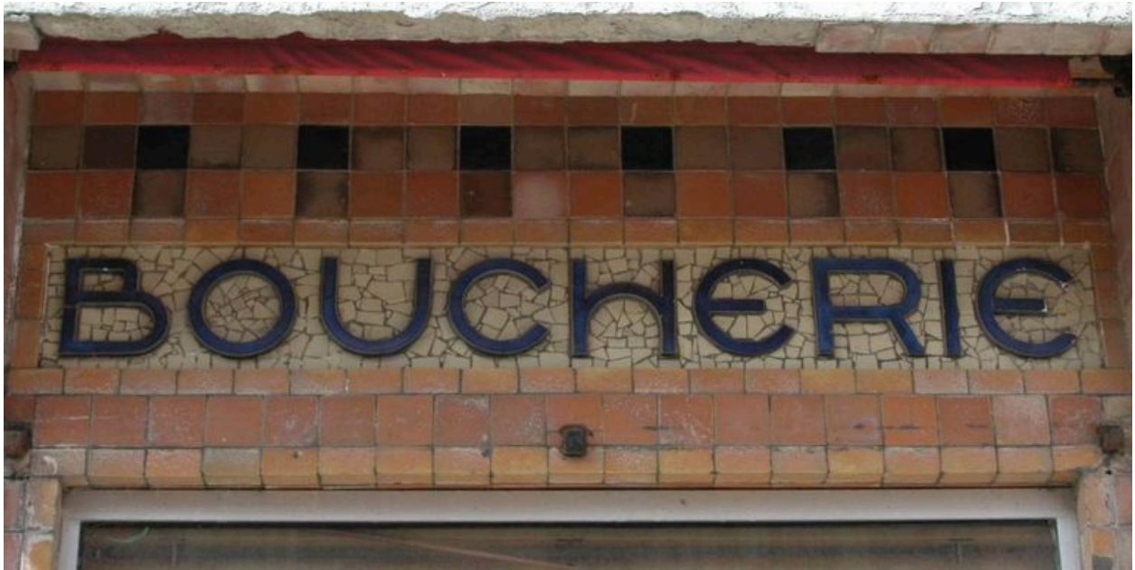
Détail de la mosaïque portant dénomination de l'édifice.