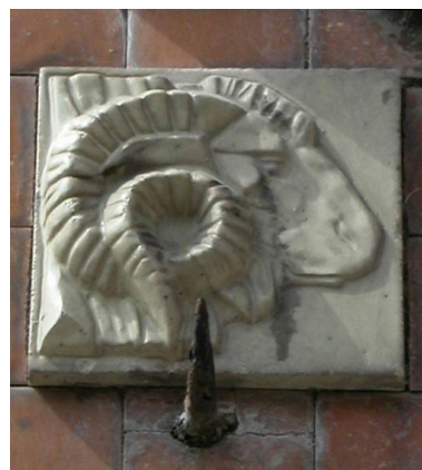
Détail du carreau de céramique figurant un bélier.