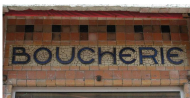
Détail de la mosaïque portant dénomination de l'édifice.