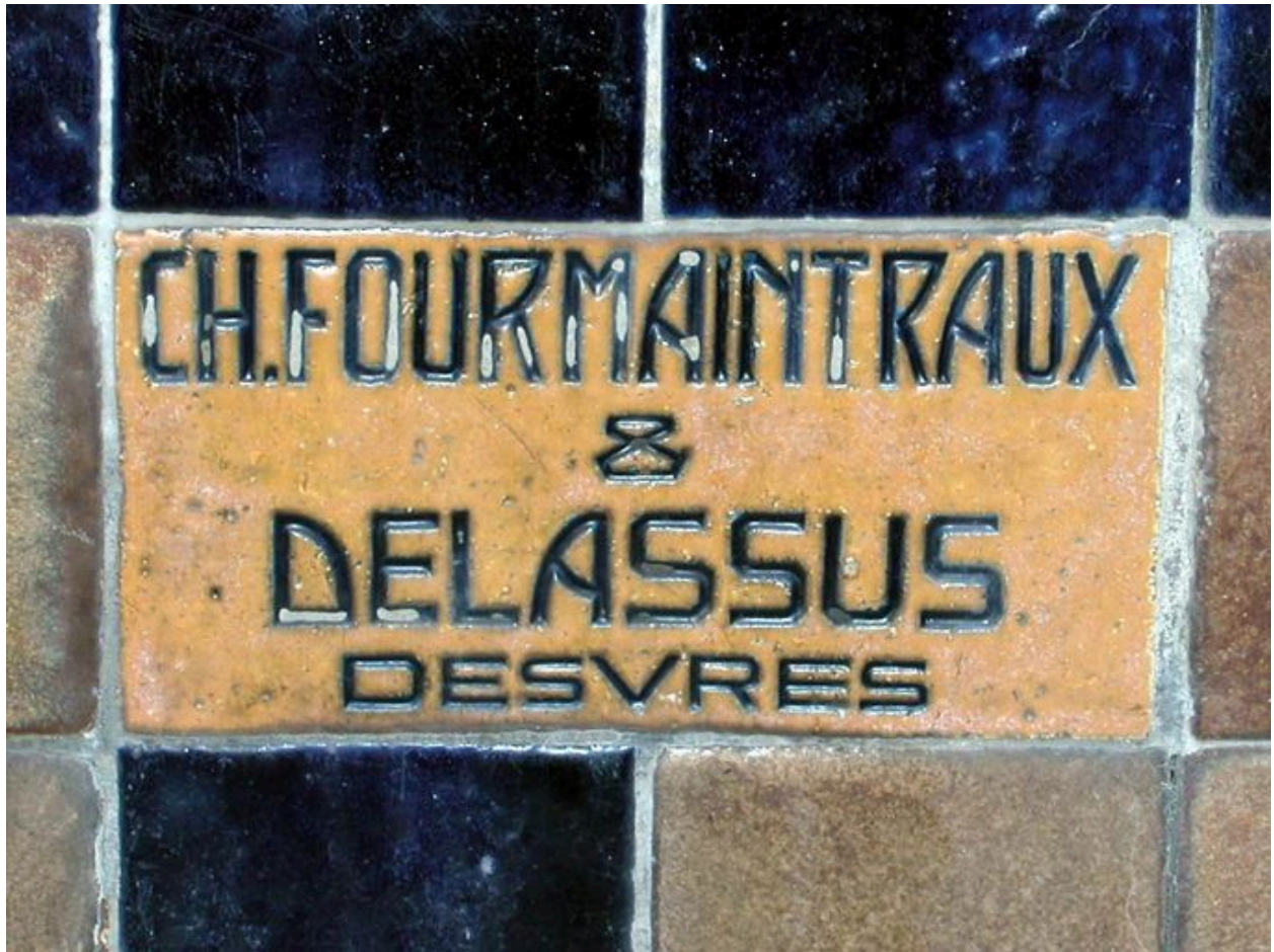
Détail du carreau de céramique portant signature du décor porté.