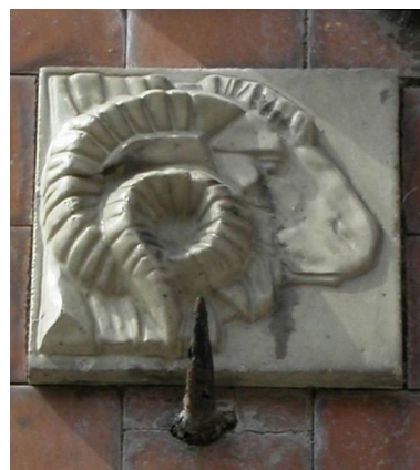
Détail du carreau de céramique figurant un bélier. IVR22_20038005372NUCA