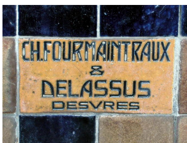
Détail du carreau de céramique portant signature du décor porté. IVR22_20038005374NUCA