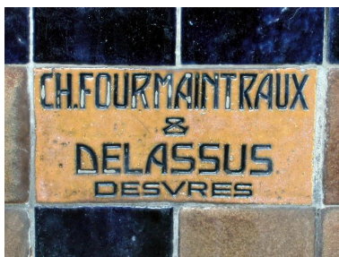
Détail du carreau de céramique portant signature du décor porté. IVR22_20038005374NUCA