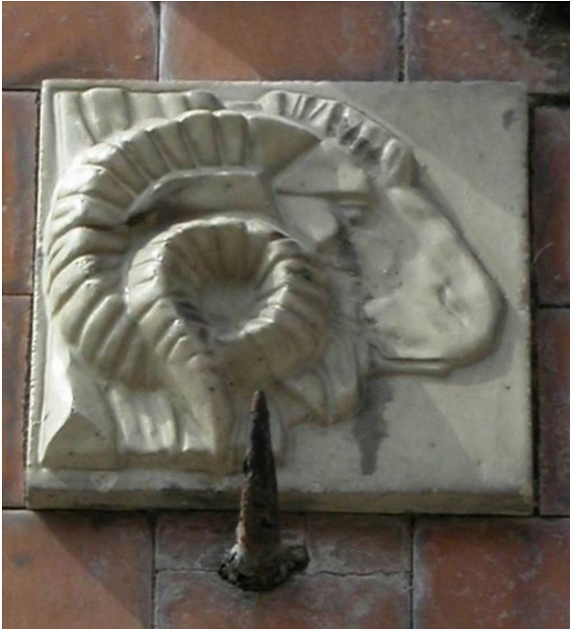
Détail du carreau de céramique figurant un bélier.