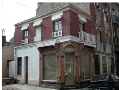
Vue d'ensemble. IVR22_20038005370NUCA