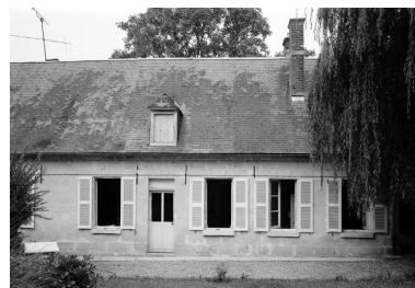
Elévation postérieure.