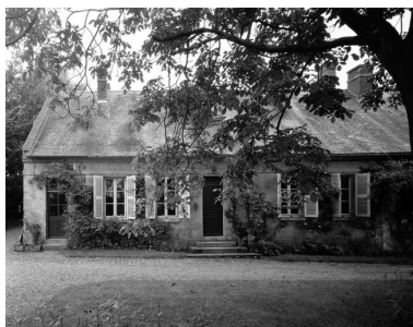
Elévation antérieure. IVR22_19846001114V