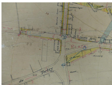
La première église localisée sur le plan d'alignement et d'embellissement de Tergnier (AC Tergnier).