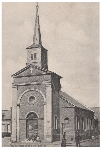
Tergnier. L'ancienne église (coll. part.).