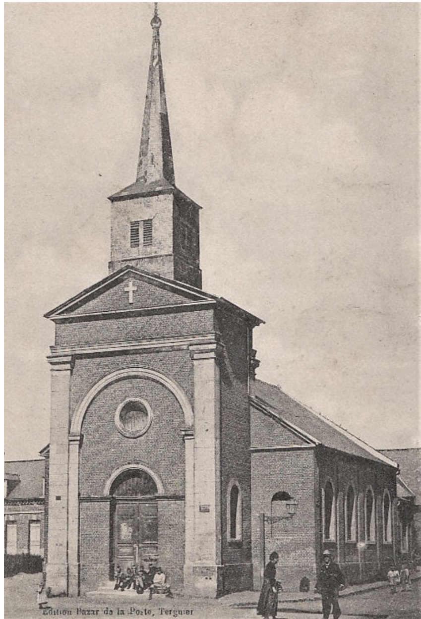
Tergnier. L'ancienne église (coll. part.).