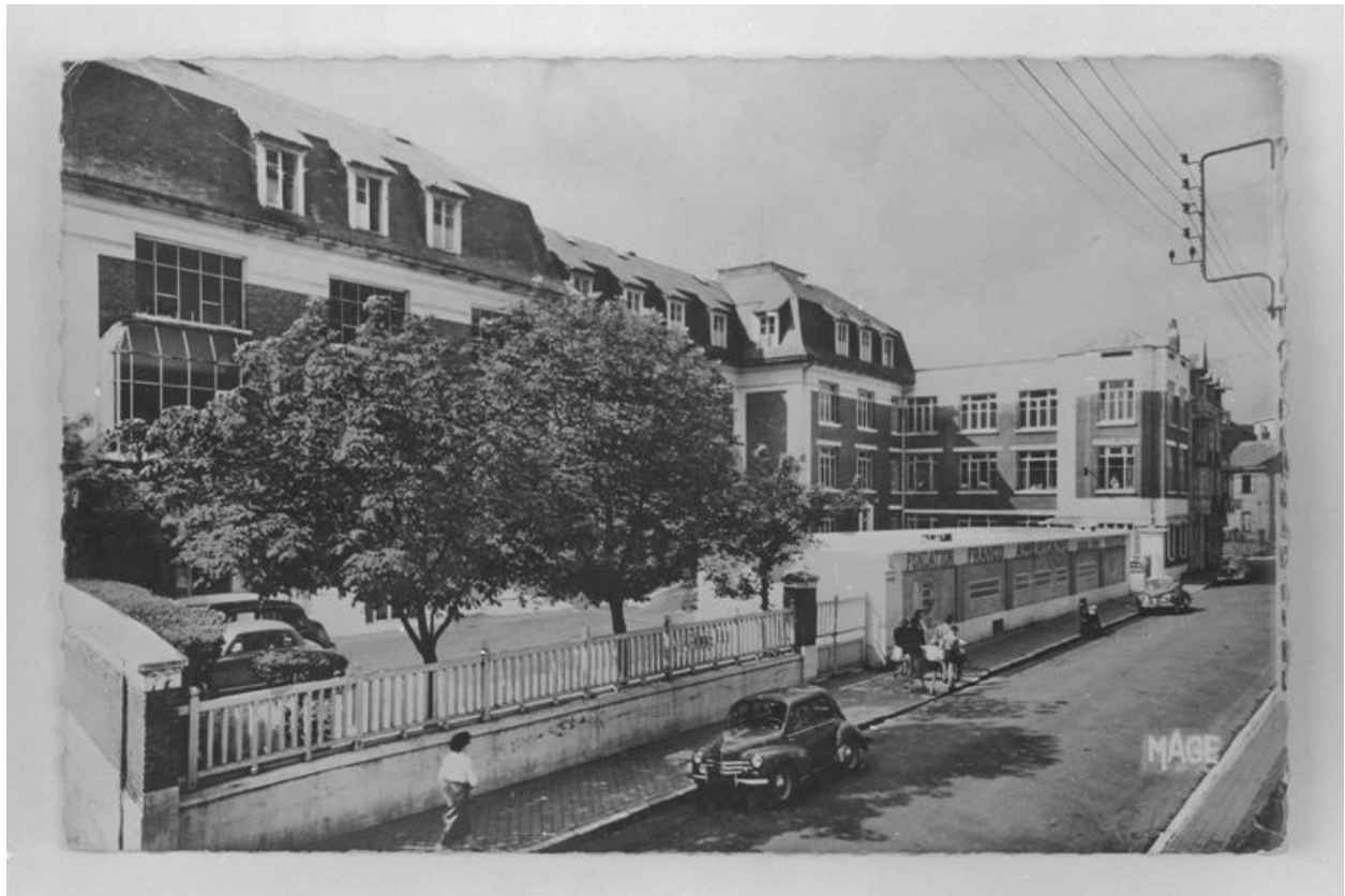
Elévation antérieure, vue générale prise de trois-quarts gauche. Carte postale, vers 1925.