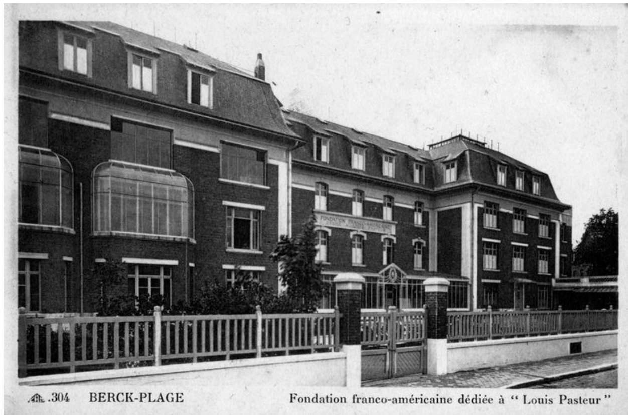
Elévation antérieure, vue générale prise de trois-quarts gauche. Carte postale, vers 1925.