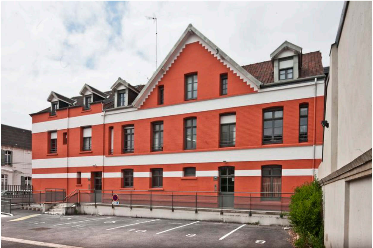
Vue générale de l'élévation postérieure de l'édifice donnant sur la rue Victor-Ménard.