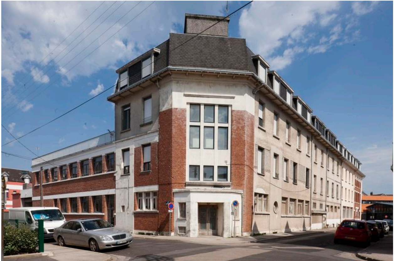
Vue générale de la partie de l'école située à l'angle de la rue Trigoulet et Arthur-Becquart.