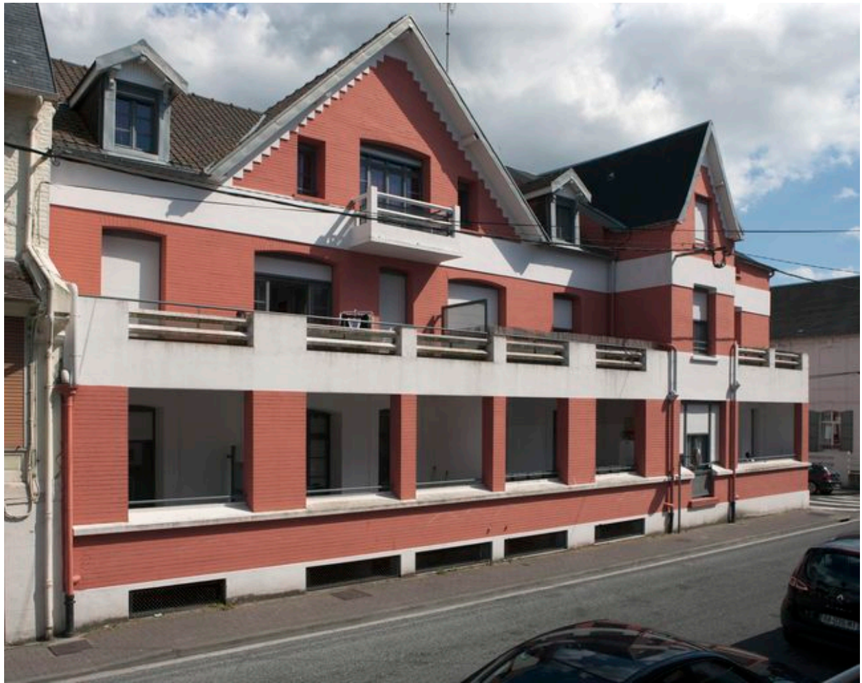
Vue générale de la façade rue Victor-Ménard.