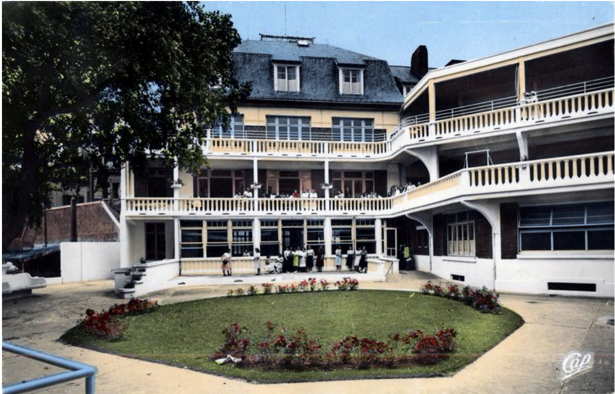
Elévations sur la cour avec leurs galeries de cure pour les pensionnaires, vue d'ensemble. Carte postale.