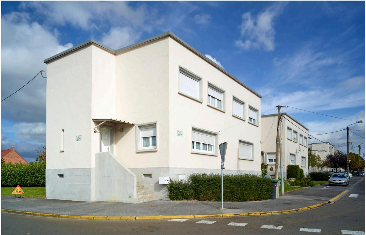
Vue des pavillons situés aux extrémités de l'opération (bloc C), prise depuis la rue.