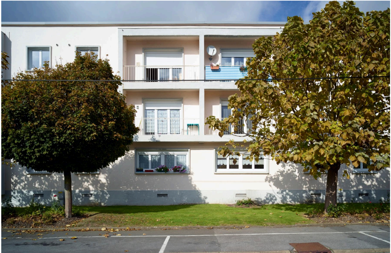
Vue du bloc A côté rue.