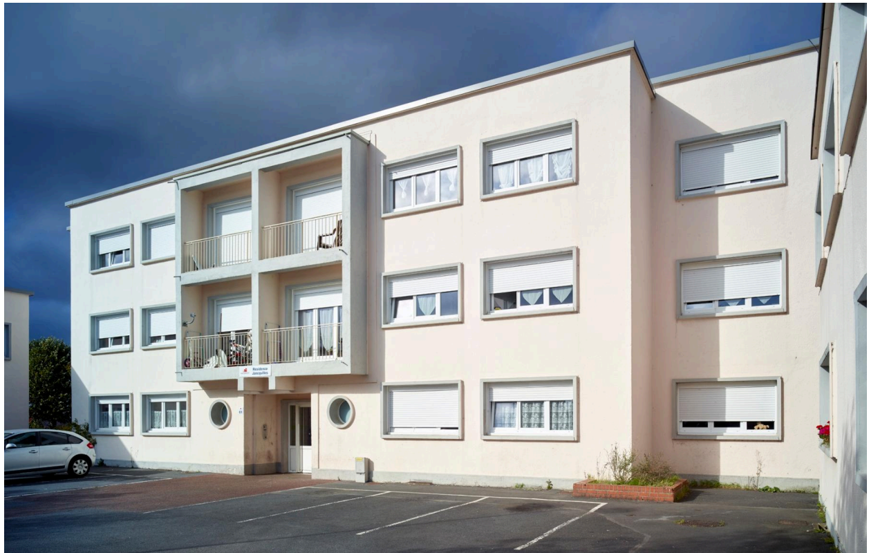
Dispositif d'entrée actuel du bloc A.