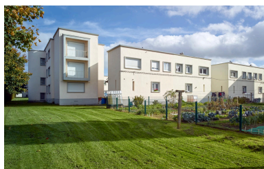
Vue générale de la frange nord de l'opération, initialement occupée par des clapiers et des potagers, aujourd'hui espace vert sans usage particulier. IVR32_20205900005NUCA