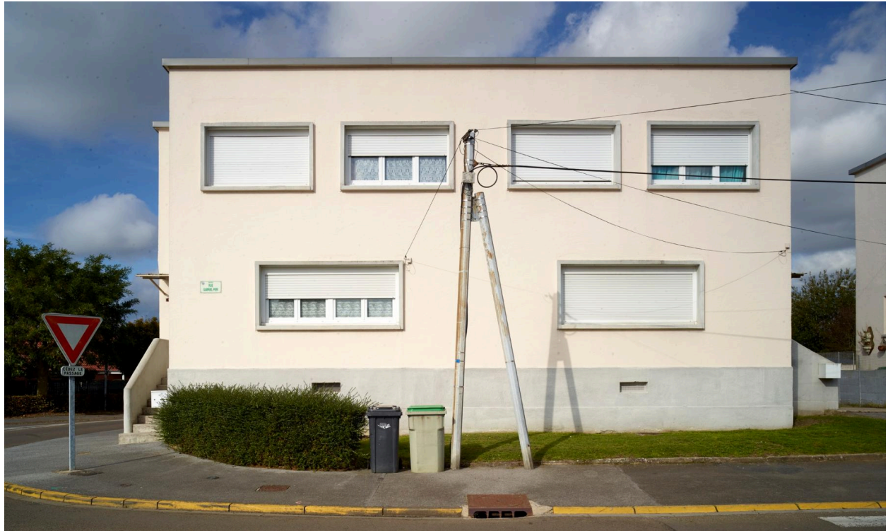
Vue des pavillons situés aux extrémités de l'opération (bloc C), prise depuis la rue.