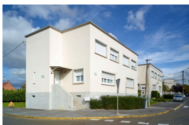
Vue des pavillons situés aux extrémités de l'opération (bloc C), prise depuis la rue.