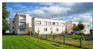
Vue générale de la frange nord de l'opération, initialement occupée par des clapiers et des potagers, aujourd'hui espace vert sans usage particulier.