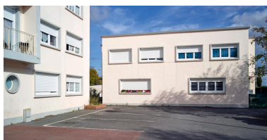
Immeuble collectif et pavillon individuel.