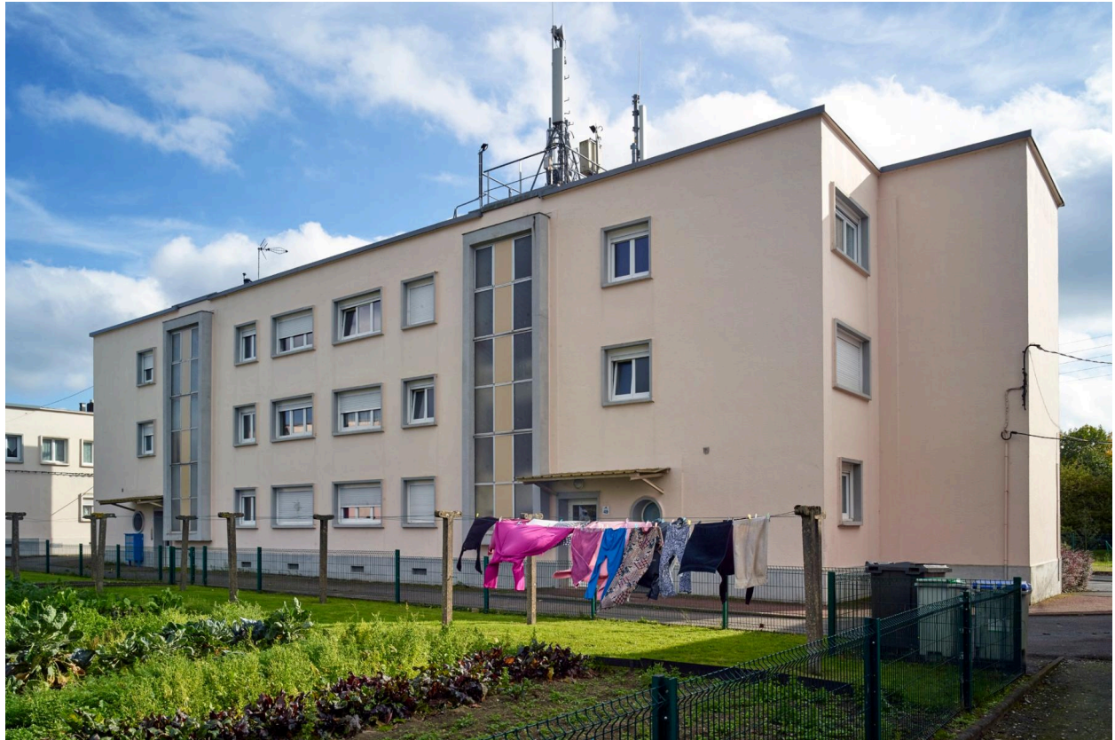
Vue du bloc B côté jardin.