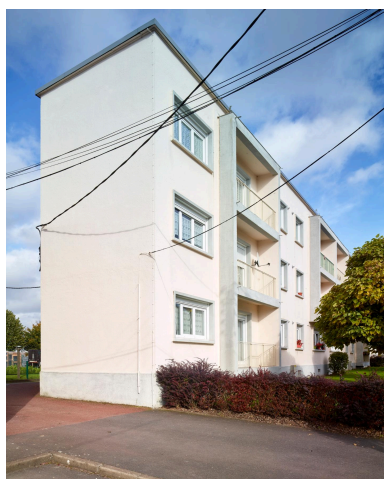
Vue du bloc A côté rue. IVR32_20205900015NUCA