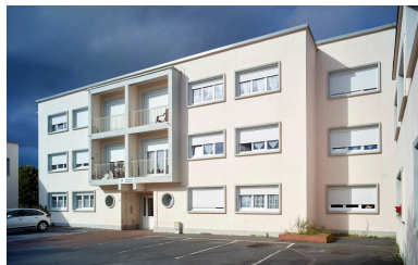
Dispositif d'entrée actuel du bloc A.