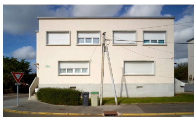
Vue des pavillons situés aux extrémités de l'opération (bloc C), prise depuis la rue. IVR32_20205900004NUCA