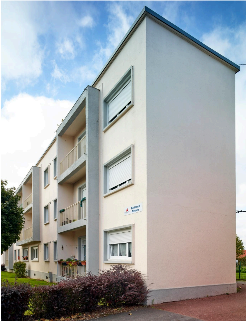
Vue du bloc A côté rue.