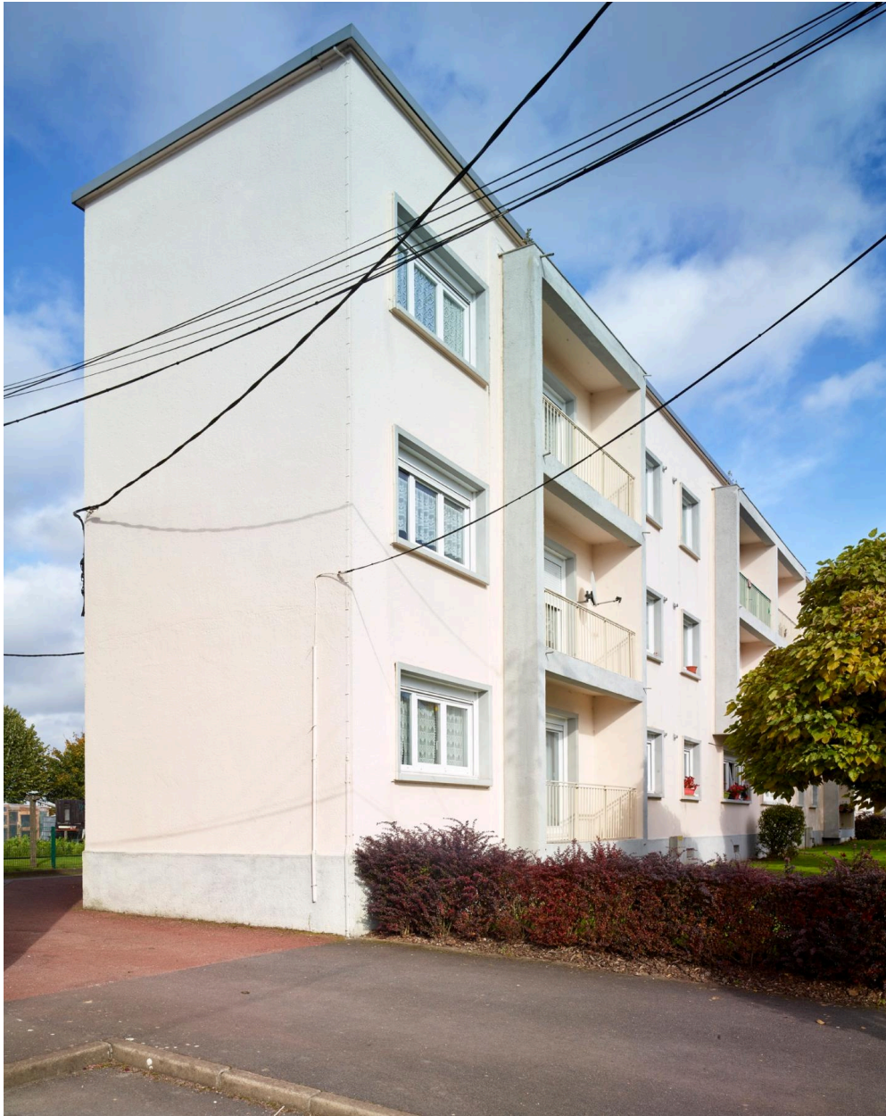
Vue du bloc A côté rue.