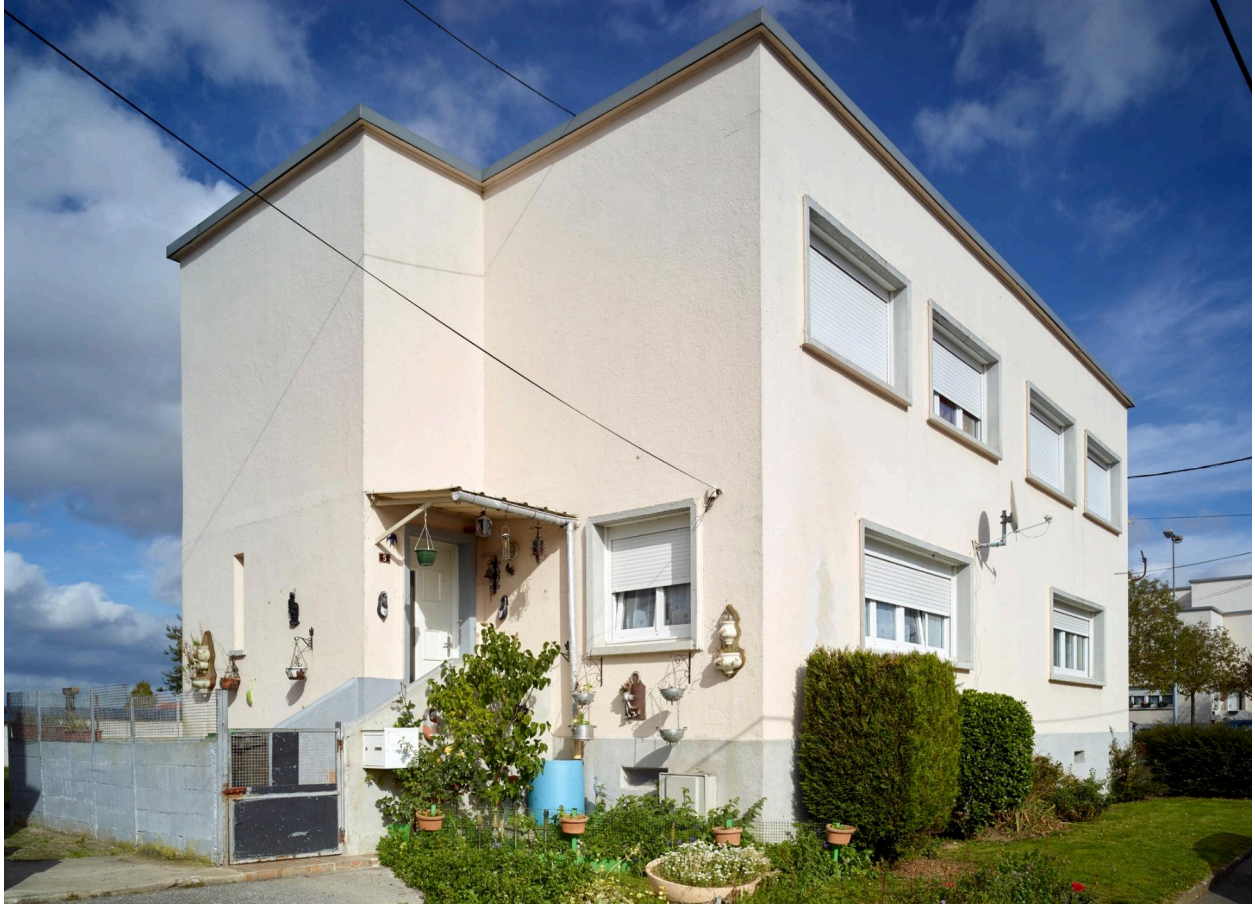
Vue des pavillons situés aux extrémités de l'opération (bloc C) prise depuis la rue.