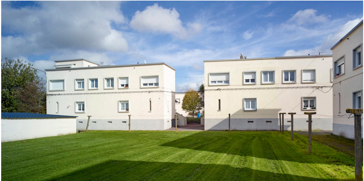
Vue arrière des pavillons, prise depuis les jardins.