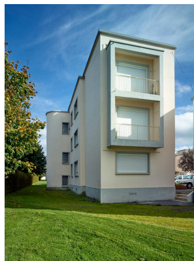
Vue latérale d'un immeuble collectif. IVR32_20205900006NUCA