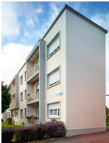
Vue du bloc A côté rue. IVR32_20205900013NUCA