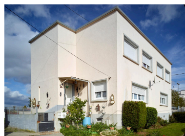
Vue des pavillons situés aux extrémités de l'opération (bloc C) prise depuis la rue. IVR32_20205900002NUCA