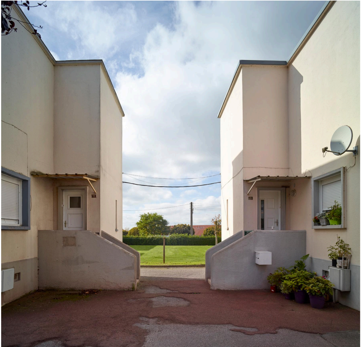
Accès aux blocs C.