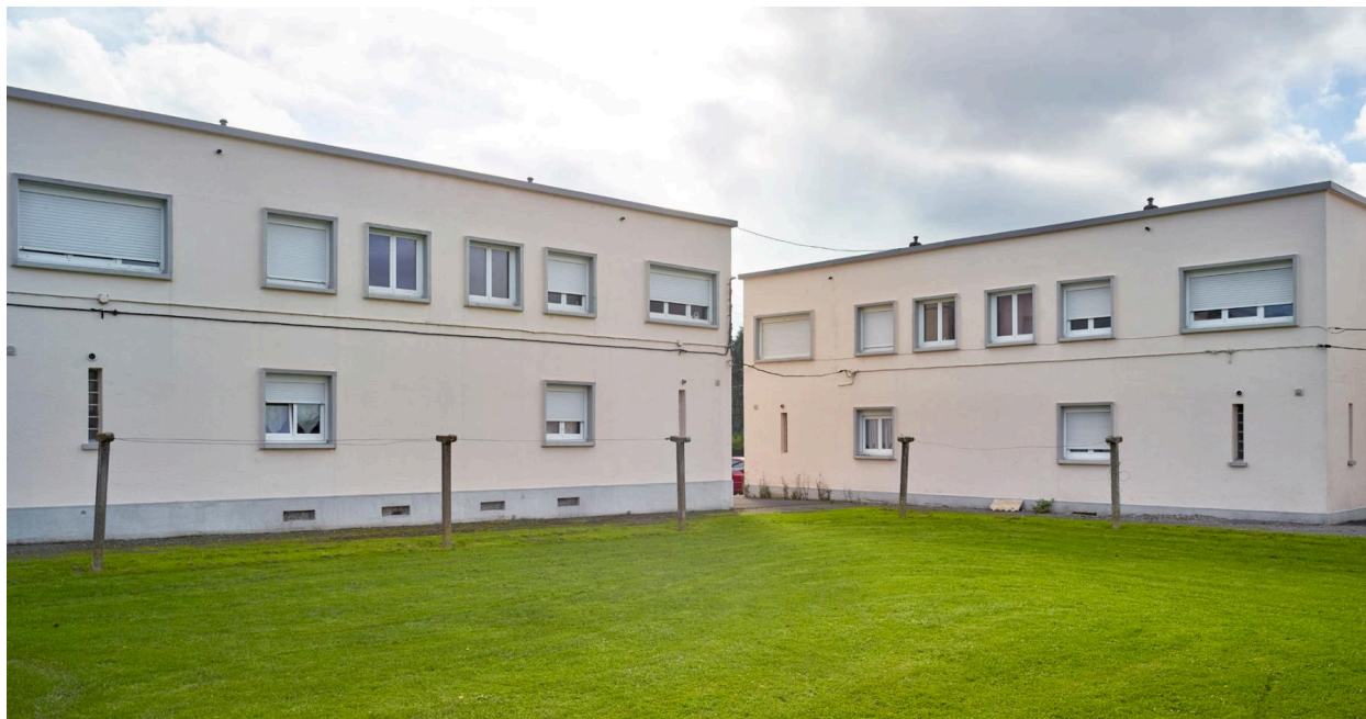
Vue arrière des pavillons, prise depuis les jardins.