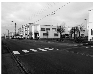
Vue générale de l'articulation rue-place. IVR31_20025900378X