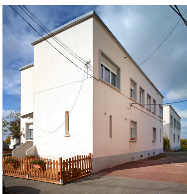
Vue du bloc A côté rue.