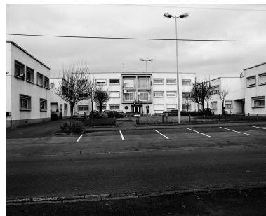
Vue générale d'une place : pavillons (à gauche et à droite) et immeuble collectif (dans le fond). IVR31_20025900377X