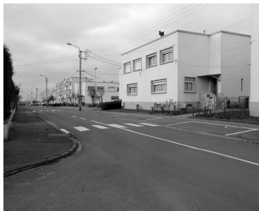
Vue générale depuis la rue (sud).