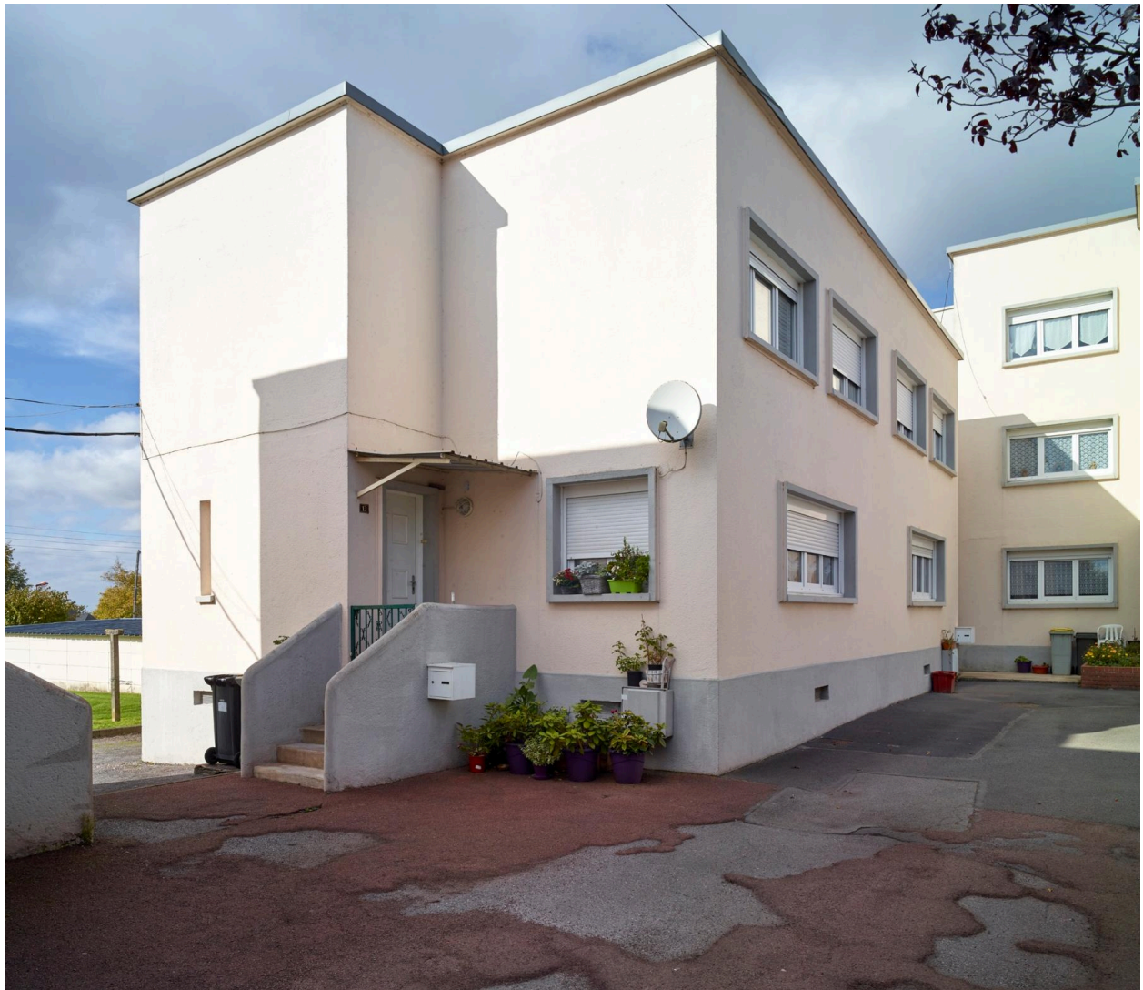
Accès aux blocs C.