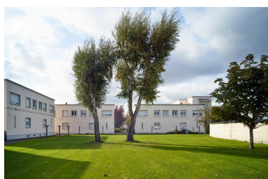
Vue arrière des pavillons, prise depuis les jardins.