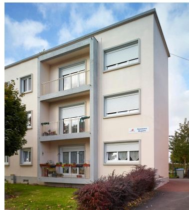
Vue du bloc A côté rue. IVR32_20205900014NUCA