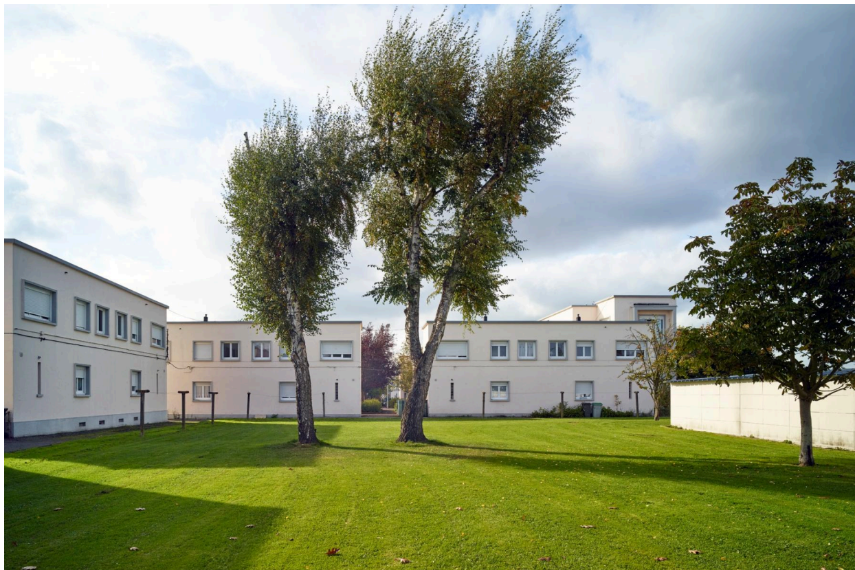
Vue arrière des pavillons, prise depuis les jardins.