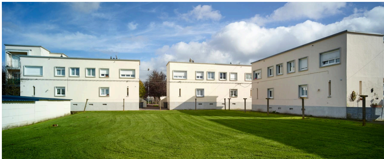
Vue arrière des pavillons, prise depuis les jardins.