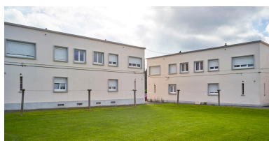
Vue arrière des pavillons, prise depuis les jardins.