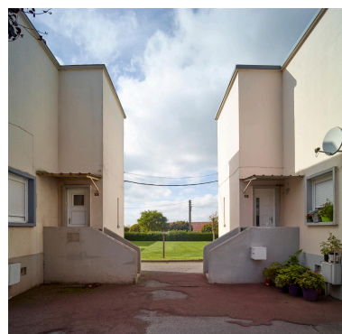
Accès aux blocs C. IVR32_20205900021NUCA