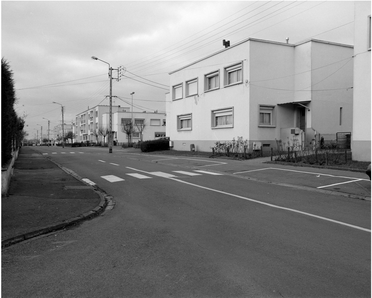
Vue générale depuis la rue (sud).