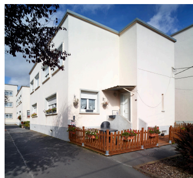
Appropriation des espaces d'entrée des pavillons par les habitants.