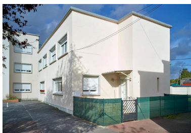
Appropriation des espaces d'entrée des pavillons par les habitants.