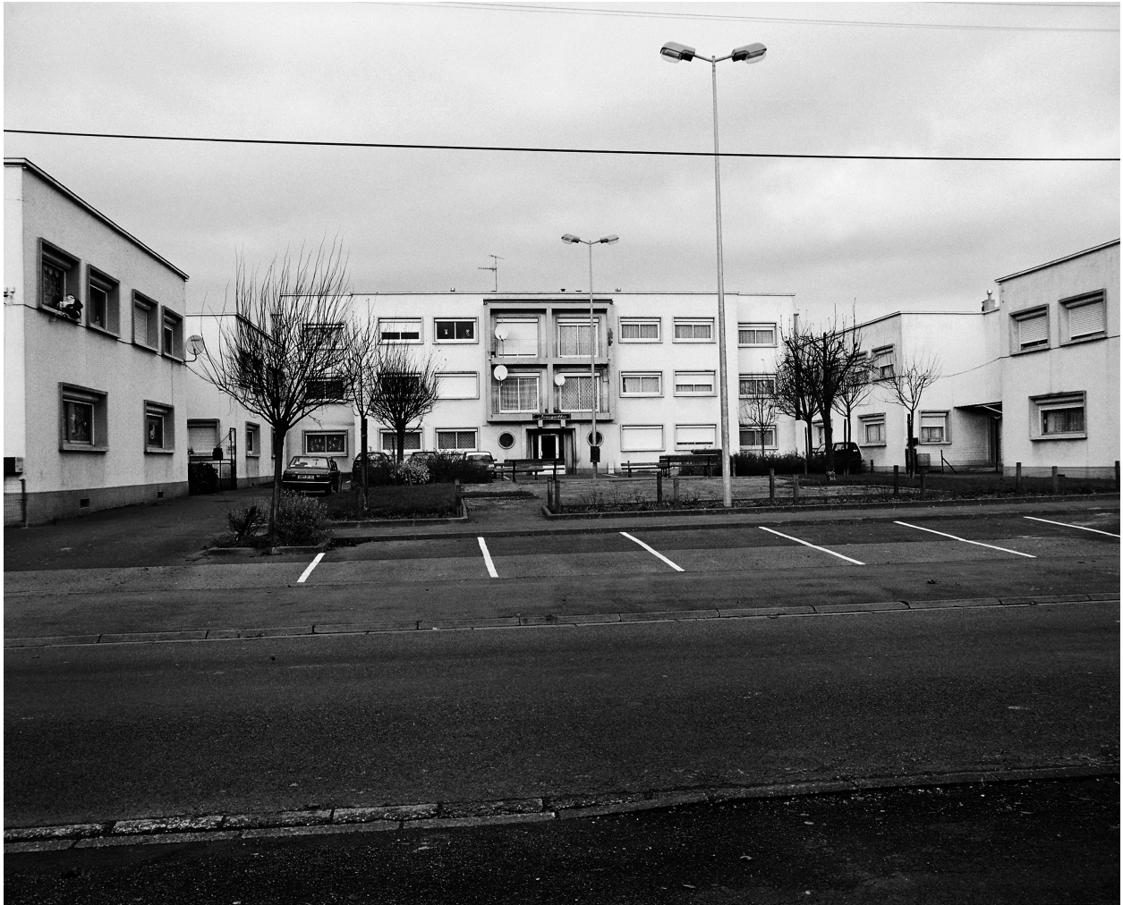
Vue générale d'une place : pavillons (à gauche et à droite) et immeuble collectif (dans le fond).