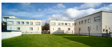
Vue arrière des pavillons, prise depuis les jardins.