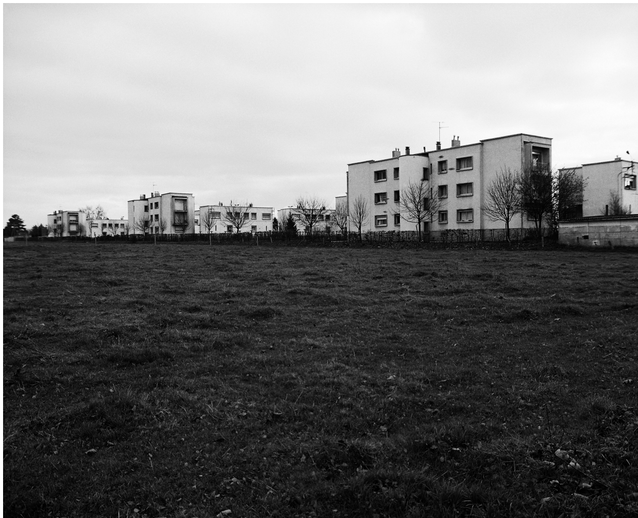
Vue générale depuis le nord.