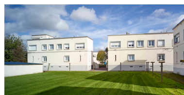
Vue arrière des pavillons, prise depuis les jardins.