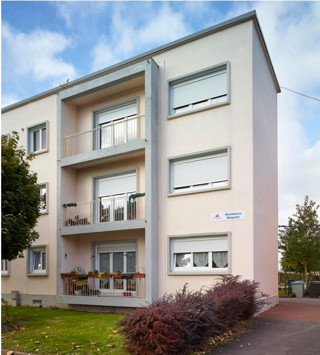
Vue du bloc A côté rue.