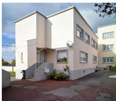
Accès aux blocs C.