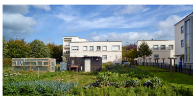
Vue générale de la frange nord de l'opération, initialement occupée par des clapiers et des potagers, aujourd'hui espace vert sans usage particulier.