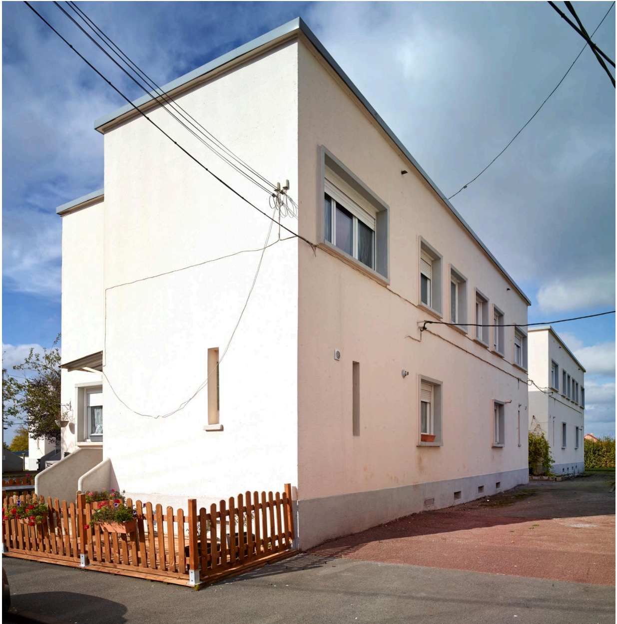
Vue arrière des pavillons, prise depuis la rue.