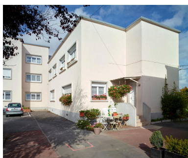
Appropriation des espaces d'entrée des pavillons par les habitants. IVR32_20205900020NUCA