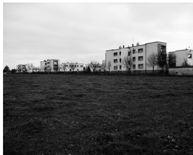
Vue générale depuis le nord. IVR31_20025900379X