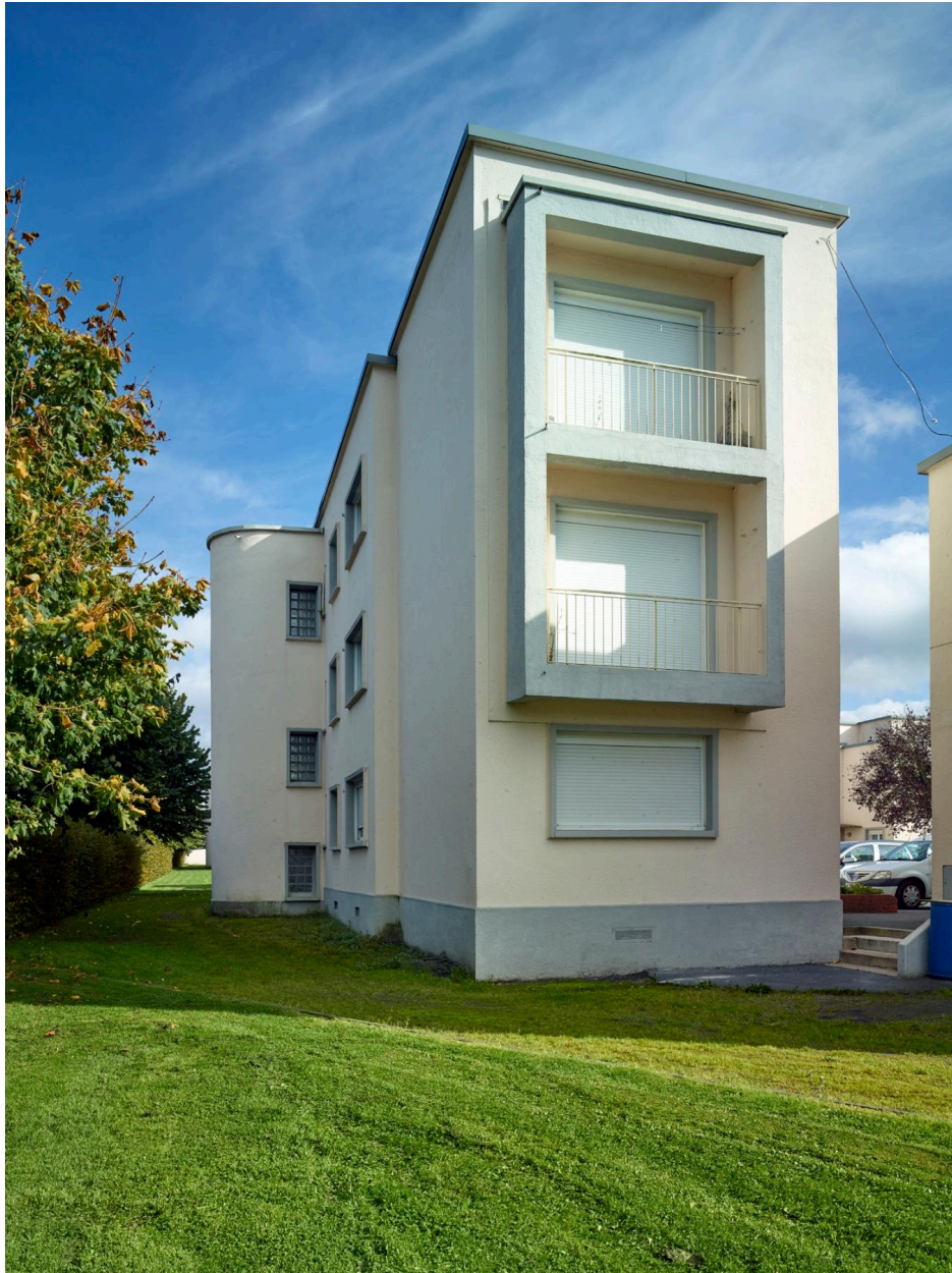
Vue latérale d'un immeuble collectif.