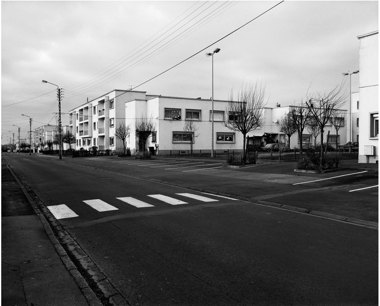
Vue générale de l'articulation rue-place.