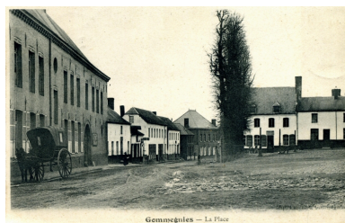
Vue de l'élévation sur rue du château, rue du Centre, près de la place du village (coll. part.).