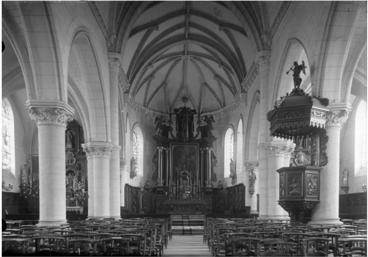
Gommegnies PH 1392

Vue de l'intérieur de l'église, entre 1894 et 1914.