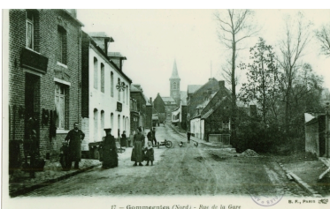
Vue de la rue de la Gare