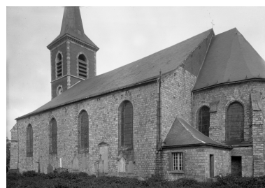
Vue extérieure des bas côtés de la nef de l'église et du cimetière, entre 1894 et 1914. IVR31_20085900251NUCB