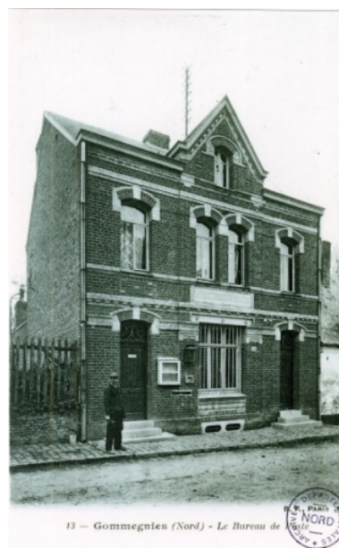
Vue de la poste