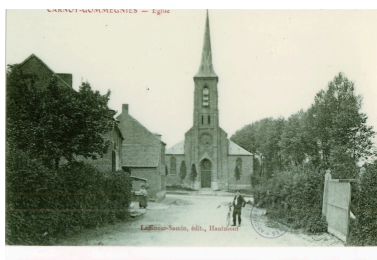
Vue de l'église de Carnoy