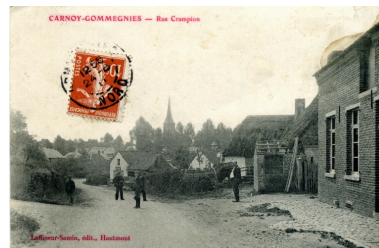
Vue de l'ancienne rue Crampion au Carnoy.