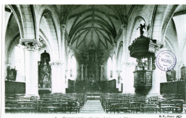
Vue intérieure de l'église