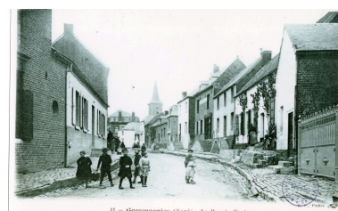
Vue de la rue du Centre