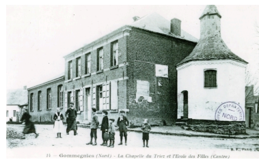
Vue de la Chapelle du Triez et de l'Ecole des Filles. IVR31_20085900102NUCB