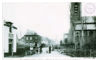
Vue de l'entrée du Carnoy au pont du Carlotieux.