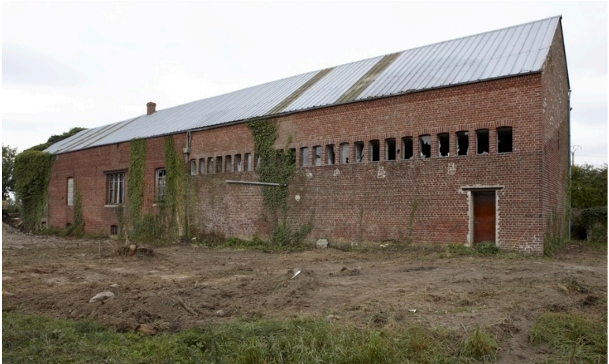
Vue générale d'une fabrique de compote et de pâtes de pomme, située rue de la Gare (logement patronal 557 rue de la gare).