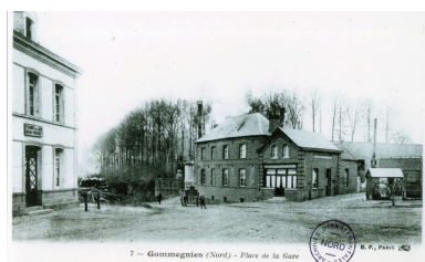
Vue de la Place de la Gare