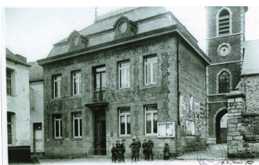
Vue de la mairie (AD Nord, 5 Fi Gommegnies, n°11). IVR31_20085900095NUC