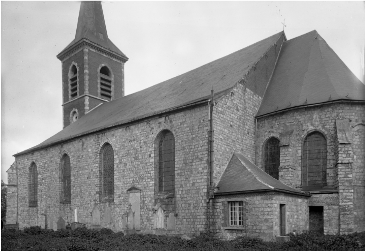
Gommegnies PH 1389

Vue extérieure des bas côtés de la nef de l'église et du cimetière, entre 1894 et 1914.