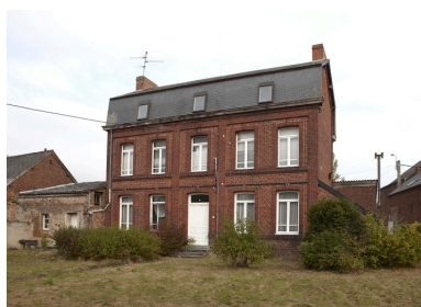
Vue générale du presbytère.