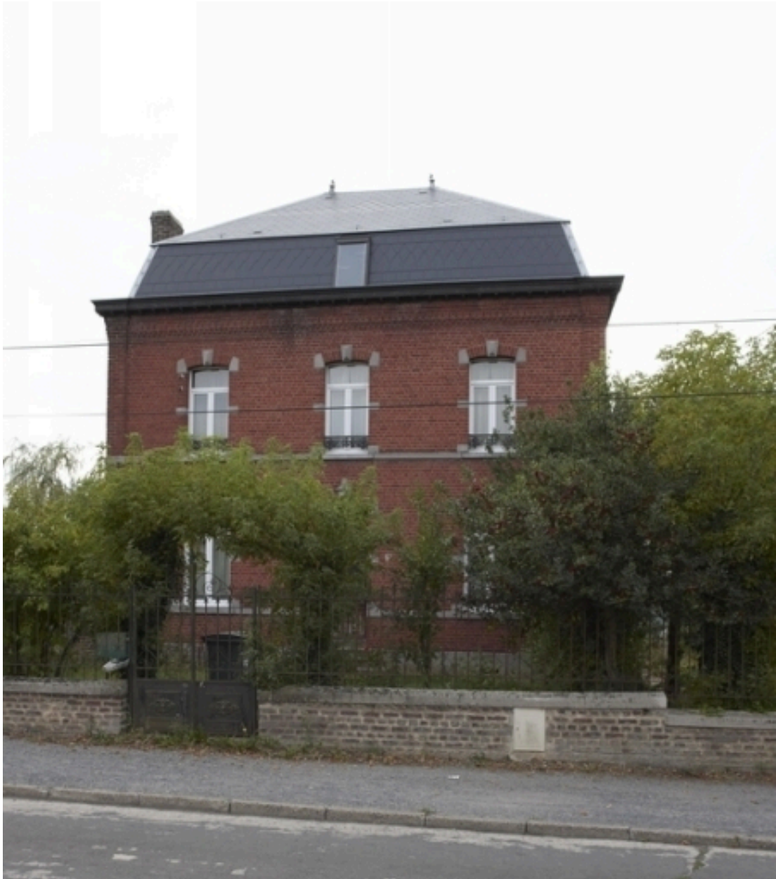
Vue générale de la maison d'industriel située 557 rue de la Gare.