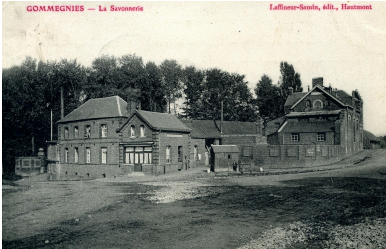
Vue de la savonnerie, place de la Gare.