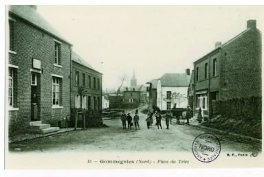
Vue de la Place du Triez. IVR31_20085900101NUCB