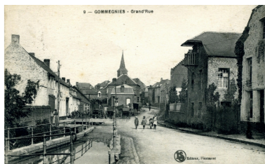
Vue du bas de la rue du Centre. IVR31_20105900030NUCB