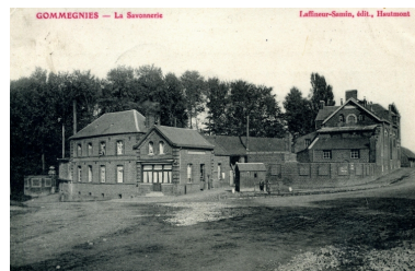
Vue de la savonnerie, place de la Gare. IVR31_20105900038NUCB