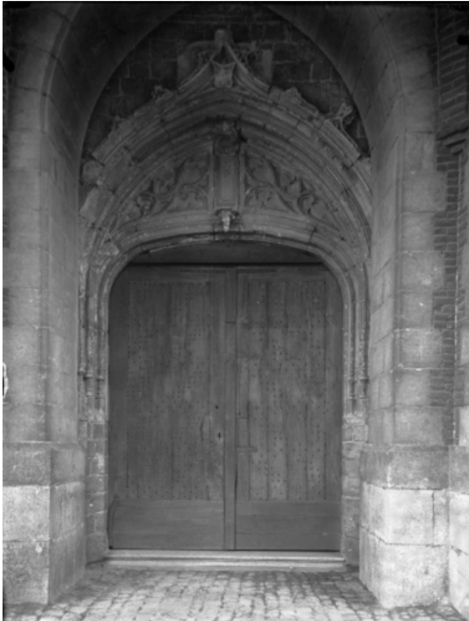
Gommegnies PH 1391

Vue du portail de l'église, entre 1894 et 1914.