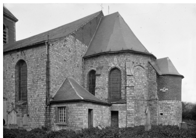
Vue du chevet de l'église, entre 1894 et 1914. IVR31_20085900252NUC