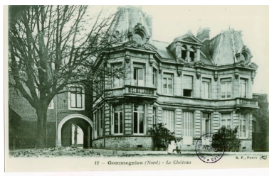
Vue du château depuis le parc. IVR31_20085900098NUCB