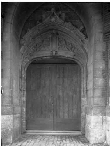
Vue du portail de l'église, entre 1894 et 1914.