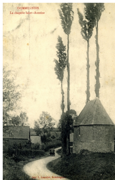
Vue de la chapelle Saint-Antoine à Hitonsart.