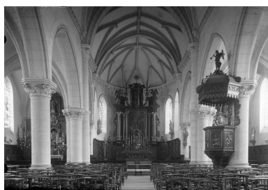
Vue de l'intérieur de l'église, entre 1894 et 1914. IVR31_20085900254NUC