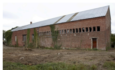
Vue générale d'une fabrique de compote et de pâtes de pomme, située rue de la Gare (logement patronal 557 rue de la gare).