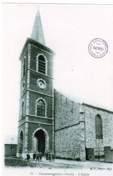
Vue générale de l'église au début du 20e siècle.