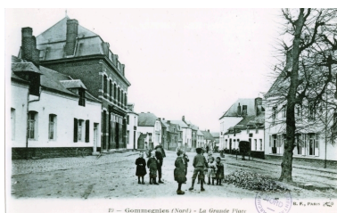
Vue de la Grande Place.