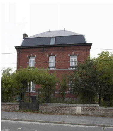
Vue générale de la maison d'industriel située 557 rue de la Gare.