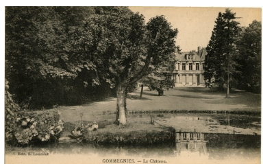
Vue du château et du parc (AD Nord, 5 Fi Gommegnies, n°18). IVR31_20085900099NUC