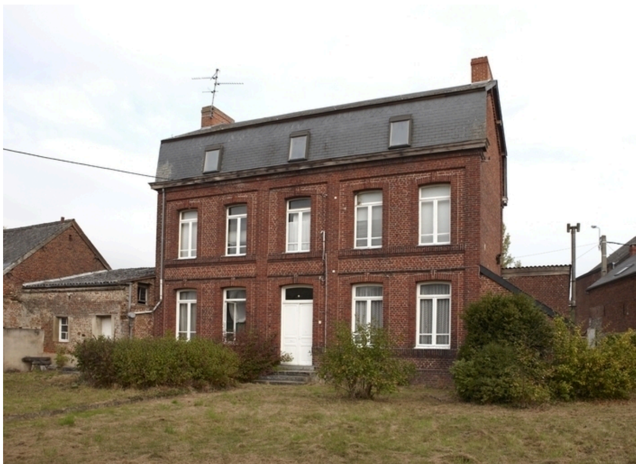
Vue générale du presbytère.