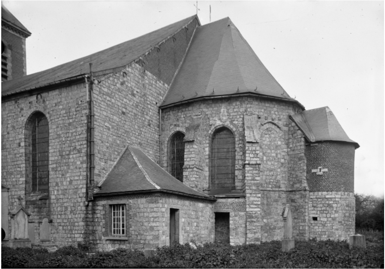
Gommegnies PH 1390

Vue du chevet de l'église, entre 1894 et 1914.